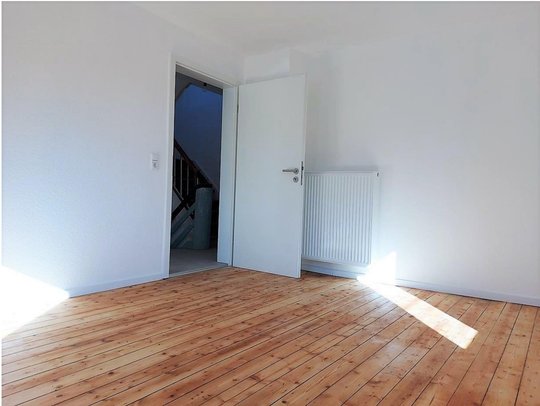
Maisonette – Schlafzimmer