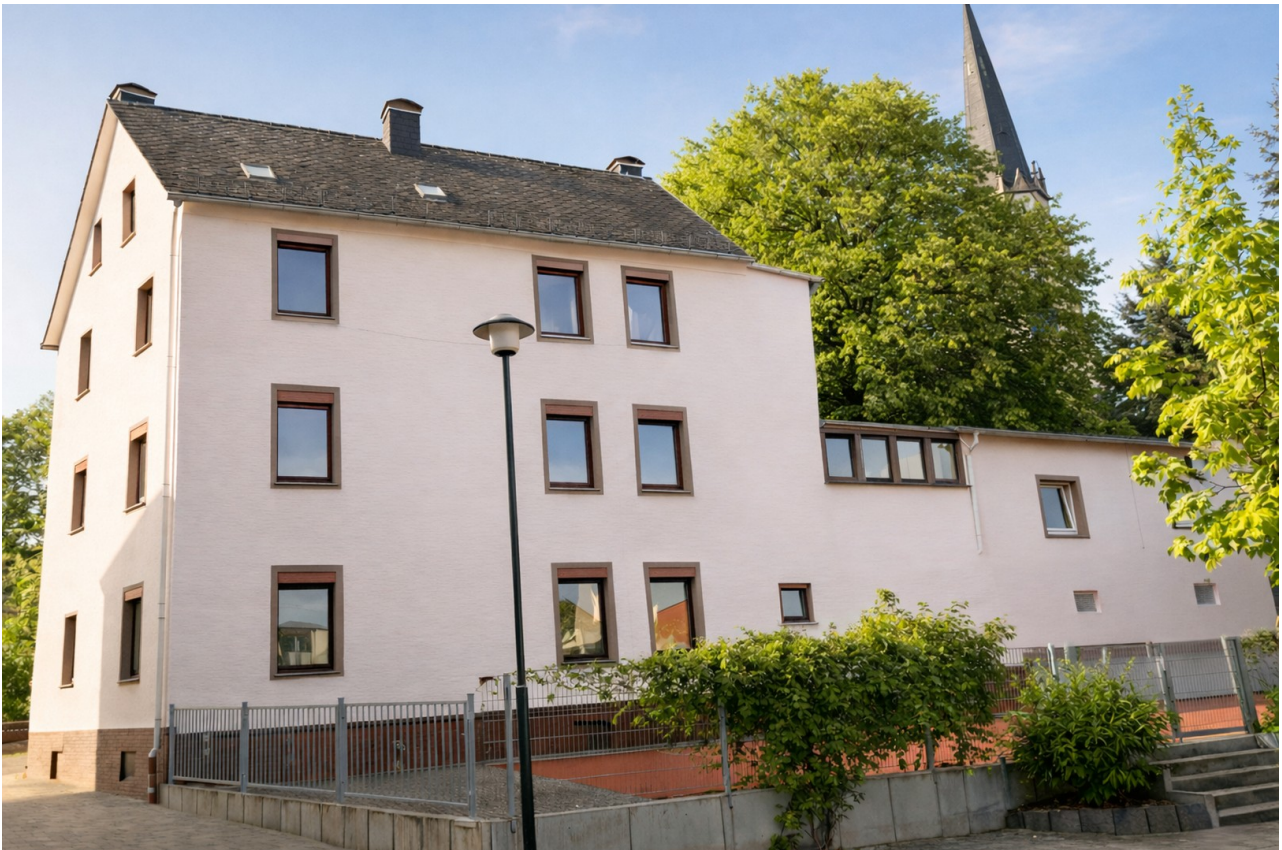
Außenansicht des Gebäudes