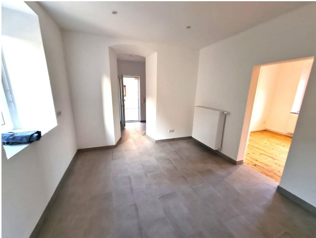
Küche (weitere Wohnung)