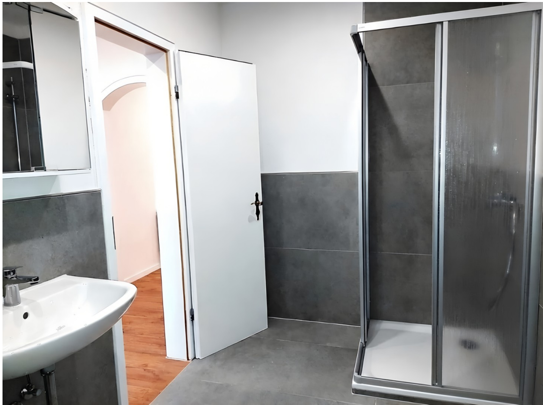
Badezimmer (weitere Wohnung)