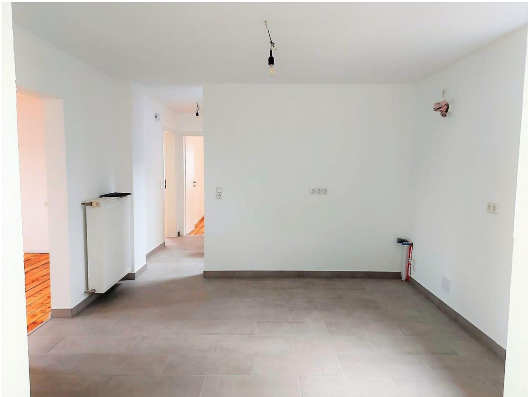
Maisonette – Küche