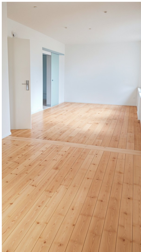
Großzügiger Wohn- & Essbereich