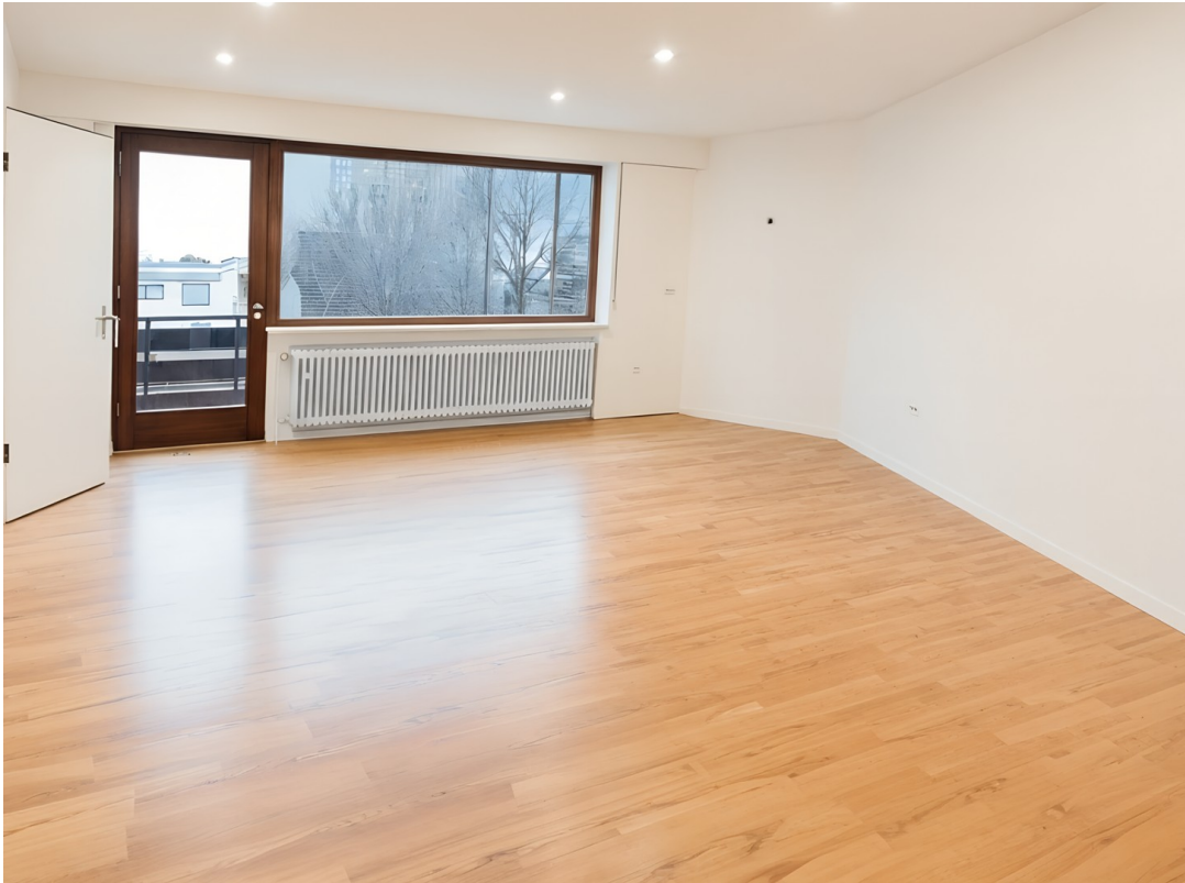
Wohnzimmer (weitere Wohnung)