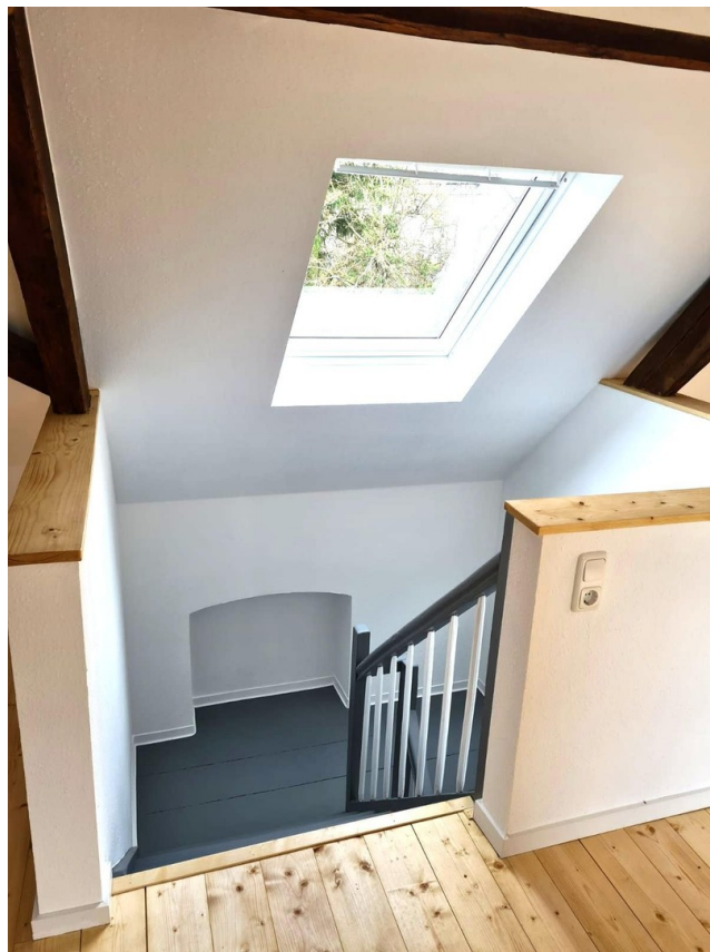
Maisonette – Treppenabgang