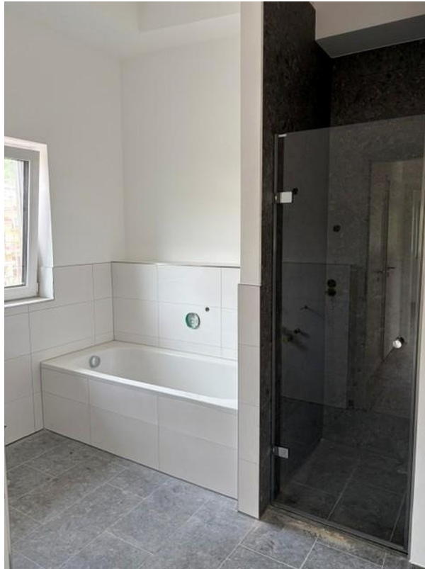
Bad mit Wanne + Dusche