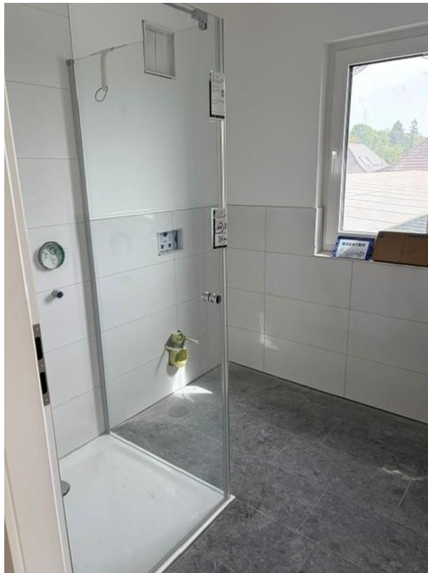
Kleines Bad mit Dusche