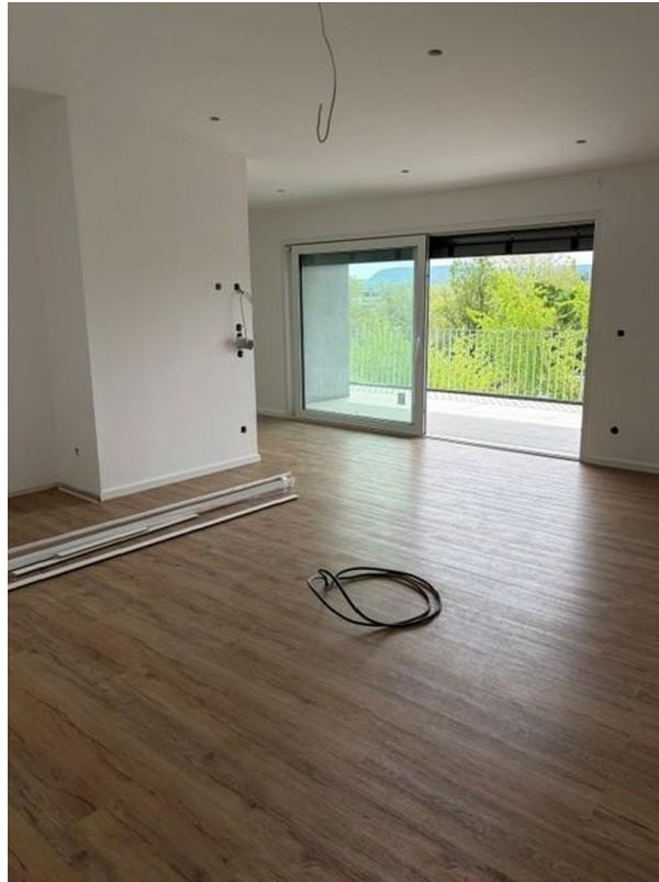
Küche mit Südbalkon