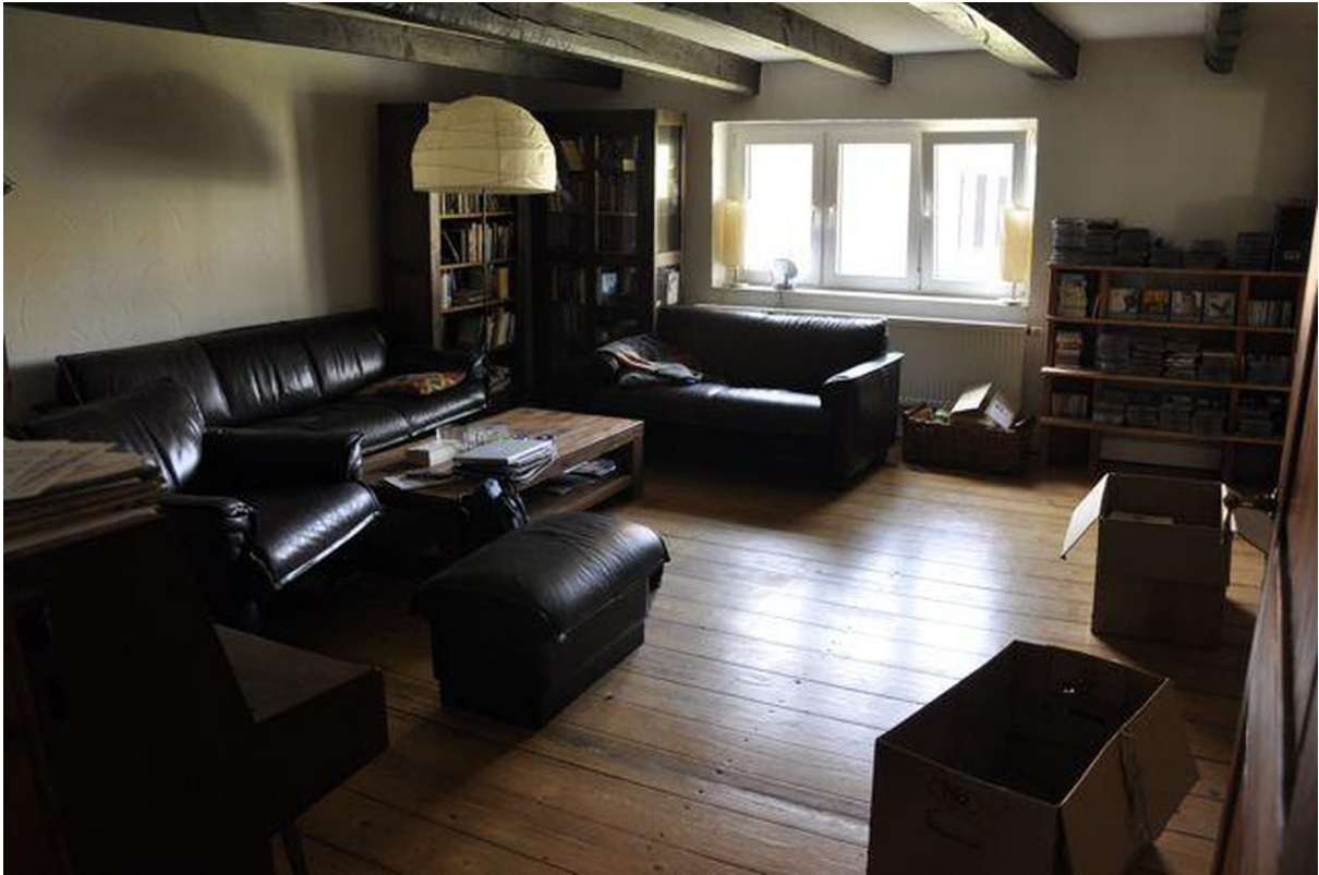
Wohnen 1. Stock