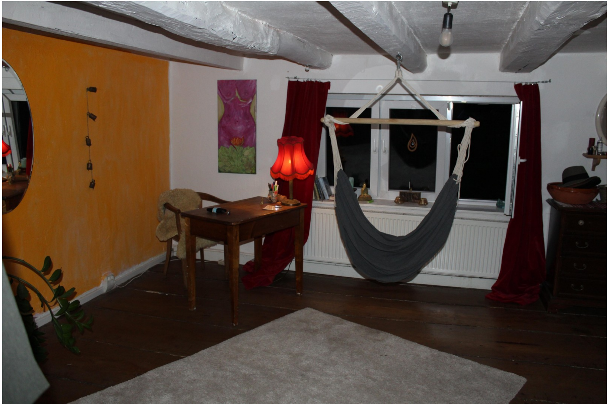
Wohnen 1. Stock