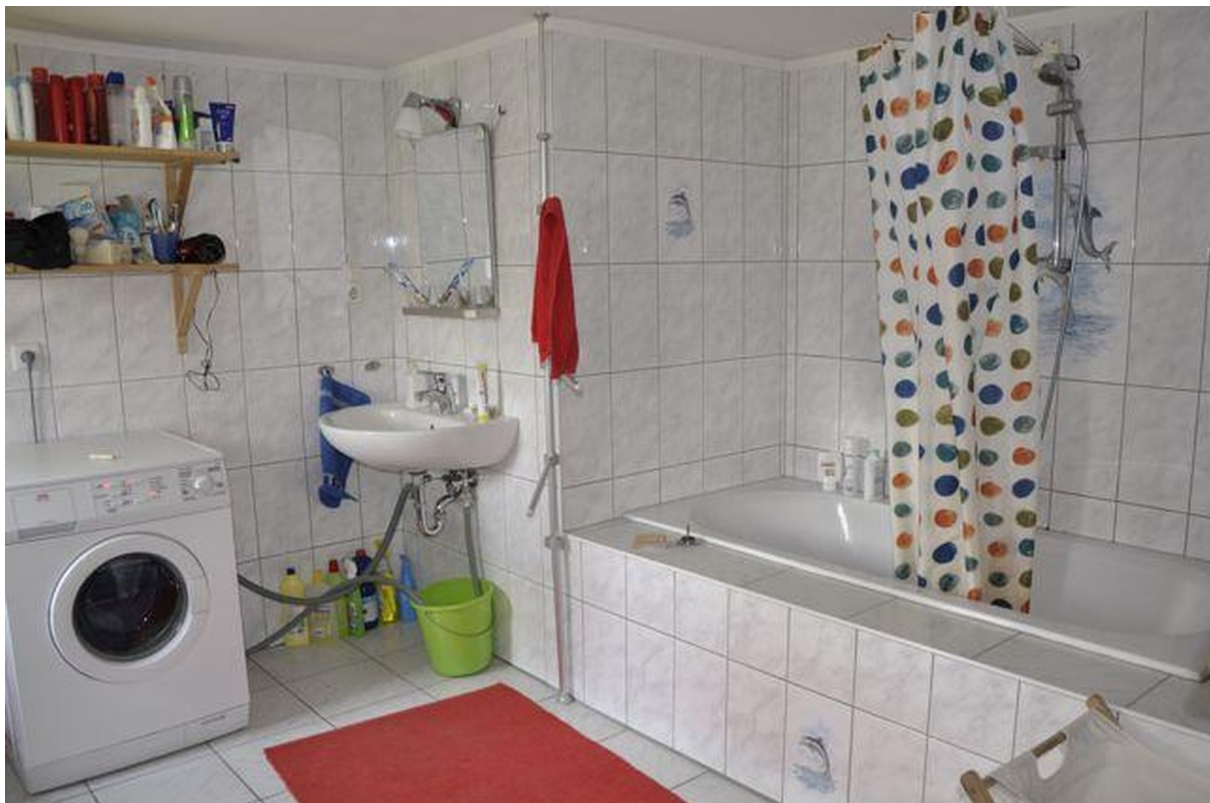
Bad 1. Stock