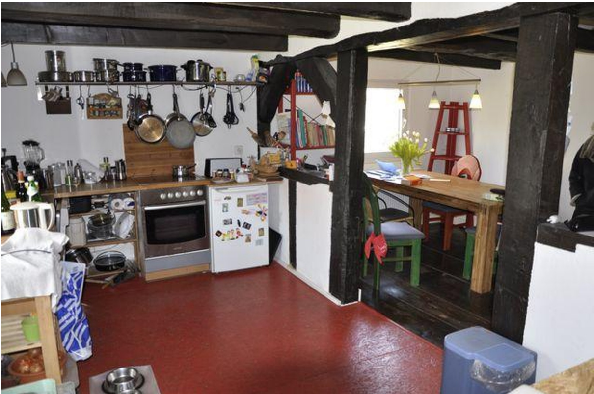
Küche 1. Stock