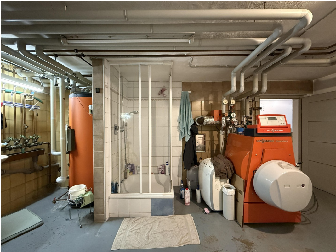
Heizraum und Dusche UG