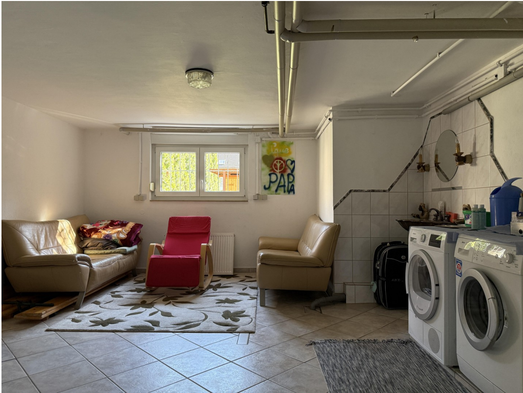
Waschküche / Hobbyraum