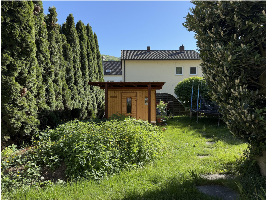
Garten mit Sauna