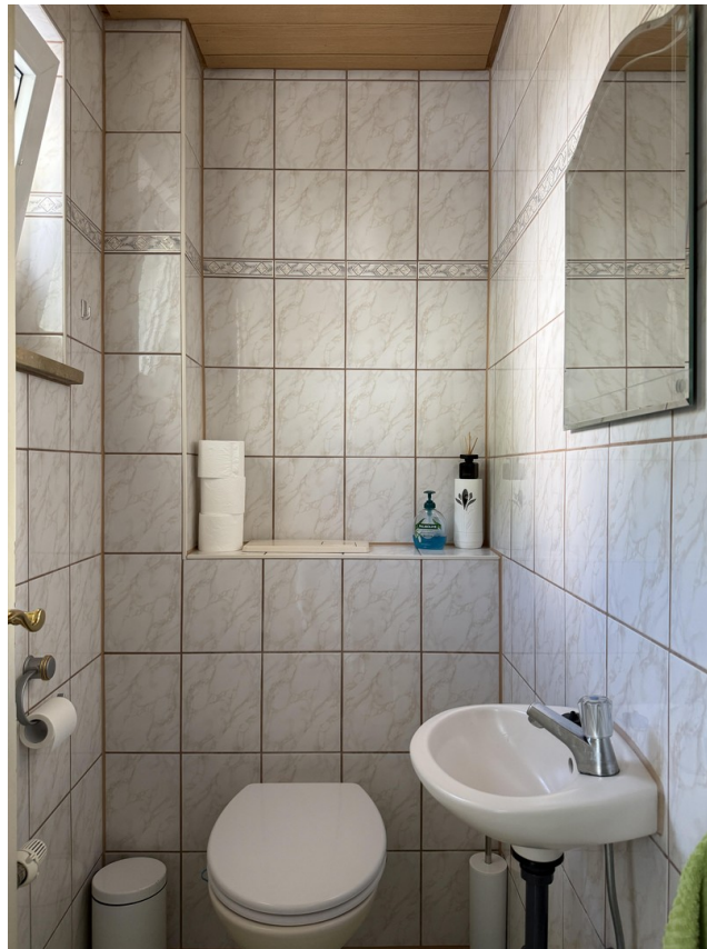
Gäste WC Erdgeschoss