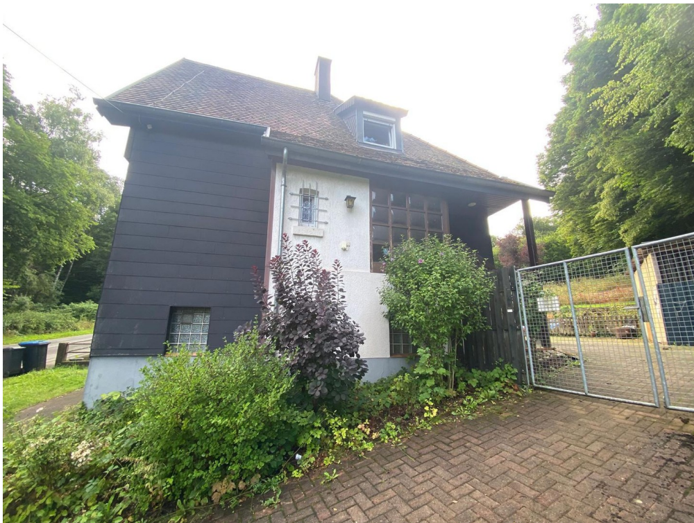
Seitenansicht mit Zufahrt