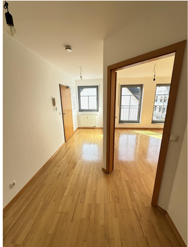
Diele / Eingangsbereich