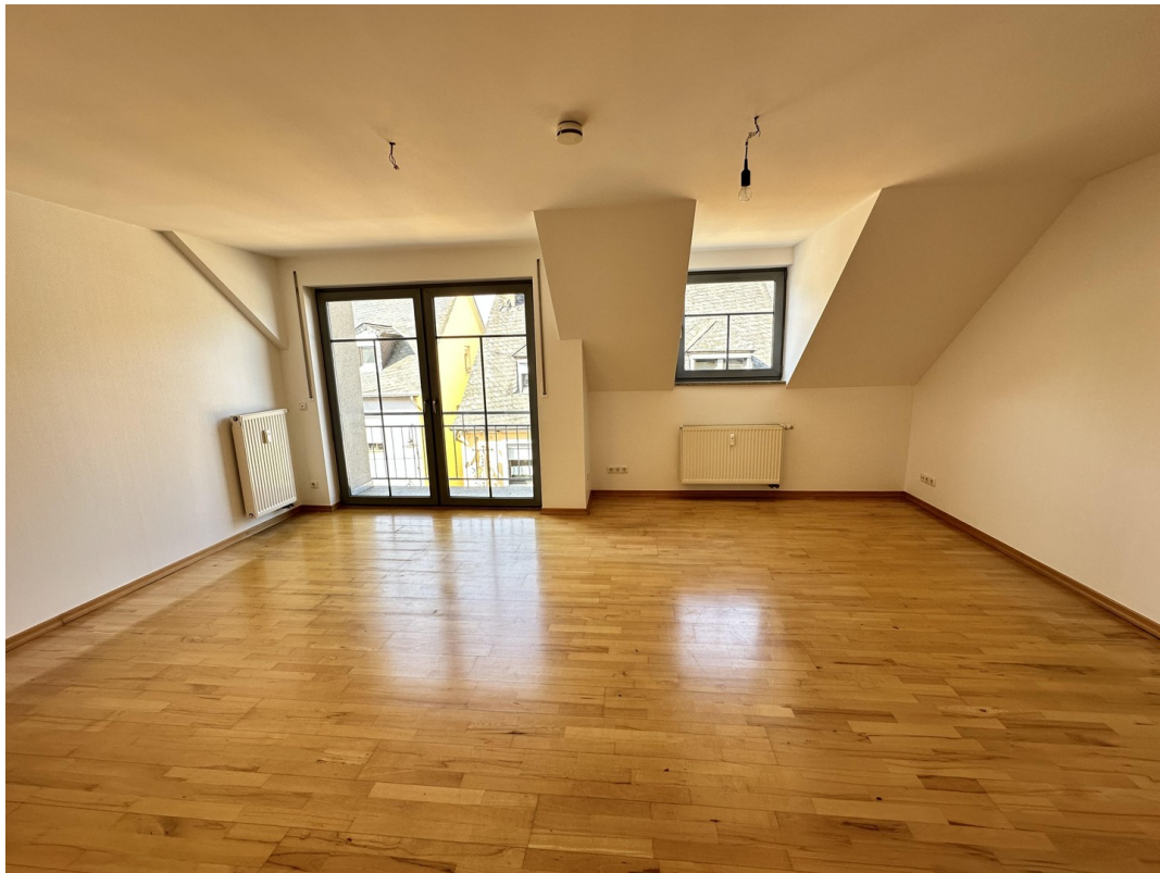
Wohn- / Esszimmer