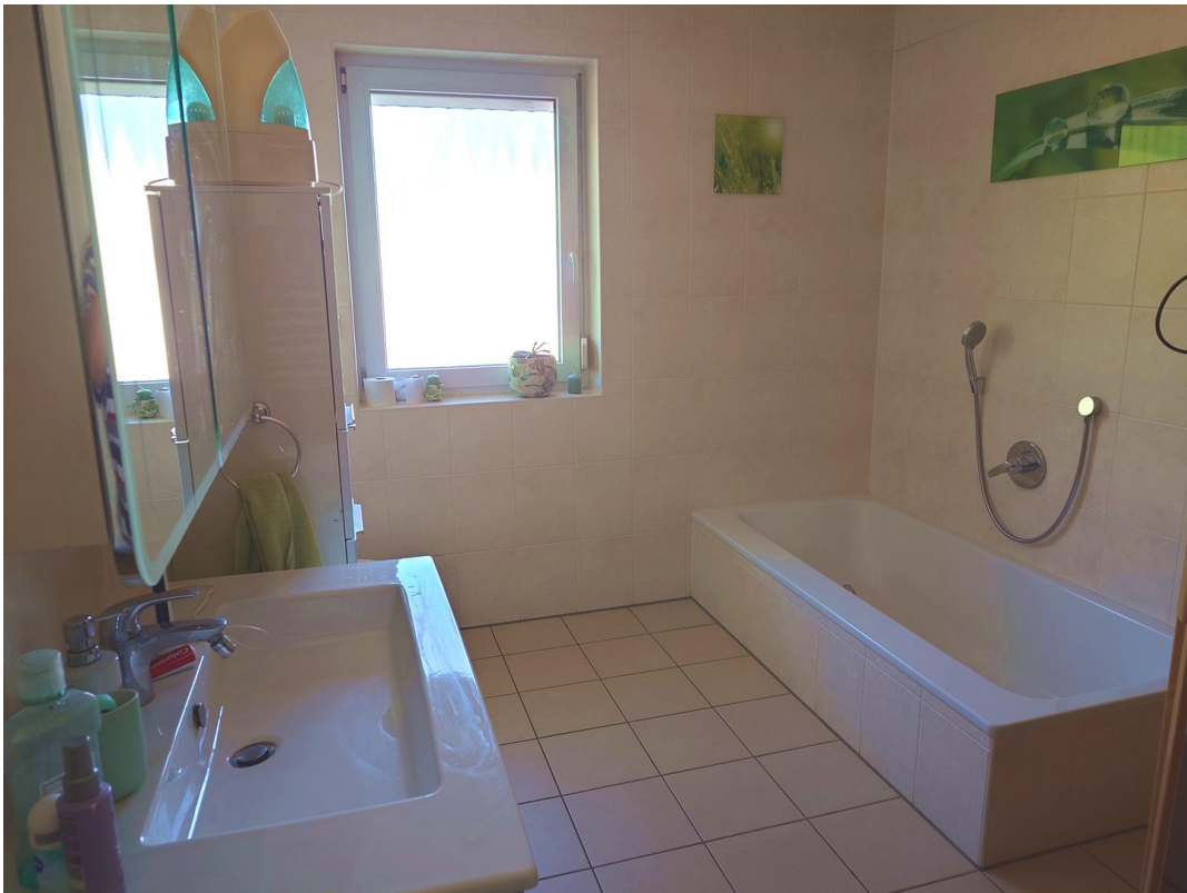
1. Badezimmer mit Badewanne