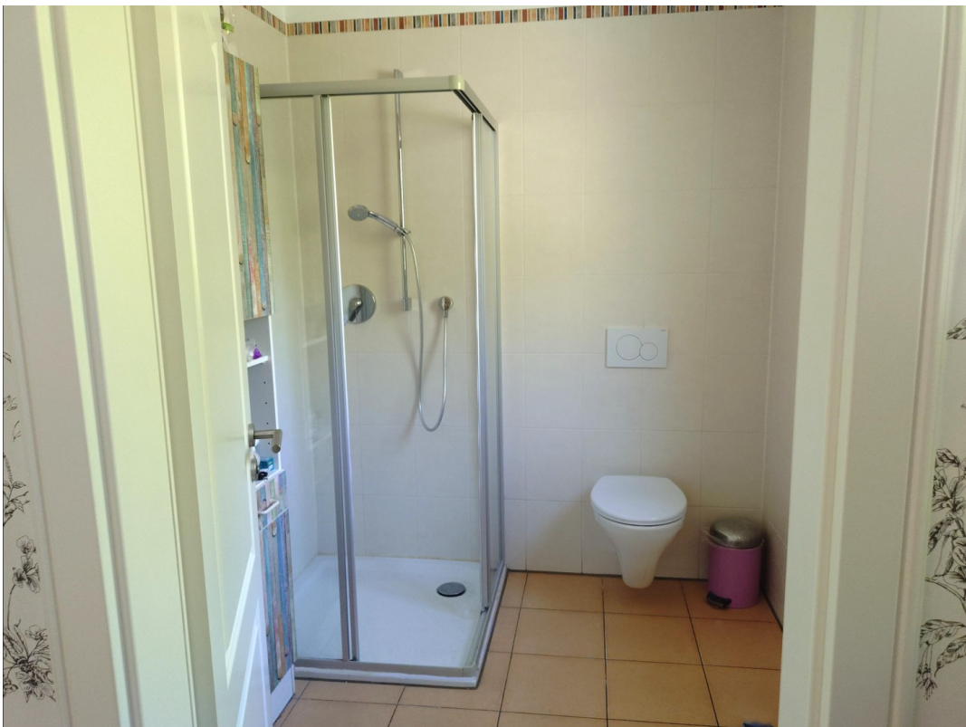
Bad im Erdgeschoss