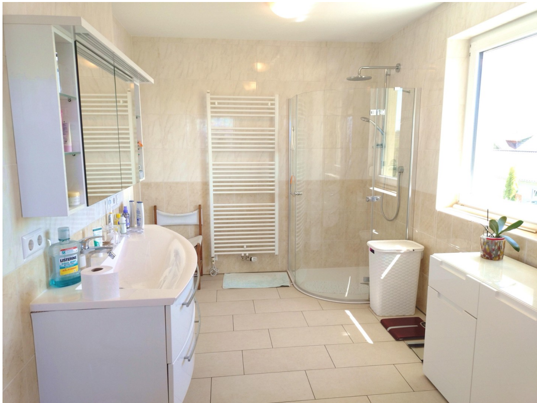
Elternbad mit Dusche