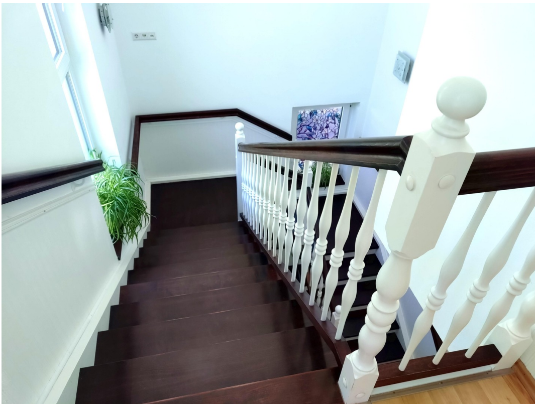
Treppe von oben