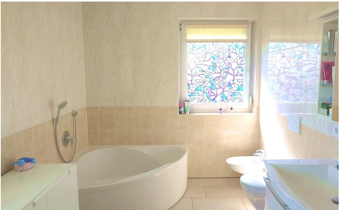
Elternbad, Badewanne, Bidet