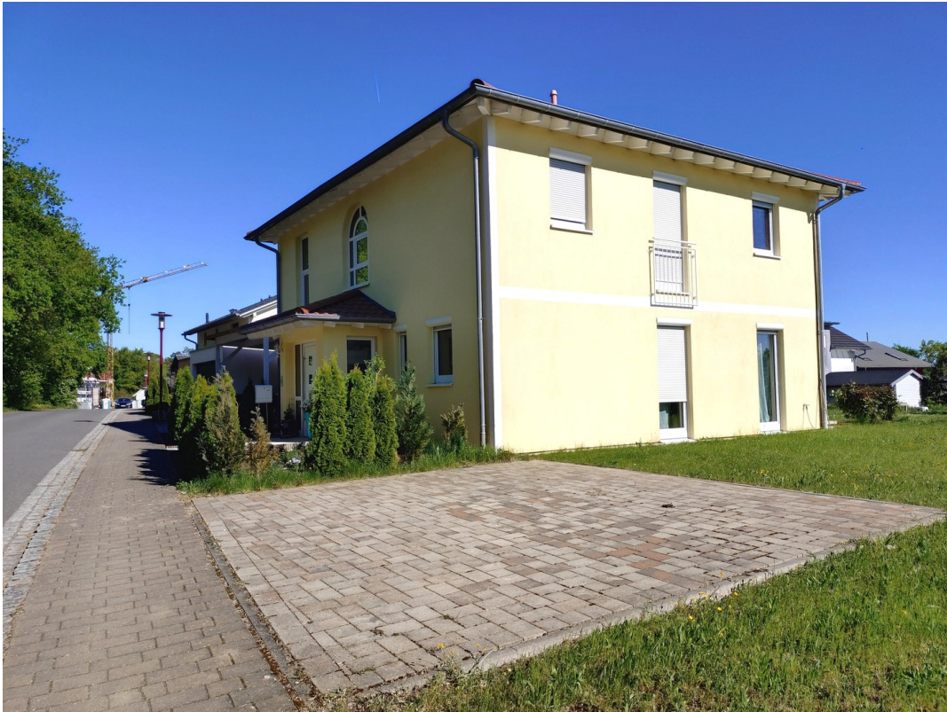
2. Stellplatz für 2 Autos