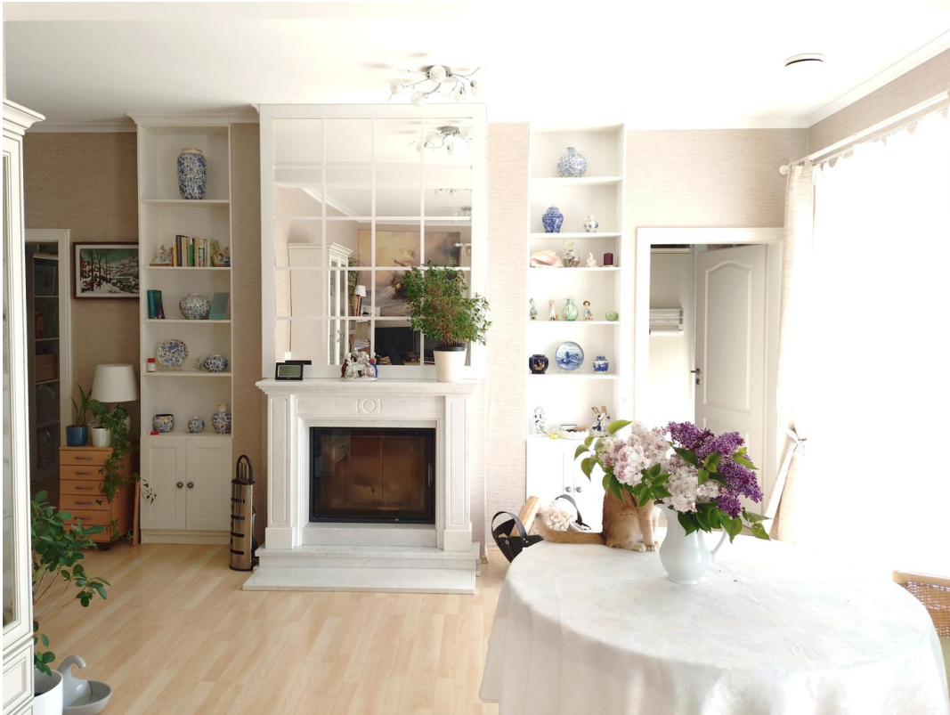
Kamin im Wohnzimmer