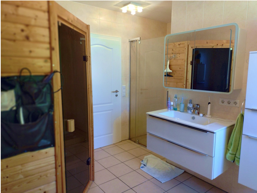
1. Badezimmer mit Sauna