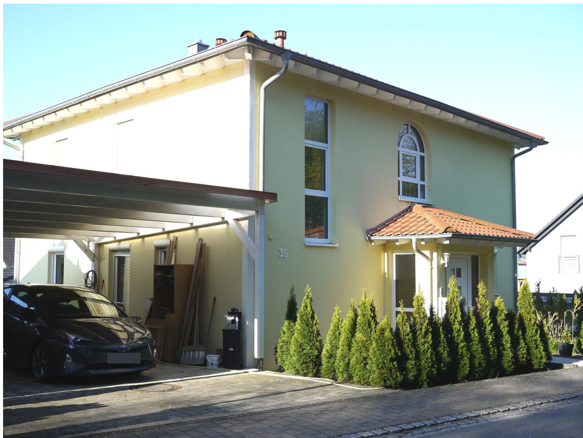
Carport und Eingang