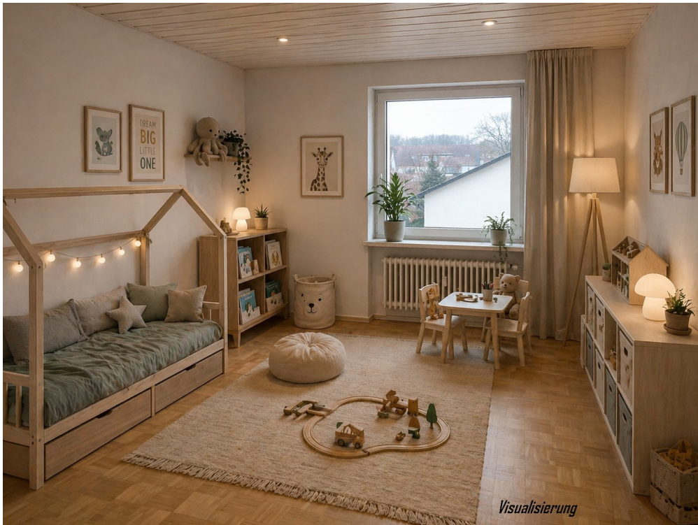
Zimmer - Visualisierung Kind