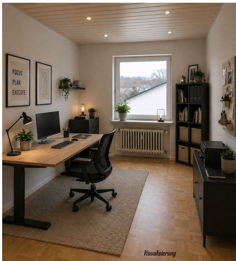
Zimmer - Visualisierung Büro