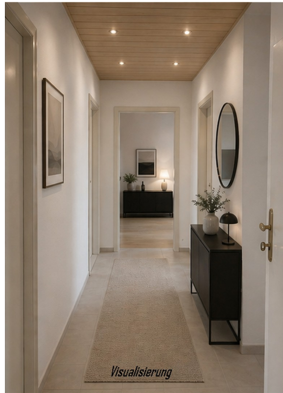
Flur - Visualisierung