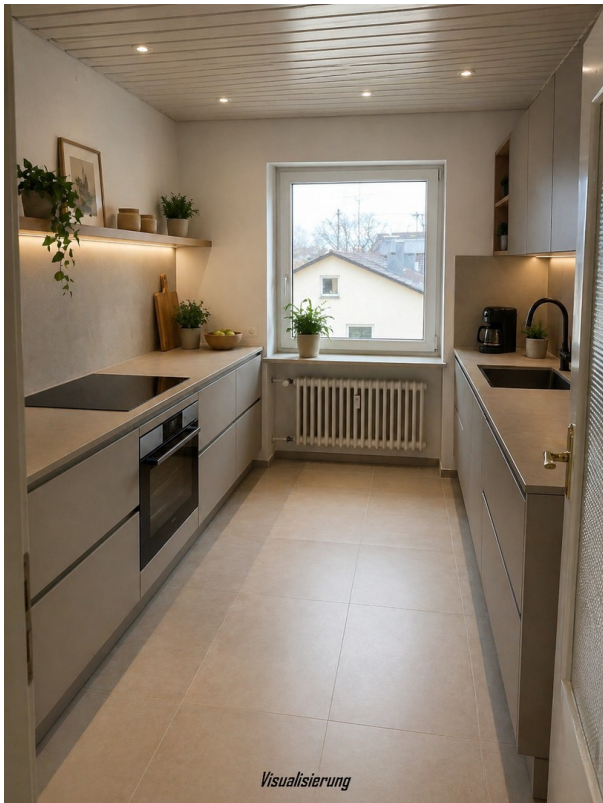
Visualisierung Küche - Visualisierung