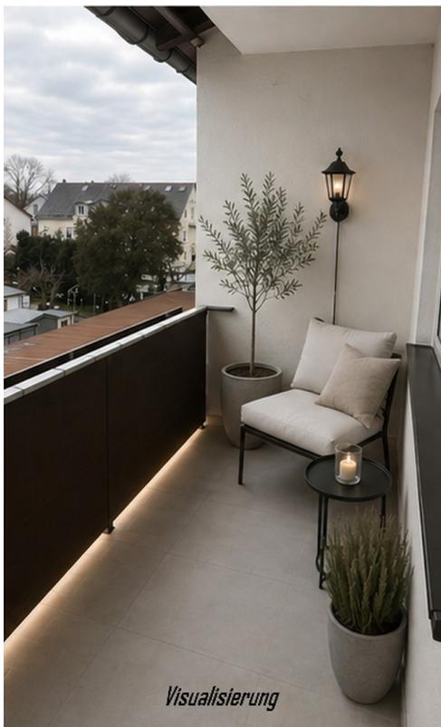
Balkon - Visualisierung