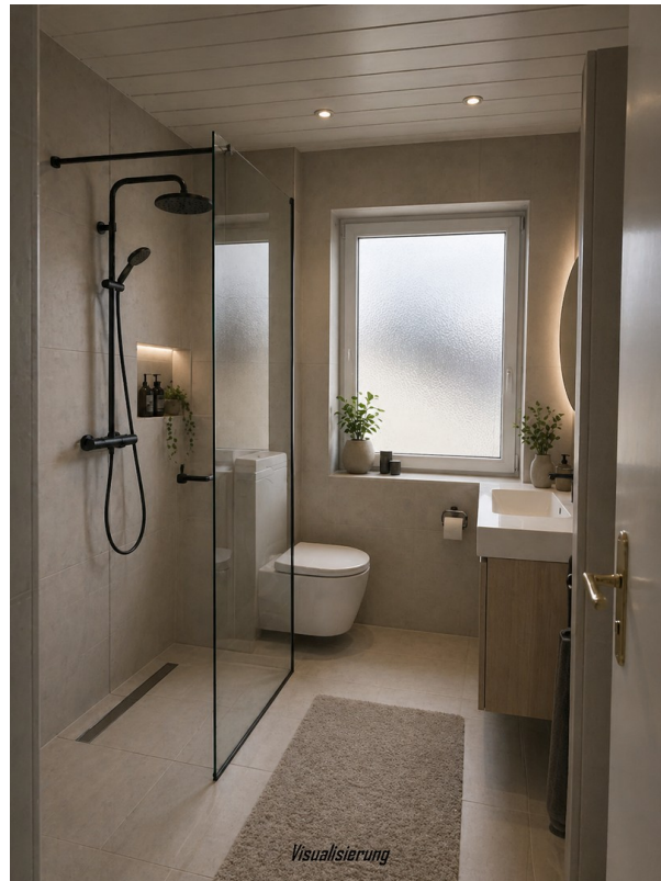
Bad - Visualisierung