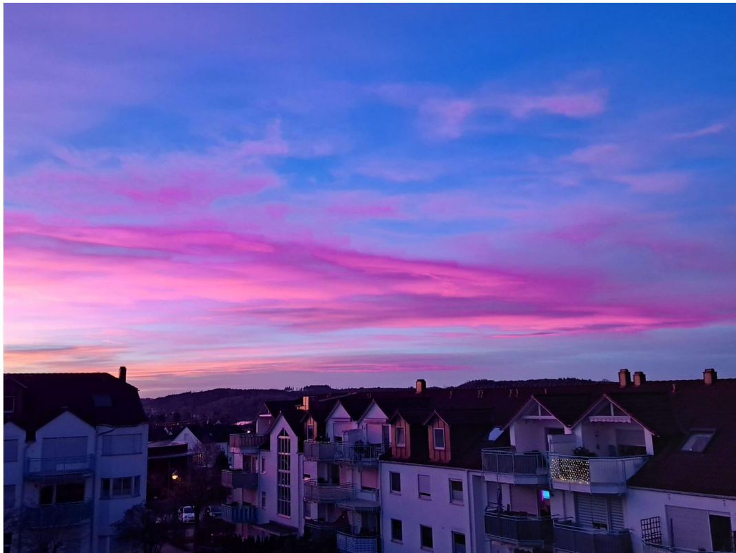
Blick auf den Sonnenuntergang