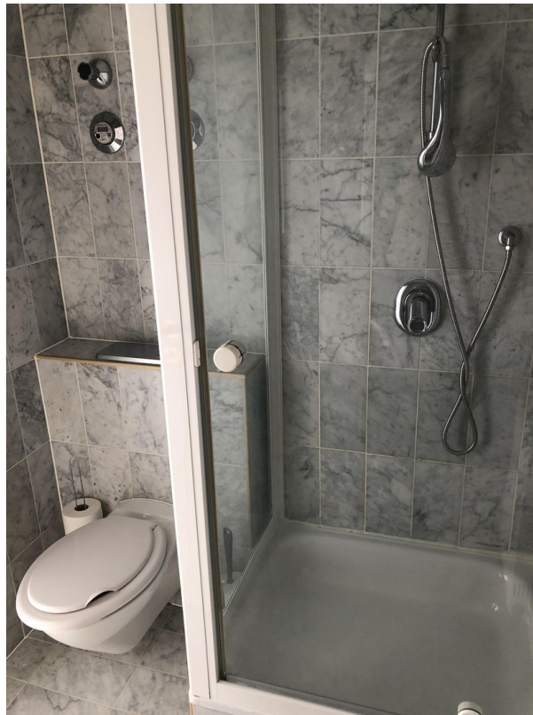
Bad mit WC & Dusche