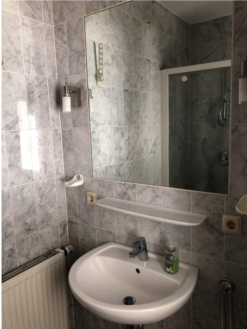
Bad mit großen Einbauspiegel