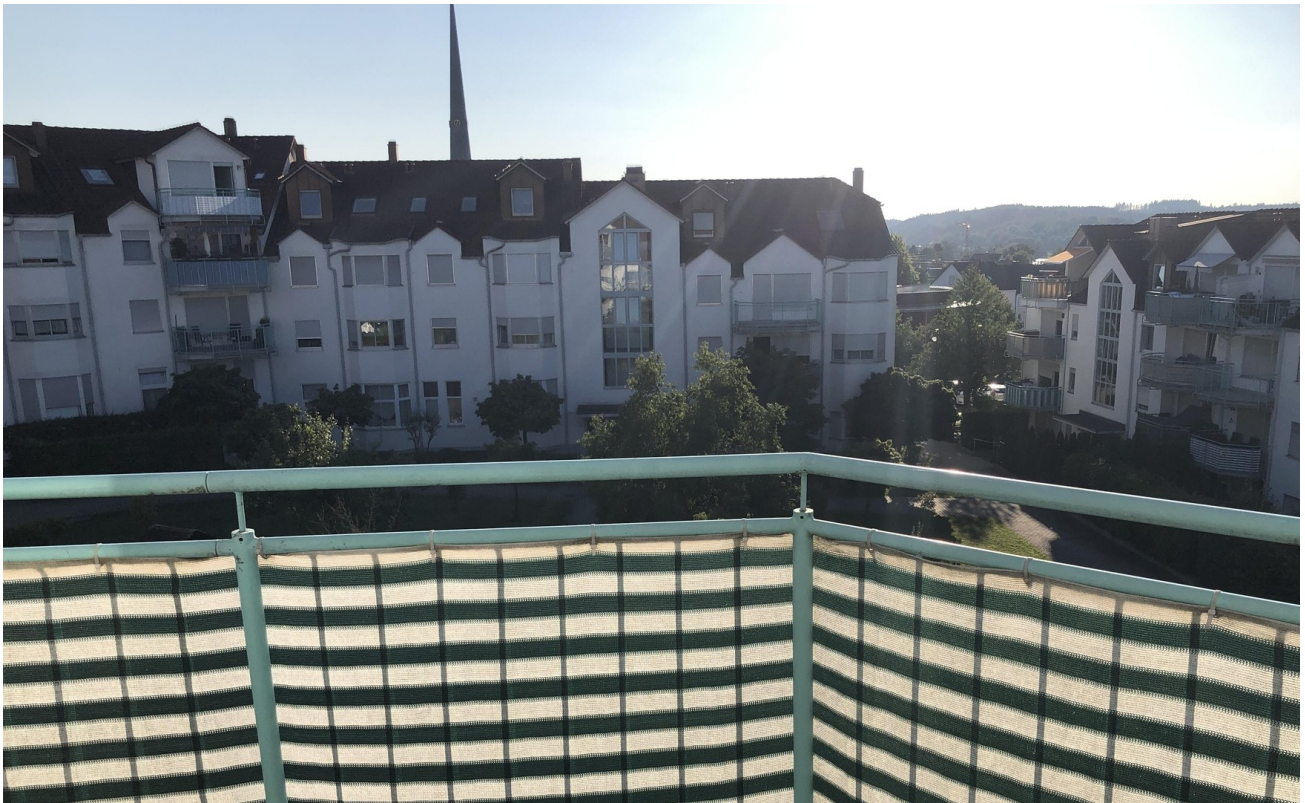
Ausblick vom Westbalkon