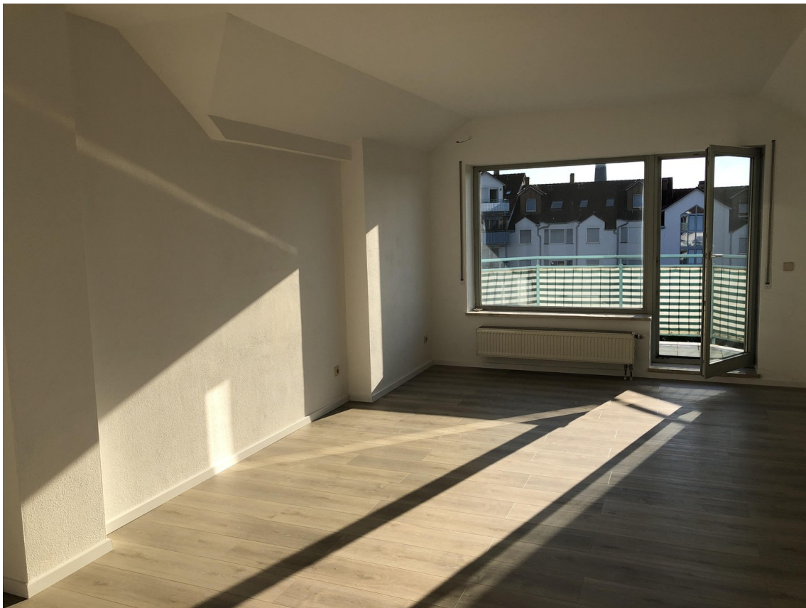
Blick in die Wohnung