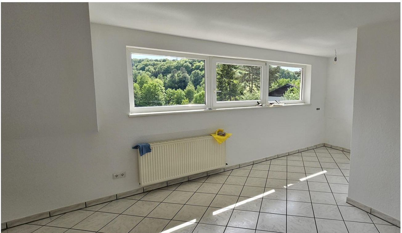
Wohnzimmer ohne Küche