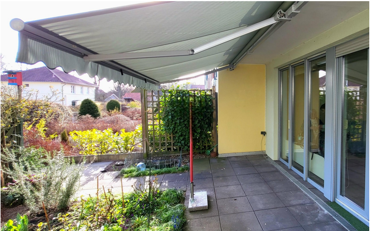
Terrasse mit Markise