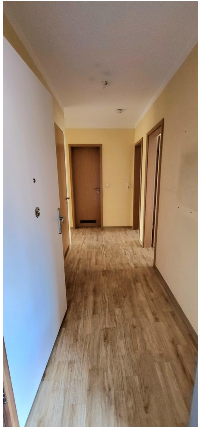
Eingang / Diele