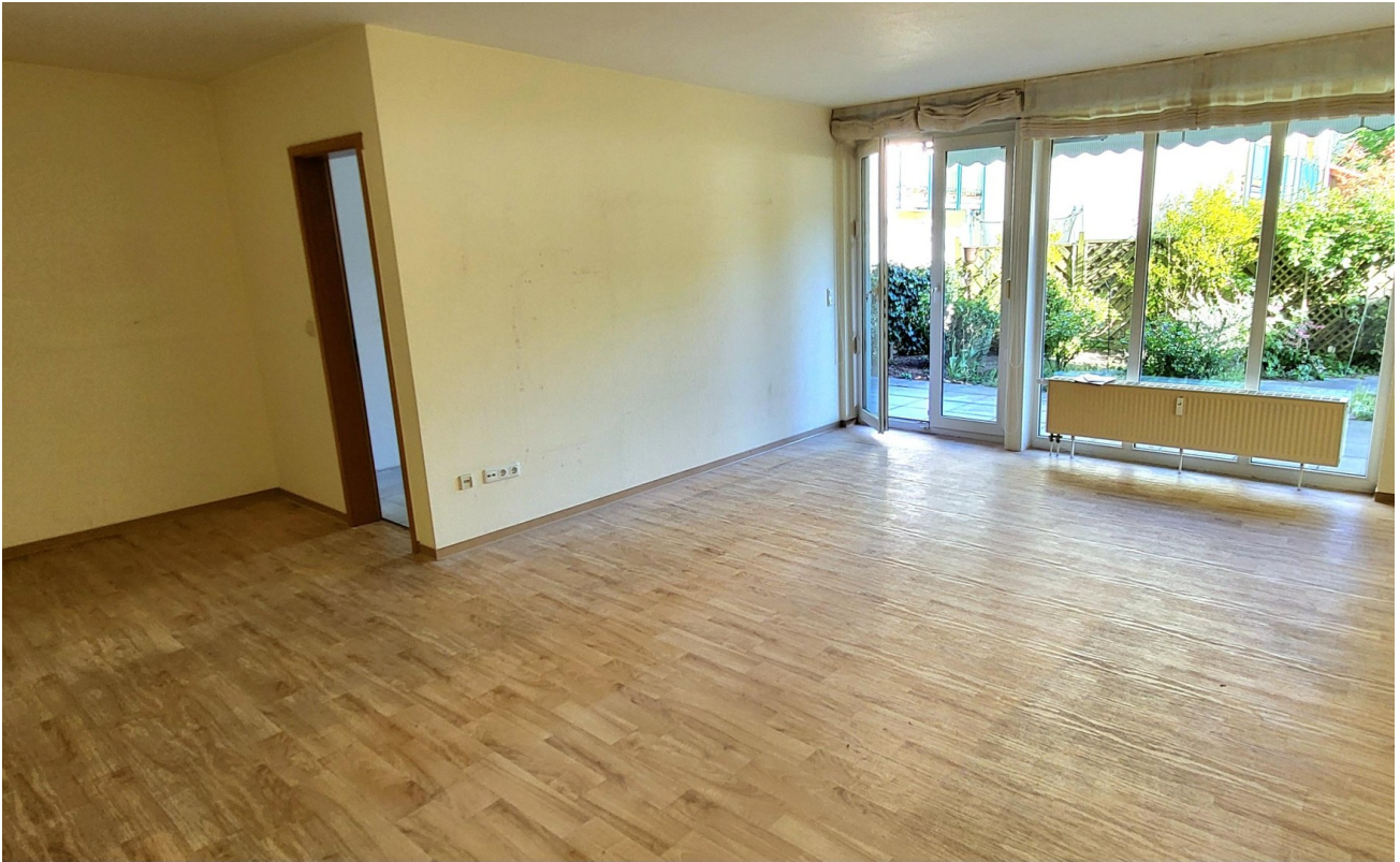
Wohn- / Essbereich