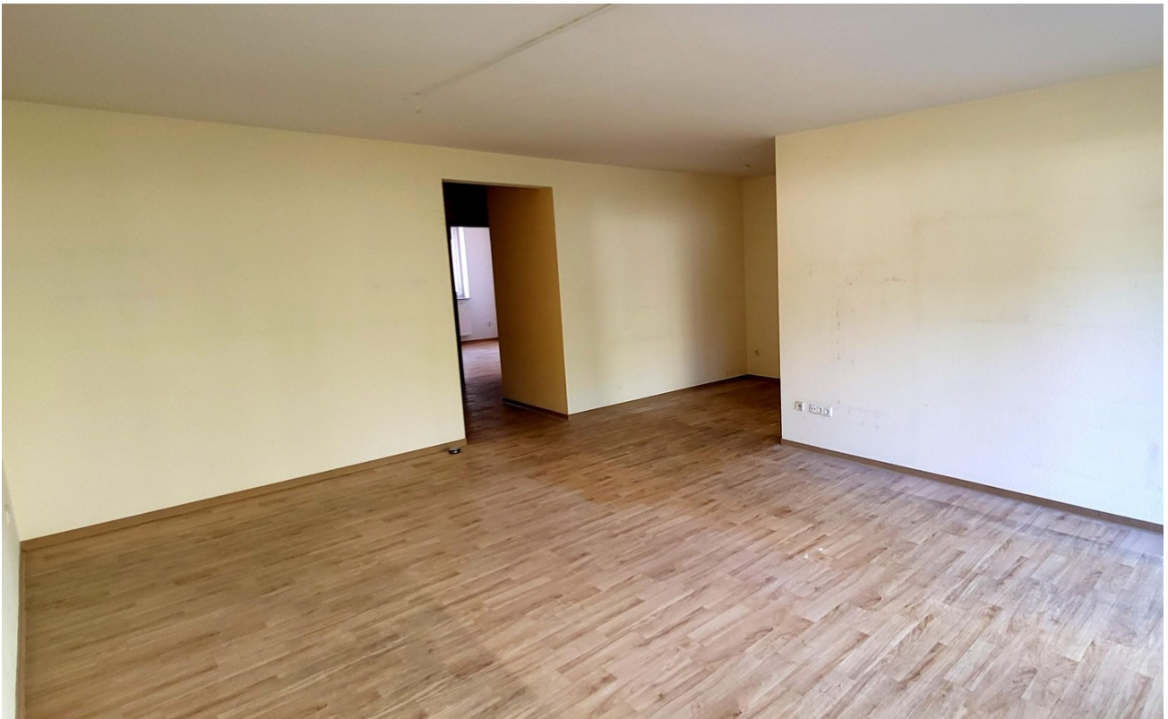
hell und großzügig