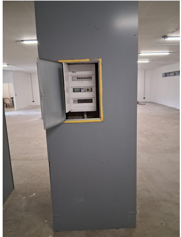
Halle im Erdgeschoss (Strom)