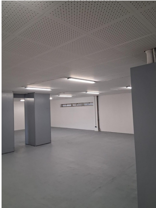
Halle im Erdgeschoss