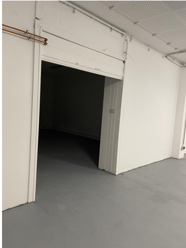
Durchgang (2. separater Raum)