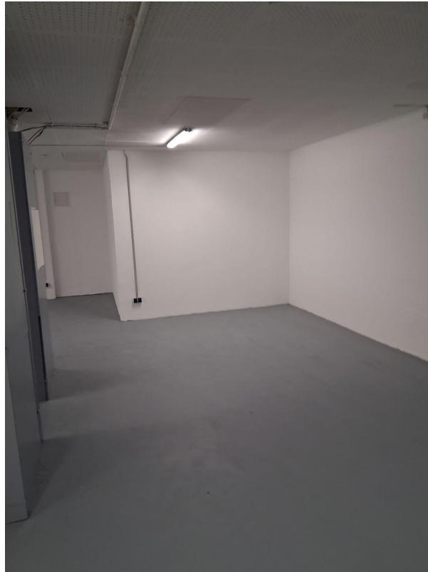
Halle im Erdgeschoss