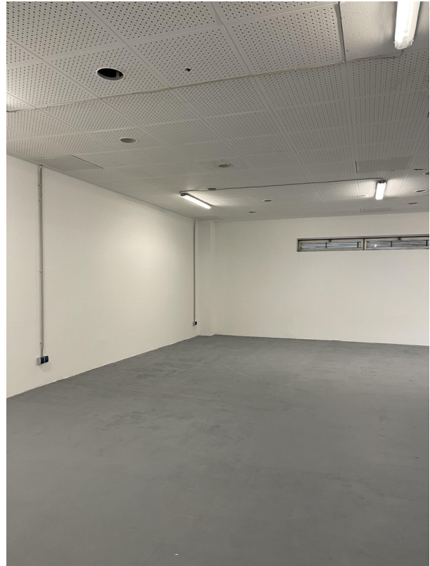
Halle im Keller