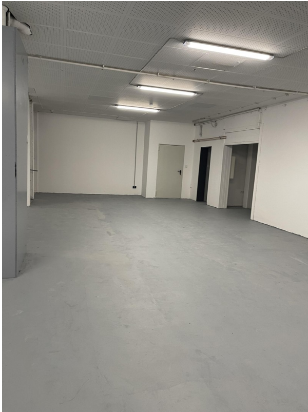
Halle im Erdgeschoss