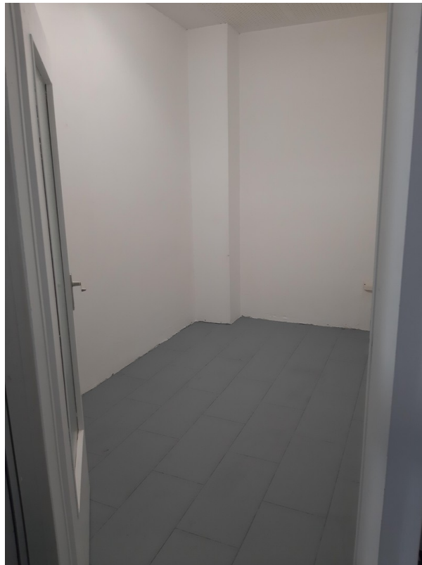
Raum (1. separater Raum)