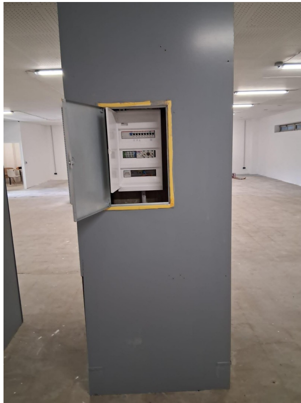
Halle im Erdgeschoss