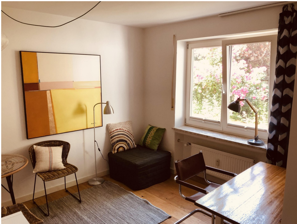
Gäste-Arbeitszimmer mit WC