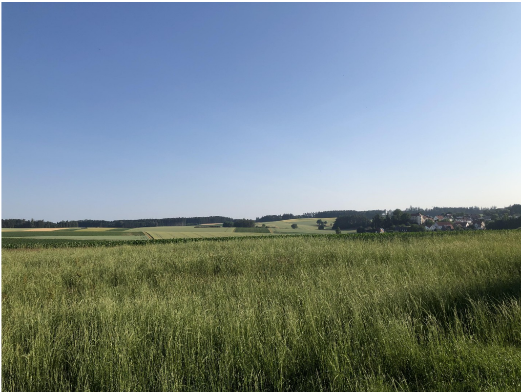
Nord - Ansicht aus Garten