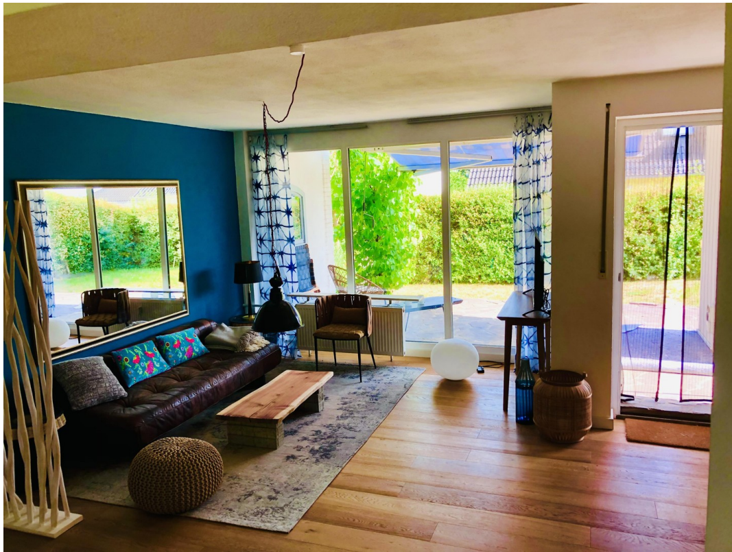
Living mit Terrassentür