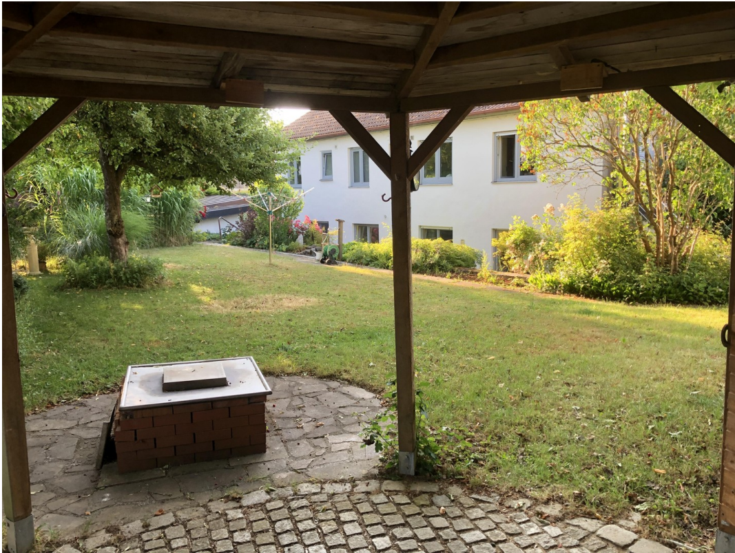
Pavillon mit Feuerstelle