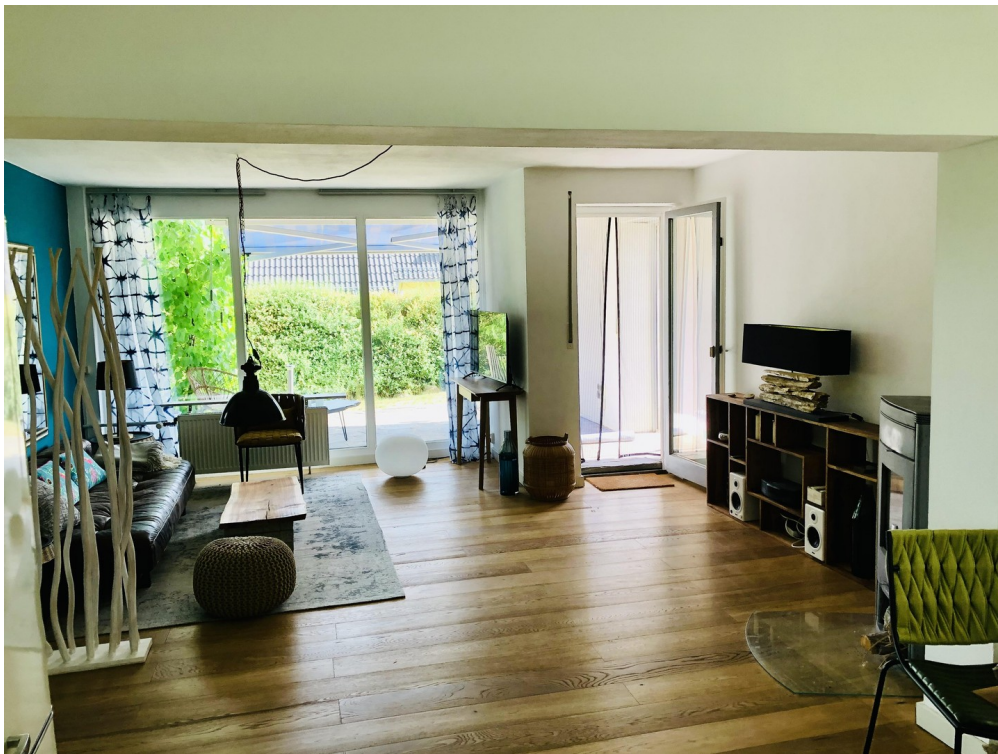
Living - Room Terrasse