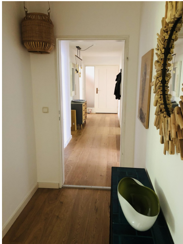
Flur mit Wohnungseingangstür