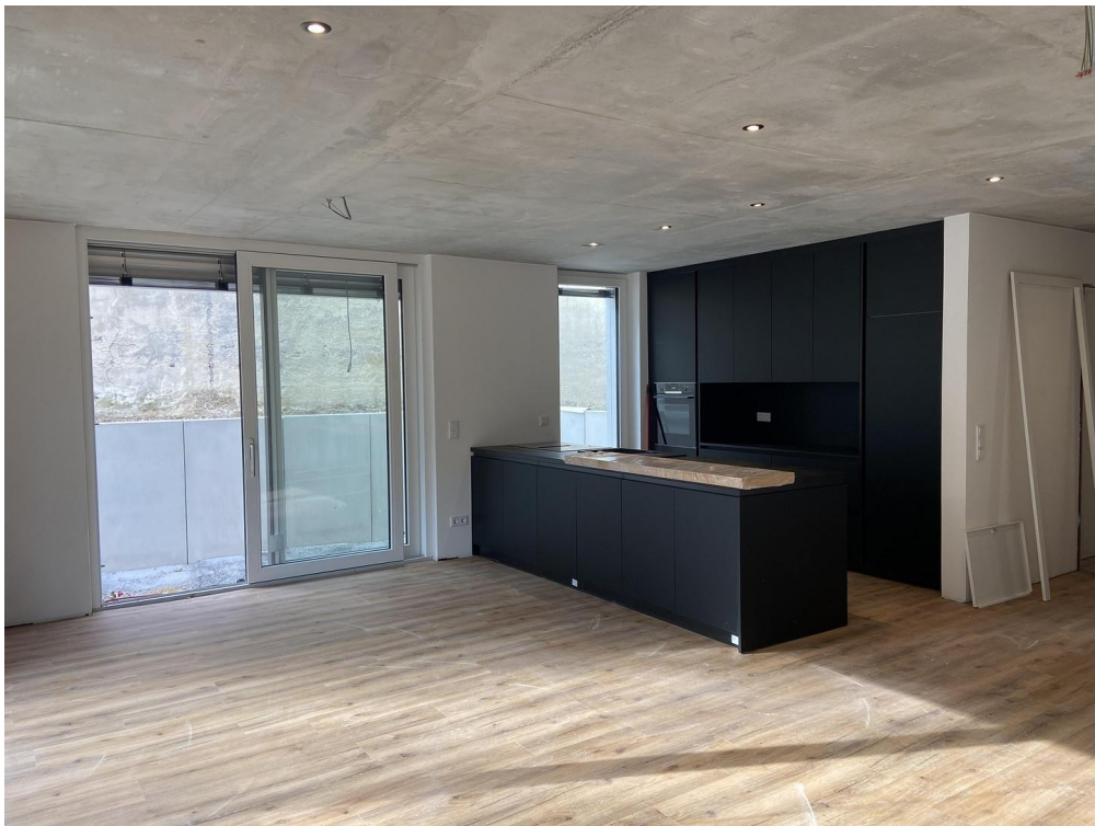
Wohn-Ess-Küche mit Terrasse