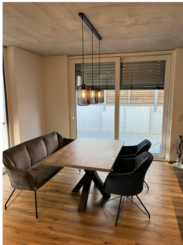
Essbereich mit Terrassenzugang