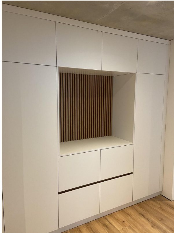
Garderobenschrank im Flur