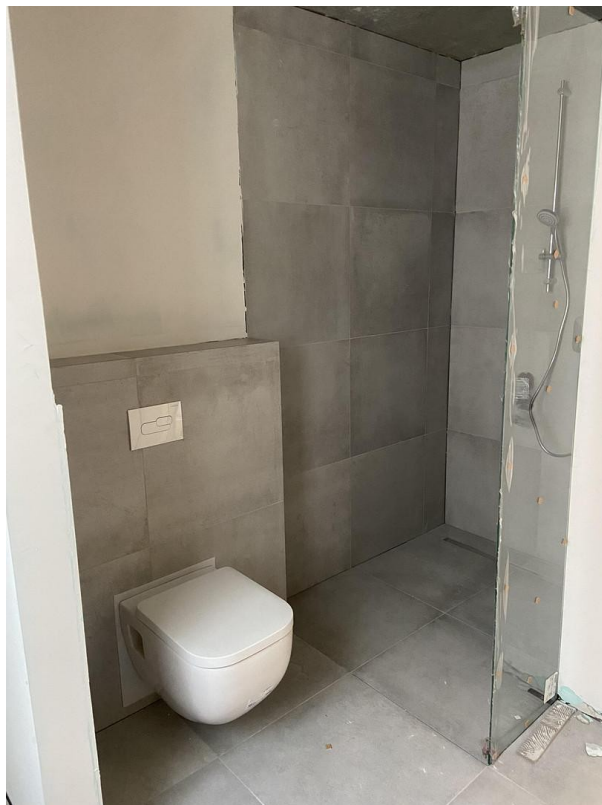
Badezimmer (während Bauphase)