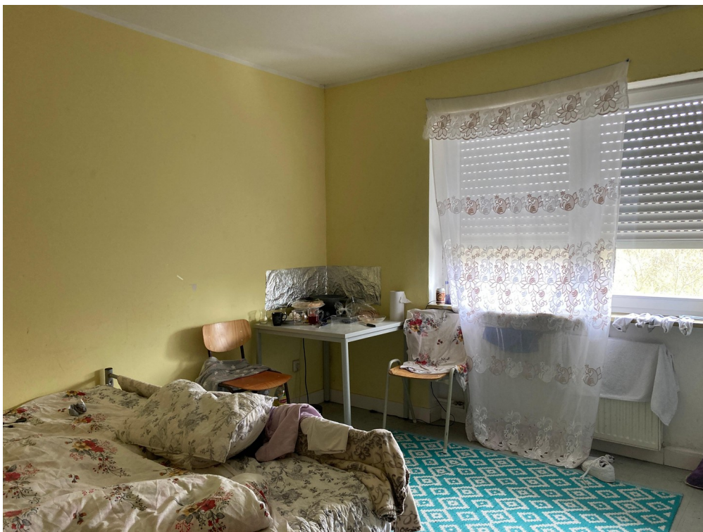
Wohnung im bewohnten Zustand