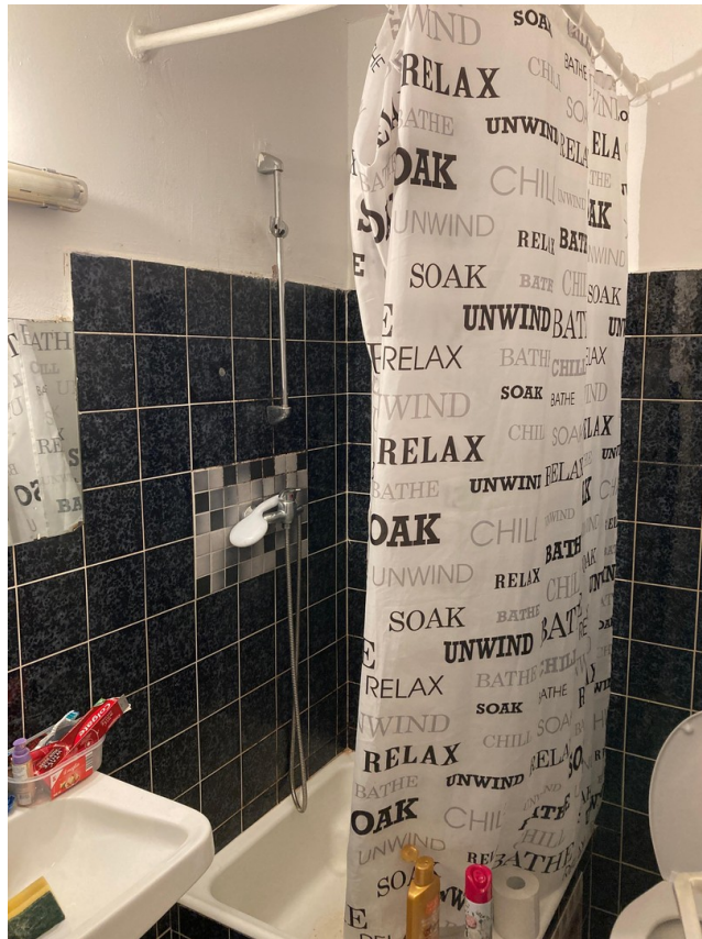
Bad im bewohnten Zustand