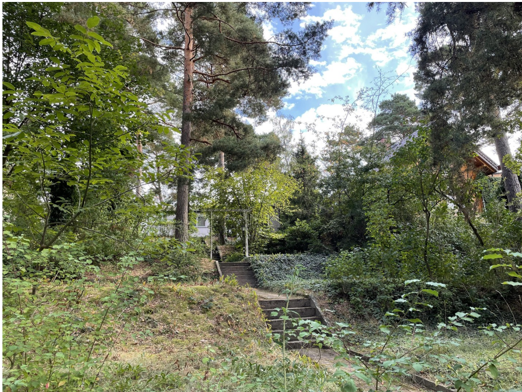
Ansicht von der Straße