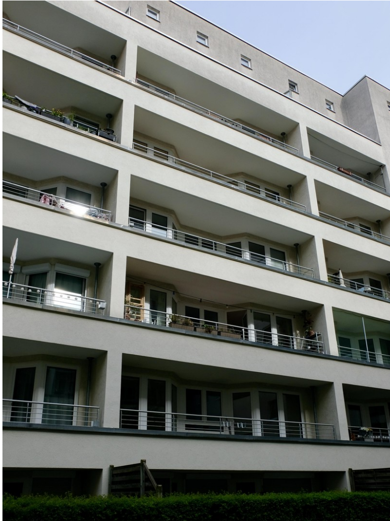
Blick vom Innenhof