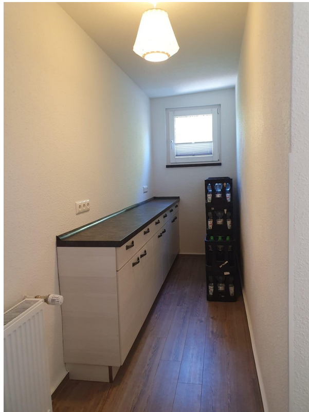
Abstellraum mit Garagenzugang