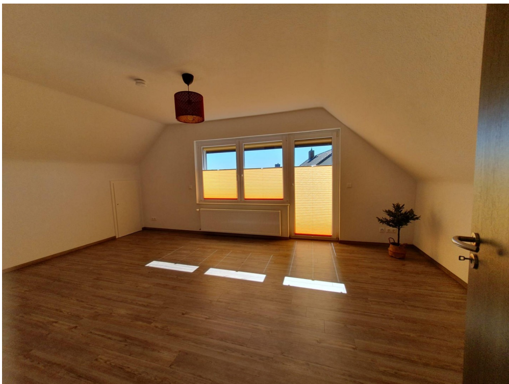
Zimmer mit Balkon & Weitblick