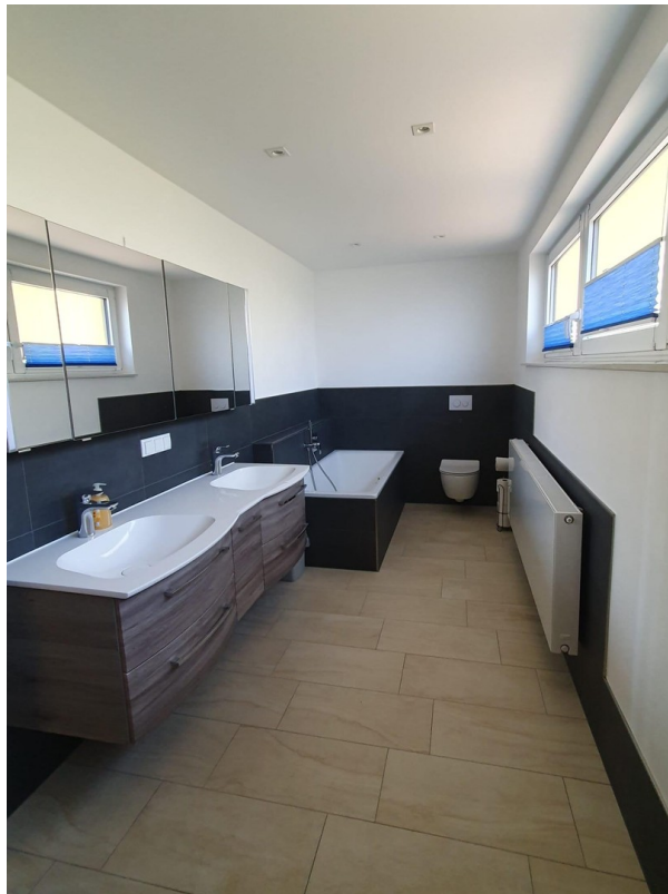
...Doppelwaschbecken und Wanne