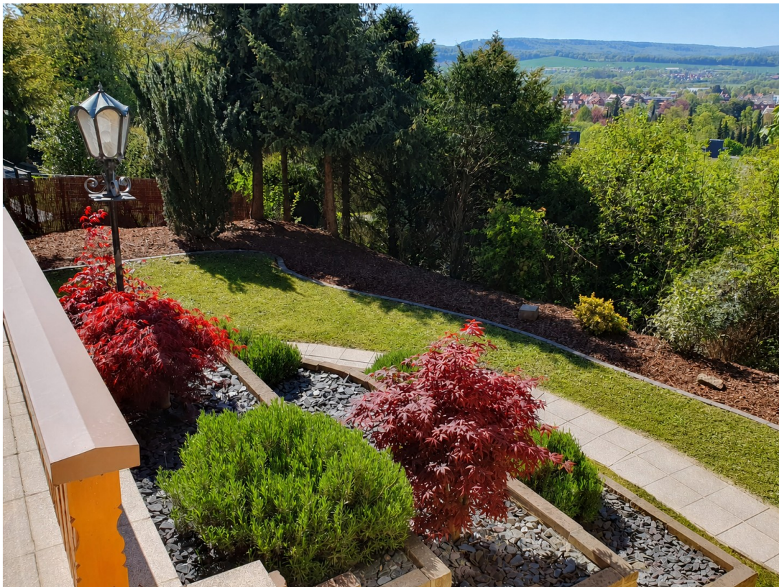
Hang-Garten mit Weitblick