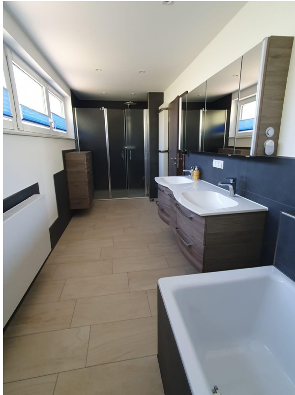
Vollbad mit großer Dusche