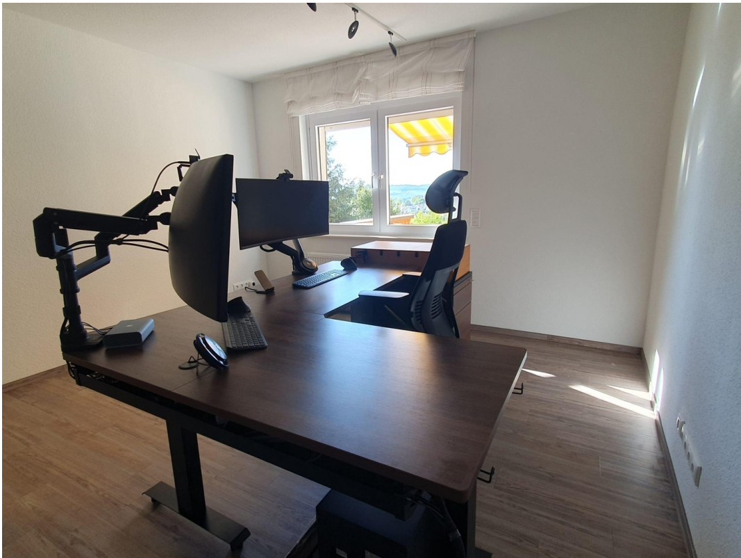
Ihr neues Büro mit Weitblick?