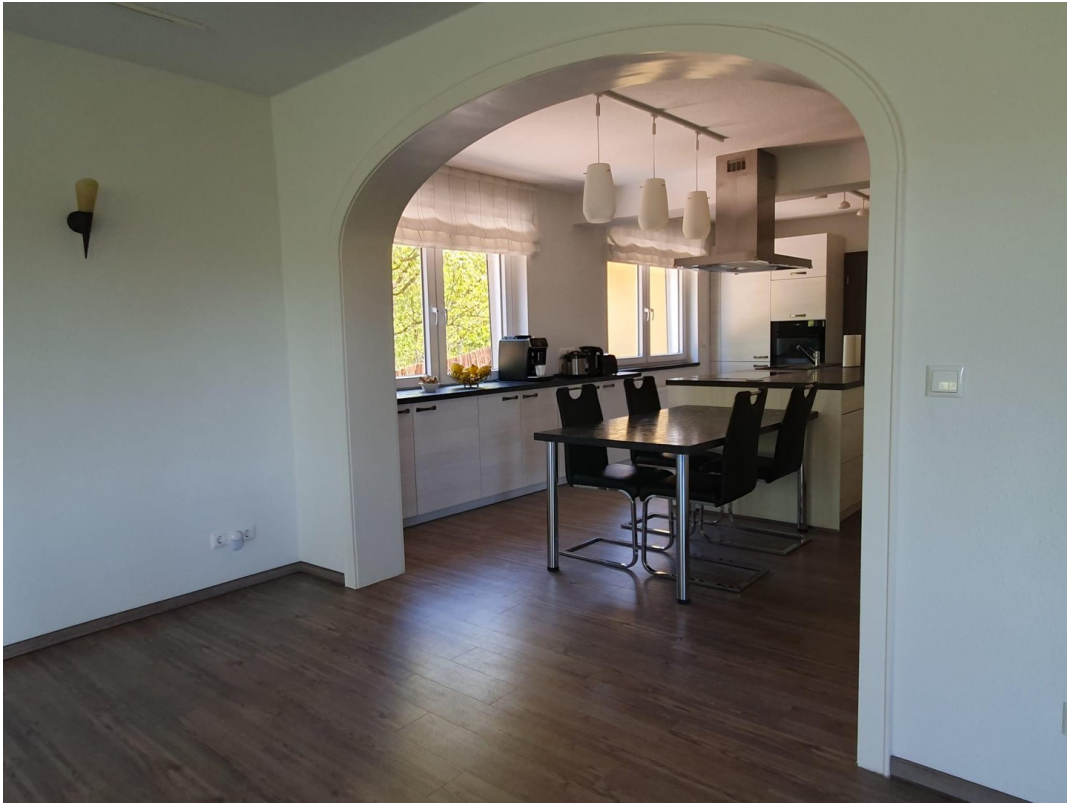
Koch- und Essbereich