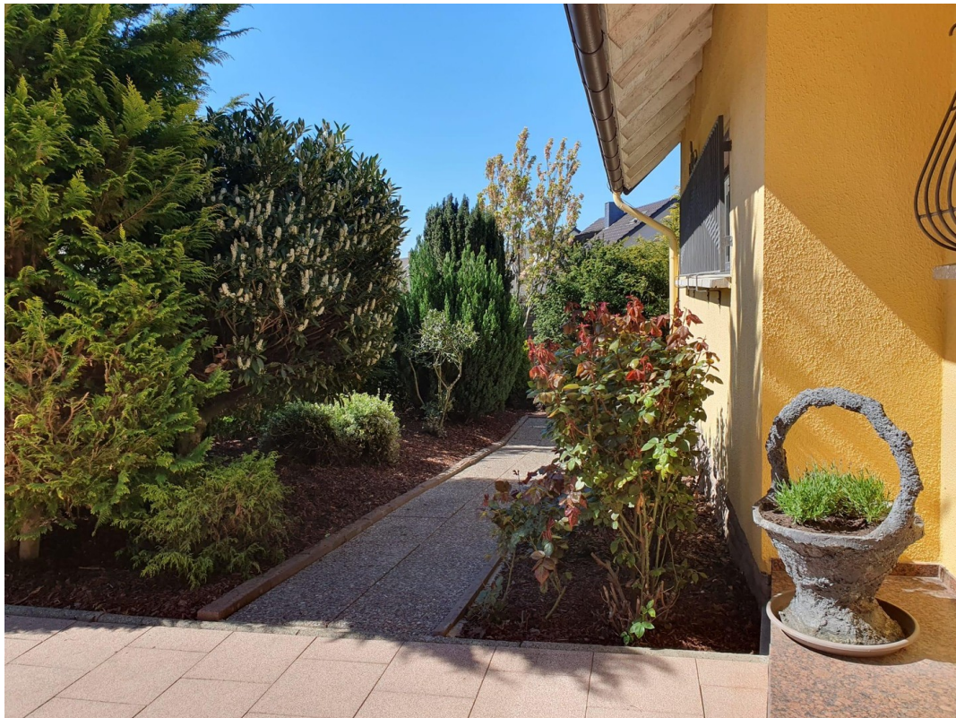
Weg in den Garten