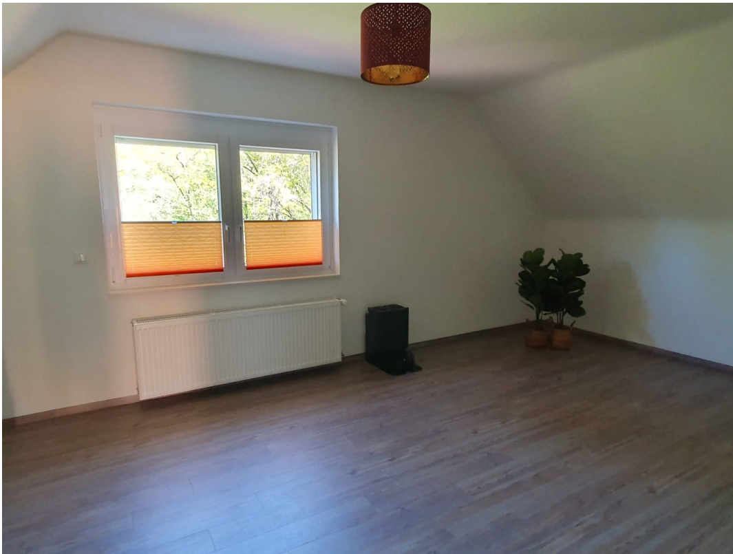
Weiteres Zimmer mit Waldblick