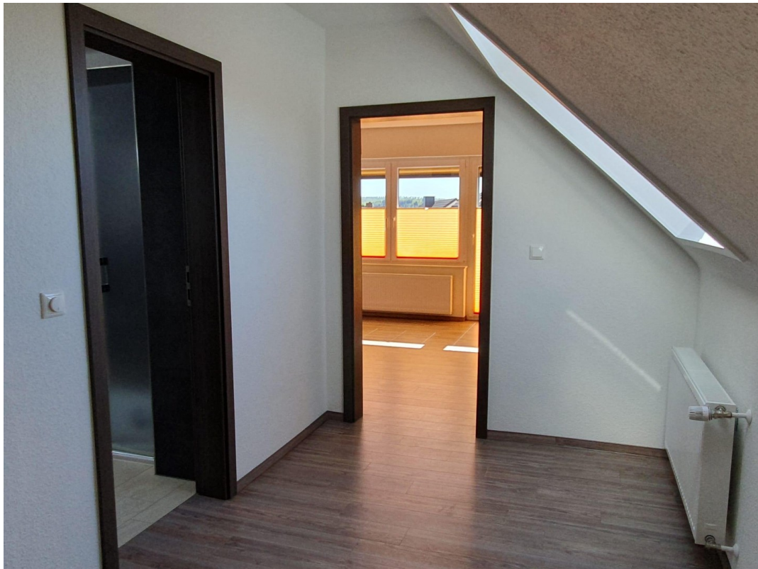
Willkommen im Obergeschoss