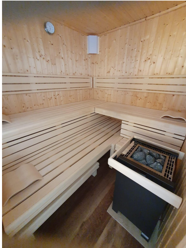
Sauna für frische Tage