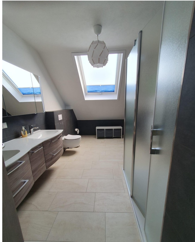
Zweites Bad mit großer Dusche