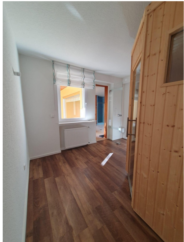
Tageslicht im Keller