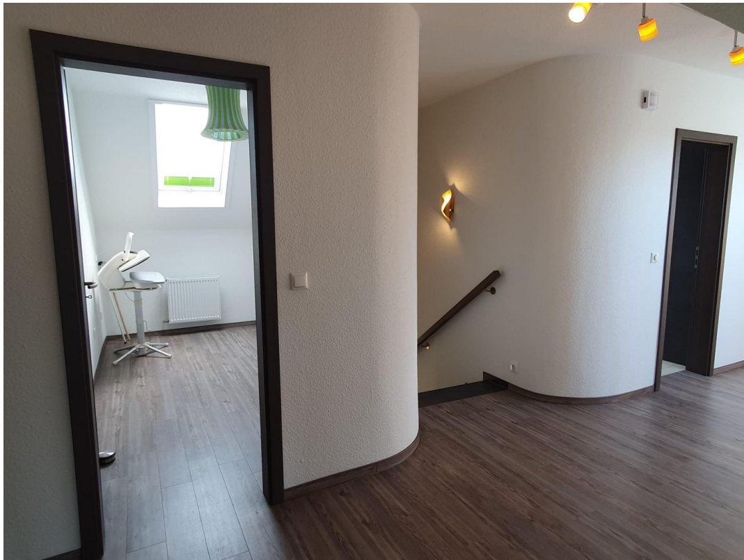
Flur und weiterer Abstellraum