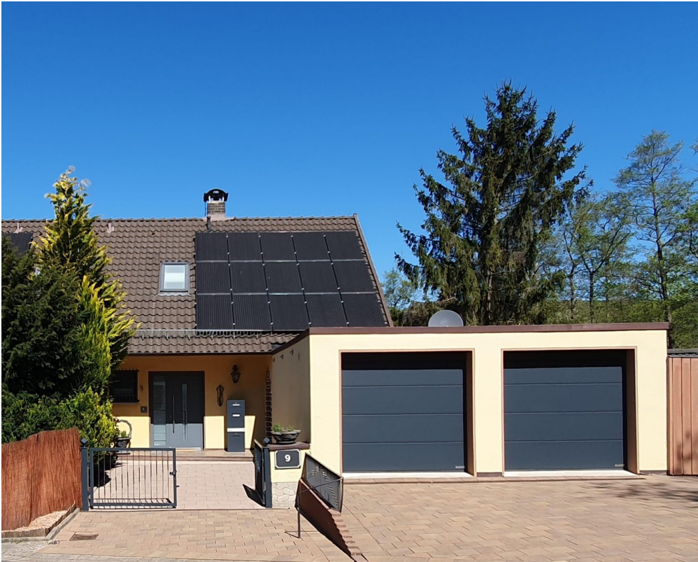
Doppelgarage und PV-Anlage