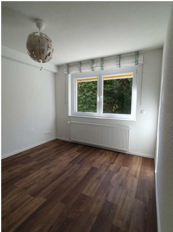
Teils ebenerdiger Keller