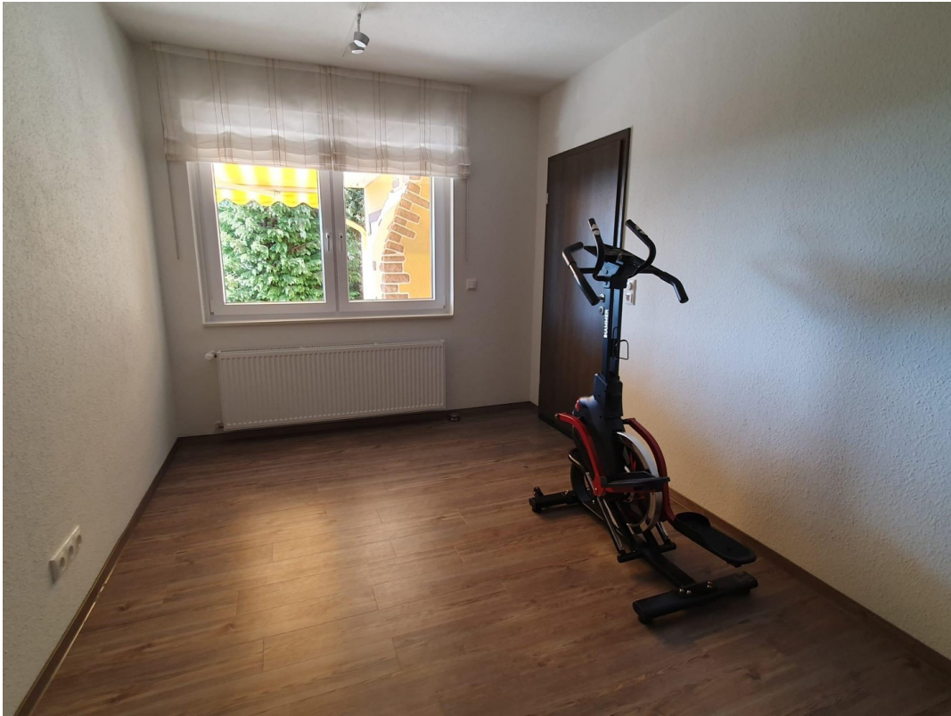
Ihr neuer Sportraum?