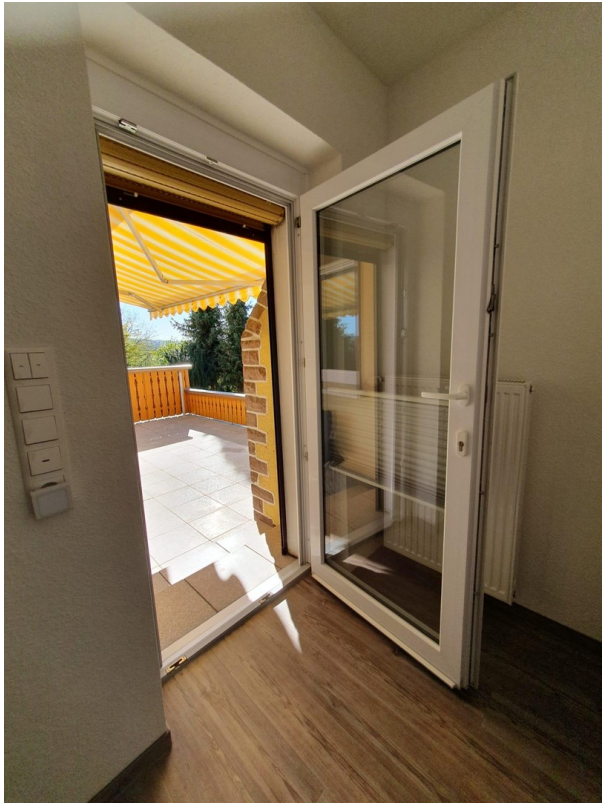
Ihr Weg in die Sonne