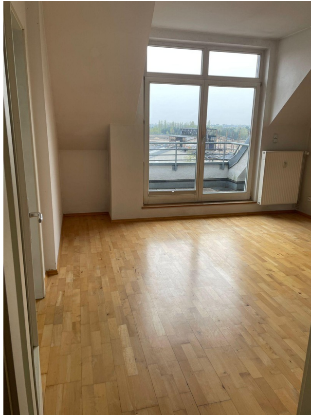
Zimmer 1 u. Terrasse