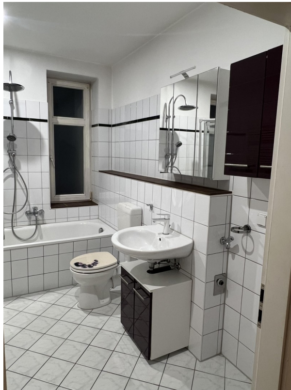
Badezimmer (aus anderer Whg.)