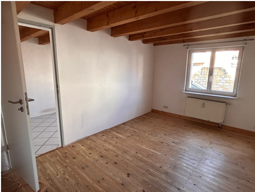
Zimmer_2 große Wohnung