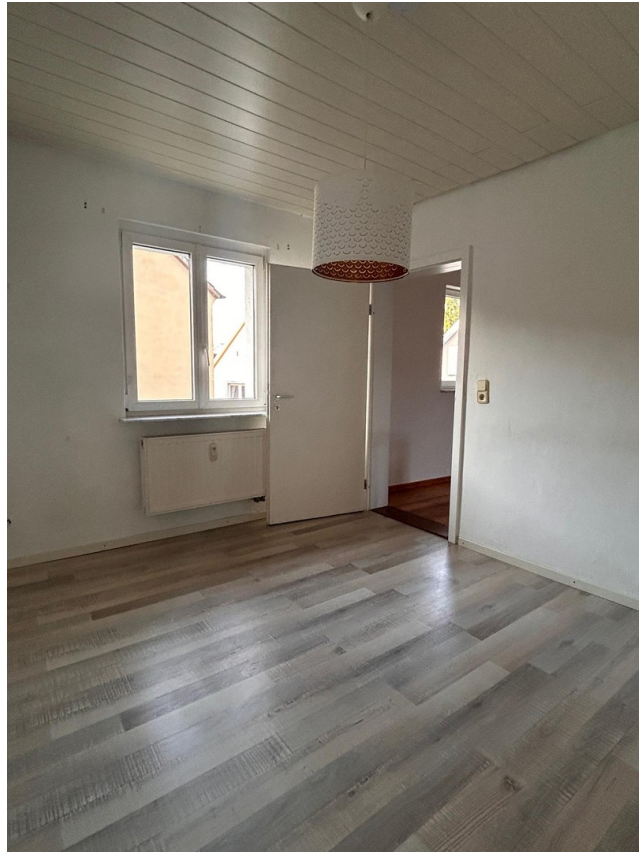
Zimmer_4 große Wohnung