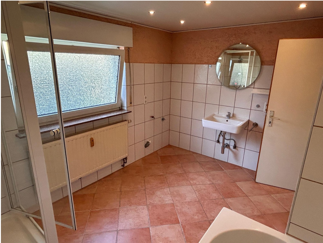
Bad große Wohnung