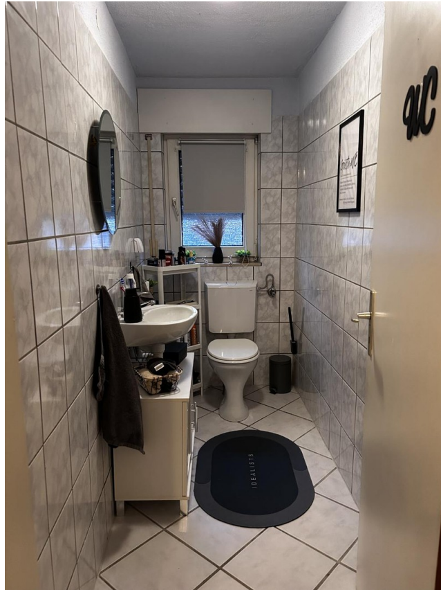
Gäste WC große Wohnung