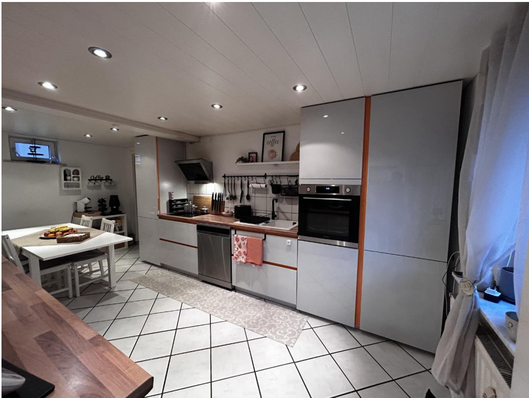
Küche große Wohnung