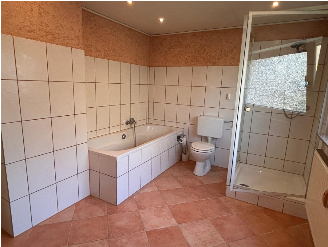
Bad große Wohnung_2