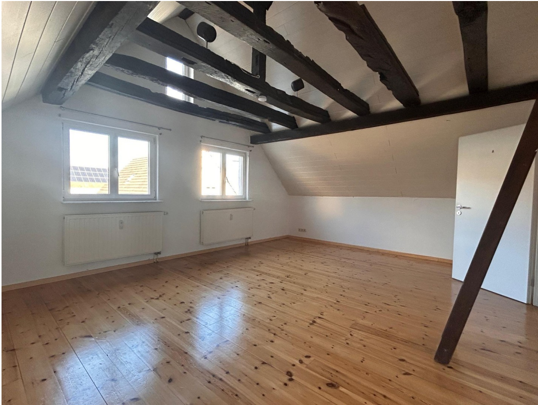
Zimmer_5 große Wohnung_leer