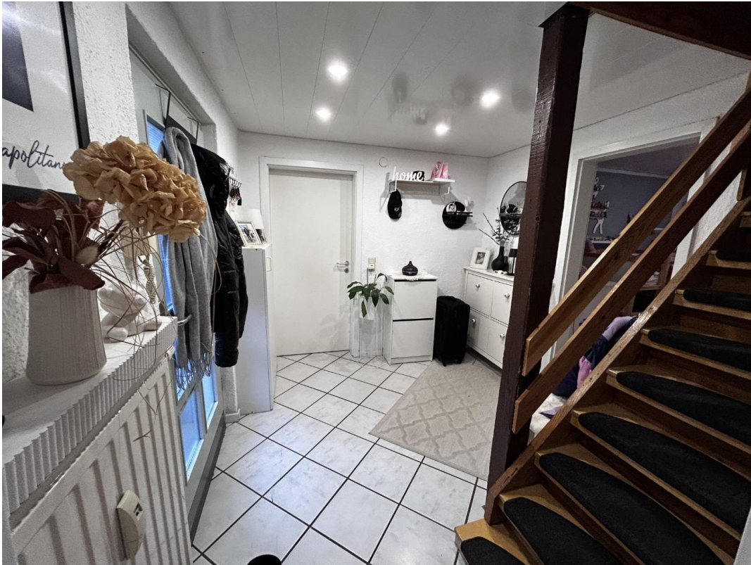
Flur EG große Wohnung