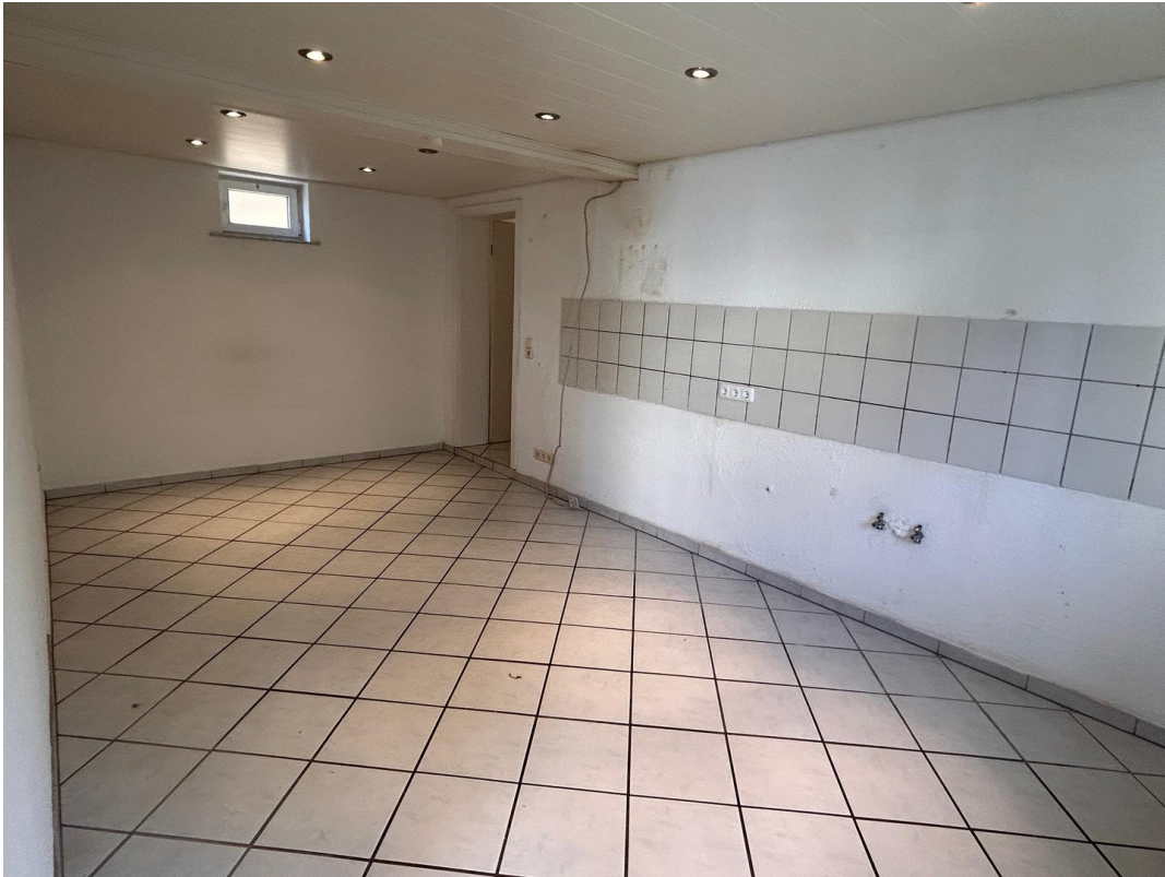
Küche große Wohnung_leer