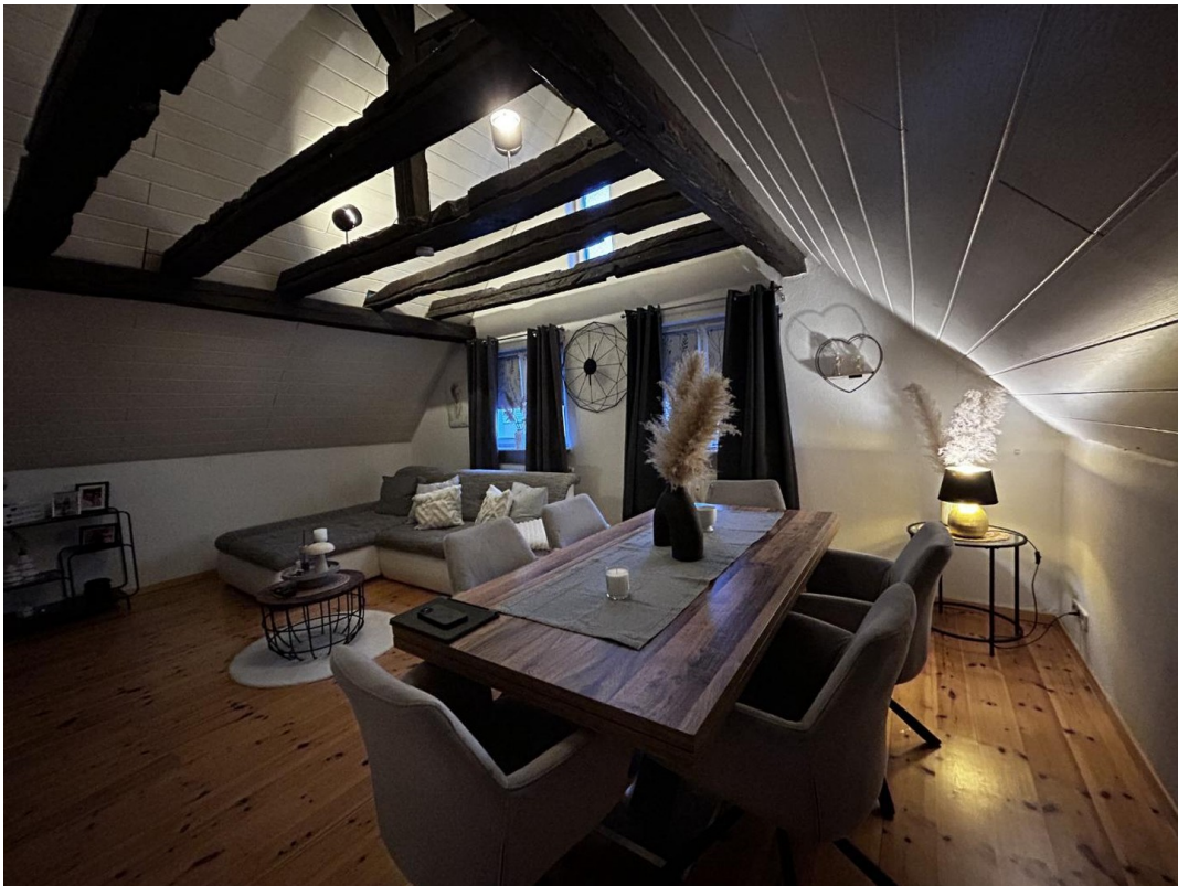
Zimmer_5 große Wohnung