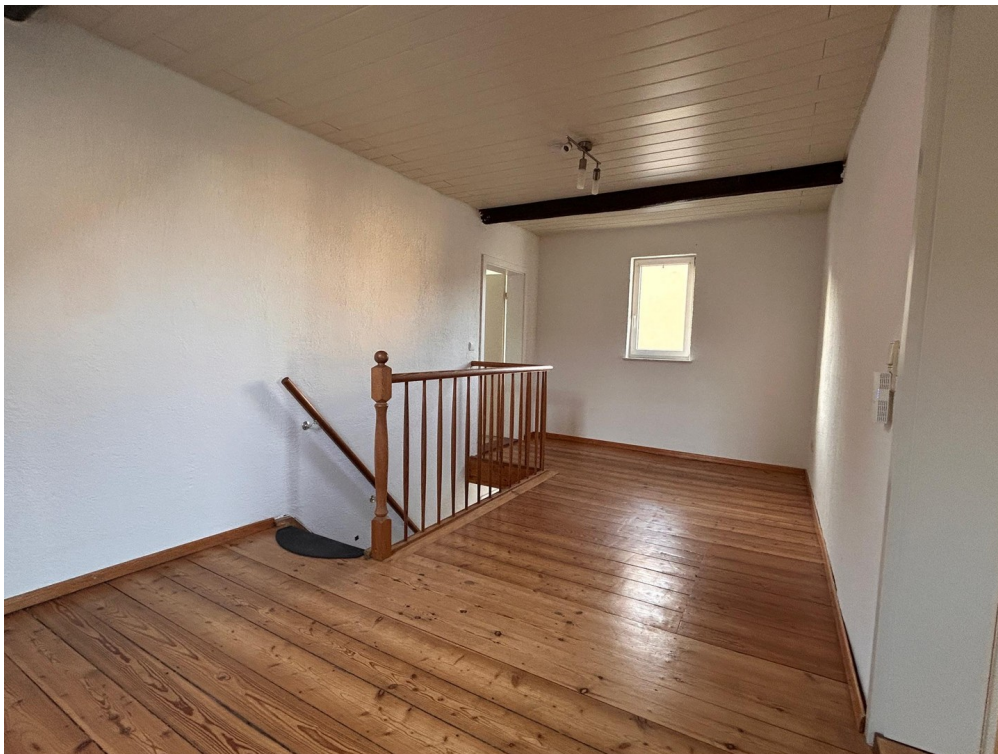
Flur OG große Wohnung 2