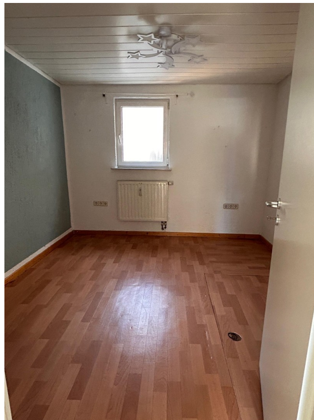
Zimmer_3 große Wohnung_leer