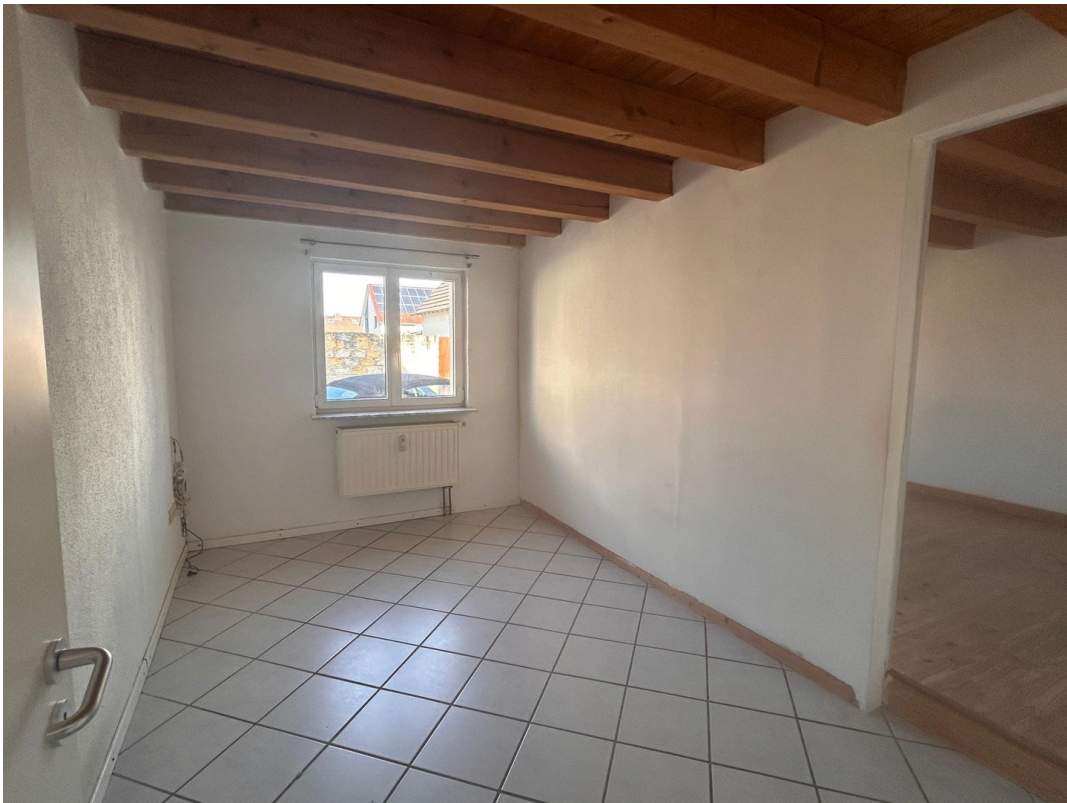
Zimmer_1 große Wohnung