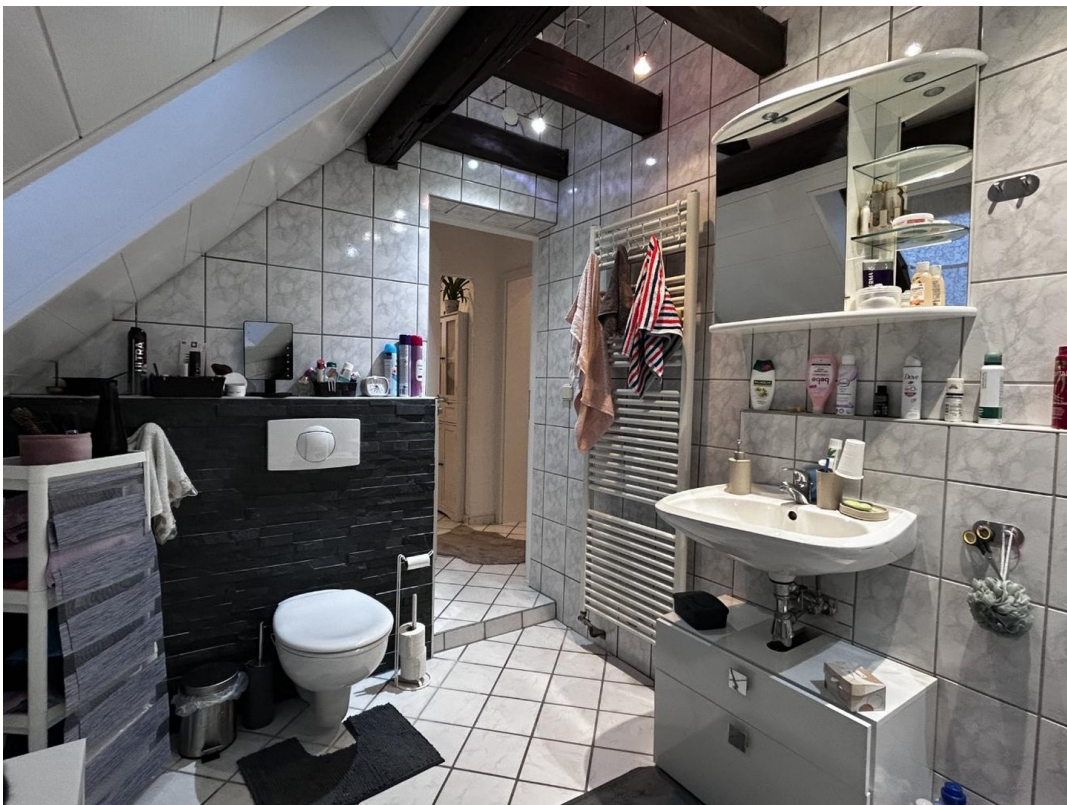
Bad ELW 2