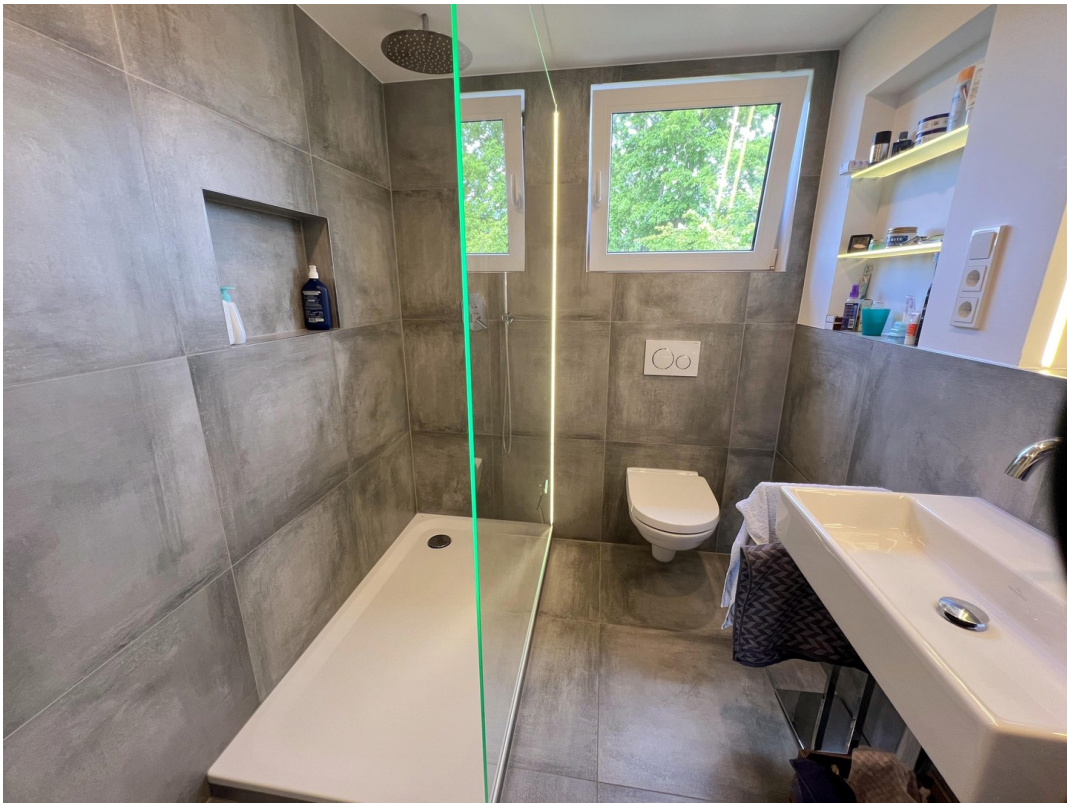
Bad mit XXL Dusche