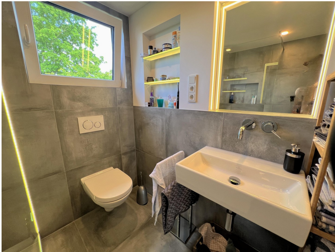
Bad mit Spiegelheizung