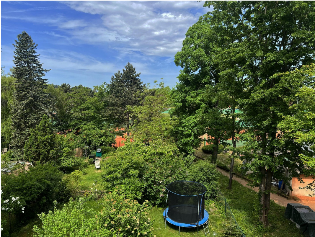
Aussicht vom Schlafzimmer