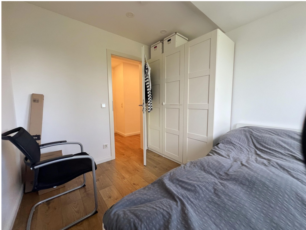
Arbeits- oder Kinderzimmer