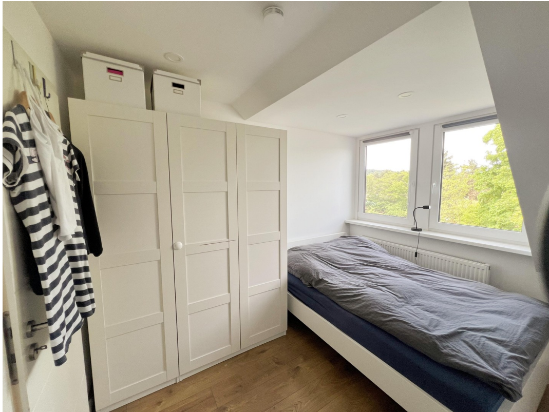
Arbeits- oder Kinderzimmer