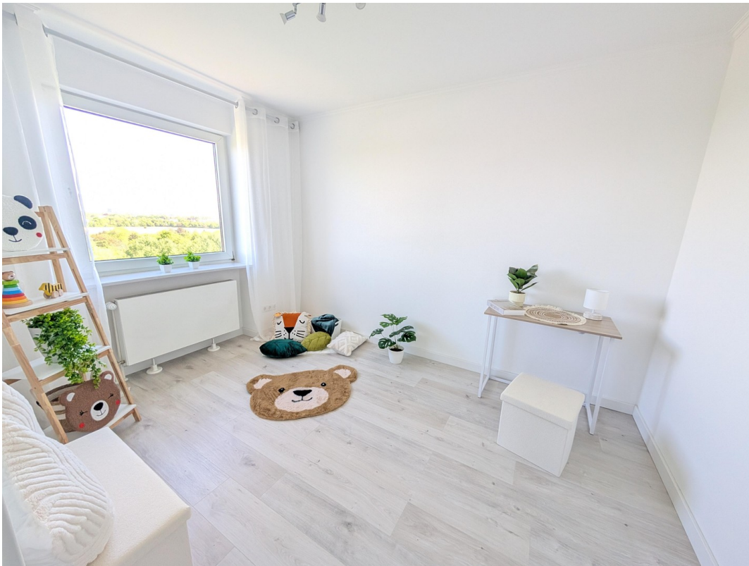
Kinderzimmer / Arbeitszimmer