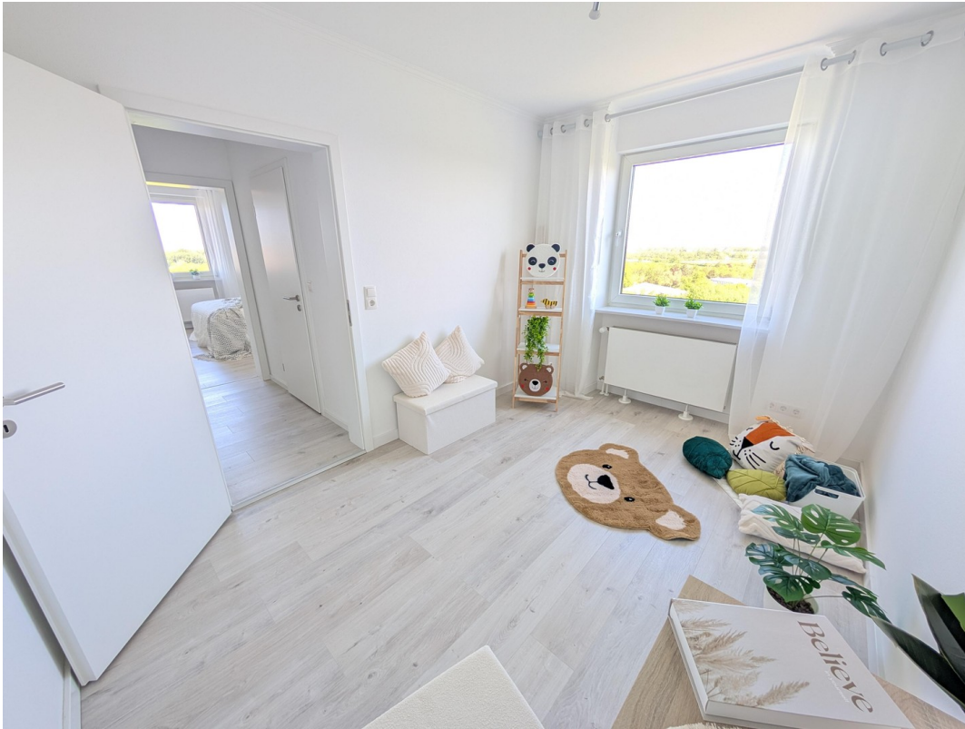
Kinderzimmer / Arbeitszimmer