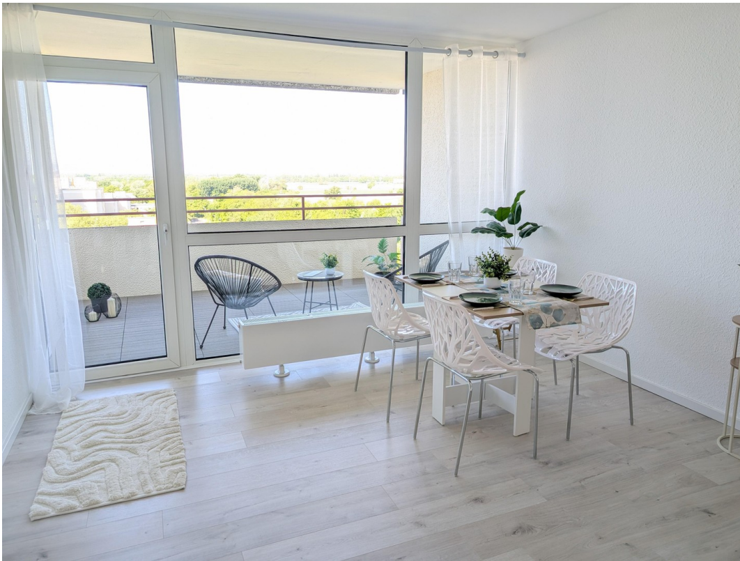
Essbereich mit Ausblick