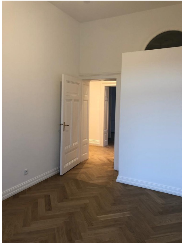
Blick auf Flur