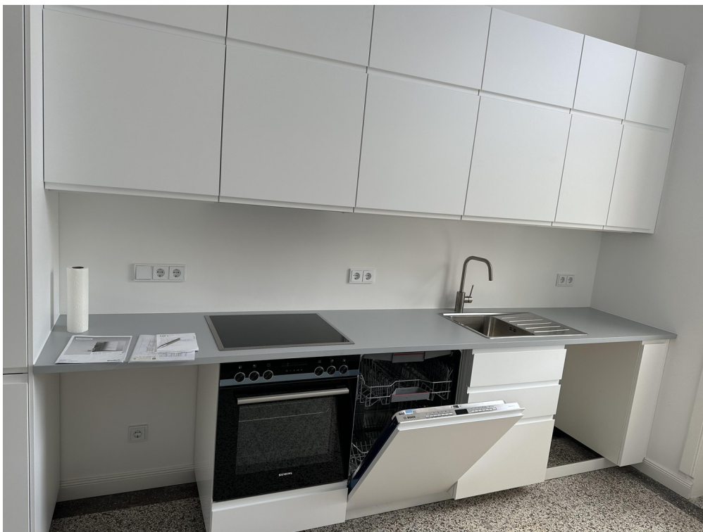
Küche ist eingebaut