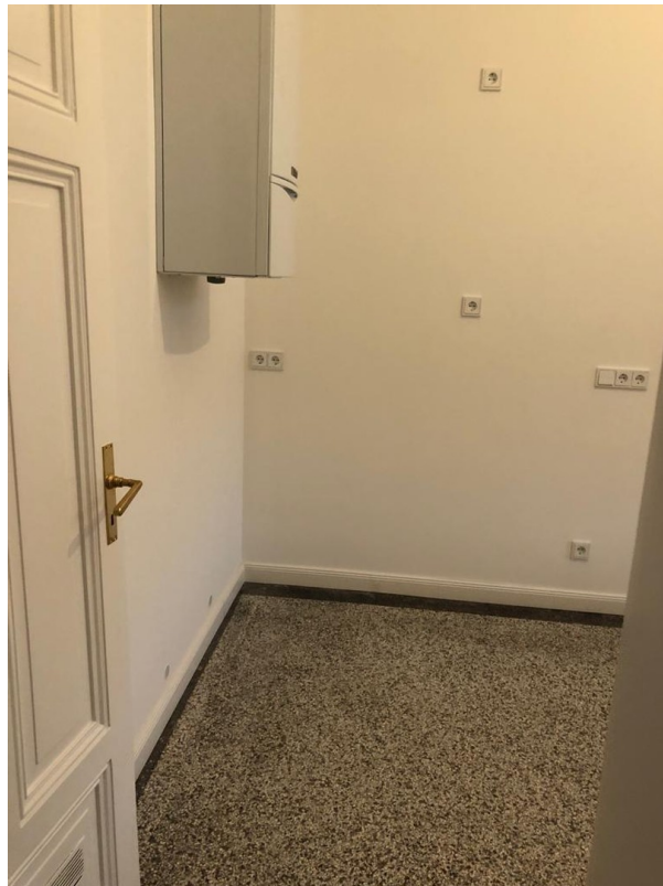
Blick in Küche