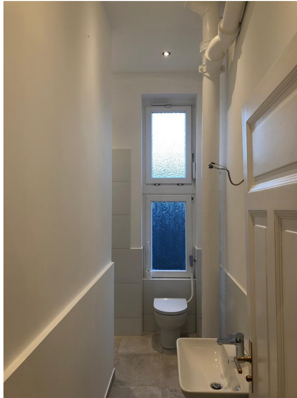
Blick in Toilette