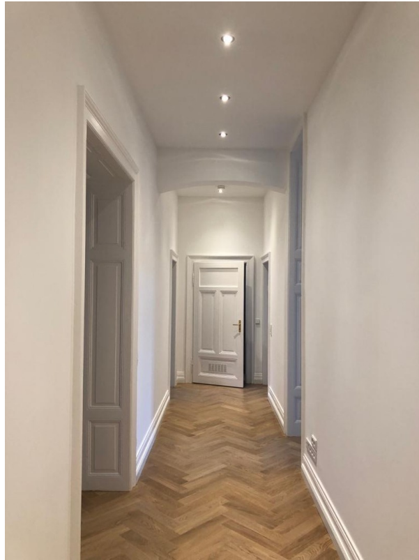
Flur mit Blick auf Toilette