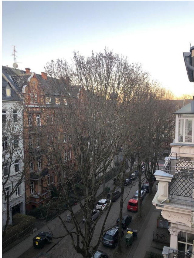
Blick vom großen Balkon