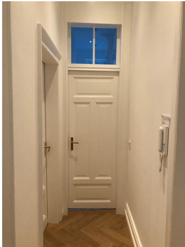
Blick auf Wohnungstüre