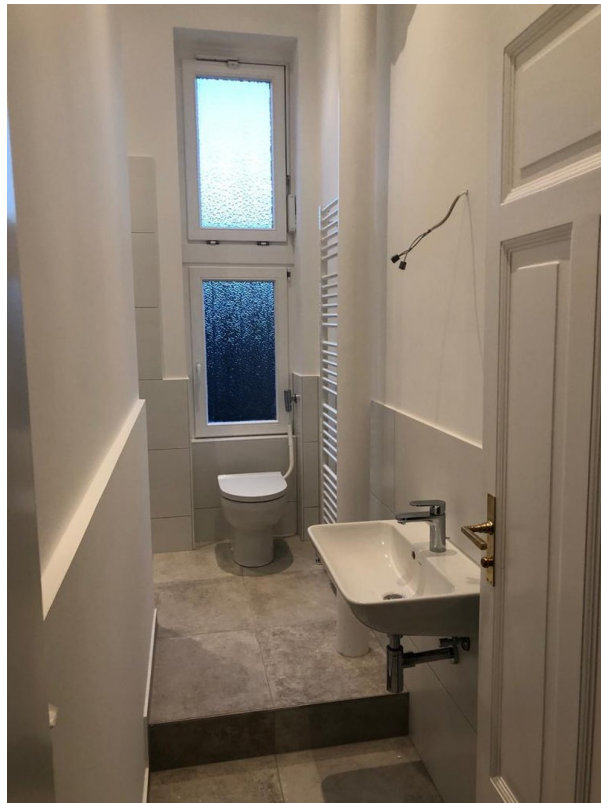
Toilette mit Dusche