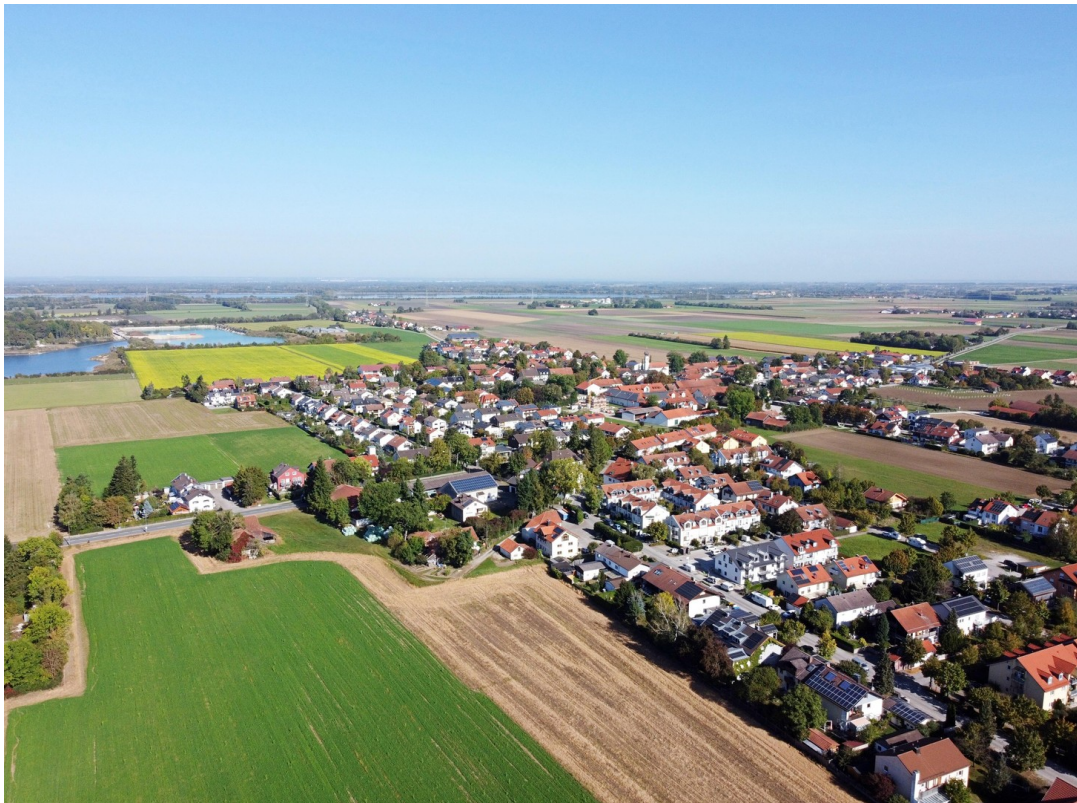
Landsham von oben