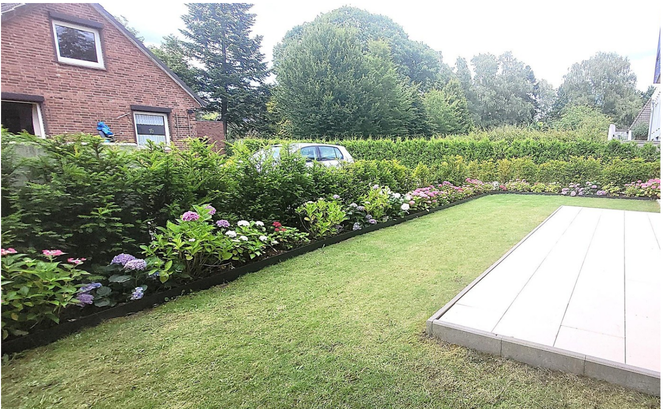
Gartenanteil + Terrasse