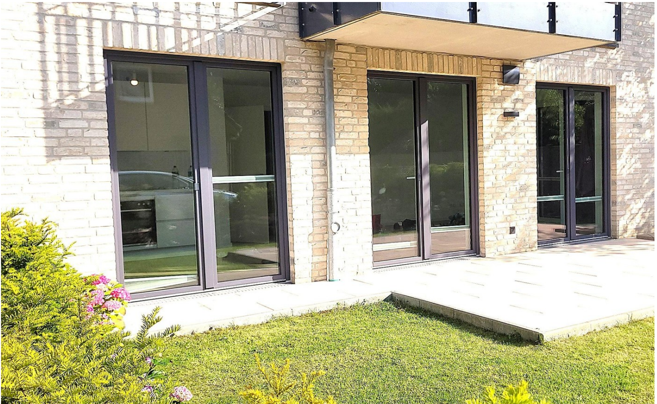
Gartenanteil + Terrasse