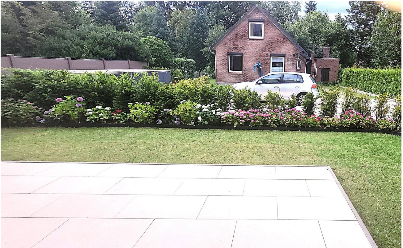
Gartenanteil + Terrasse