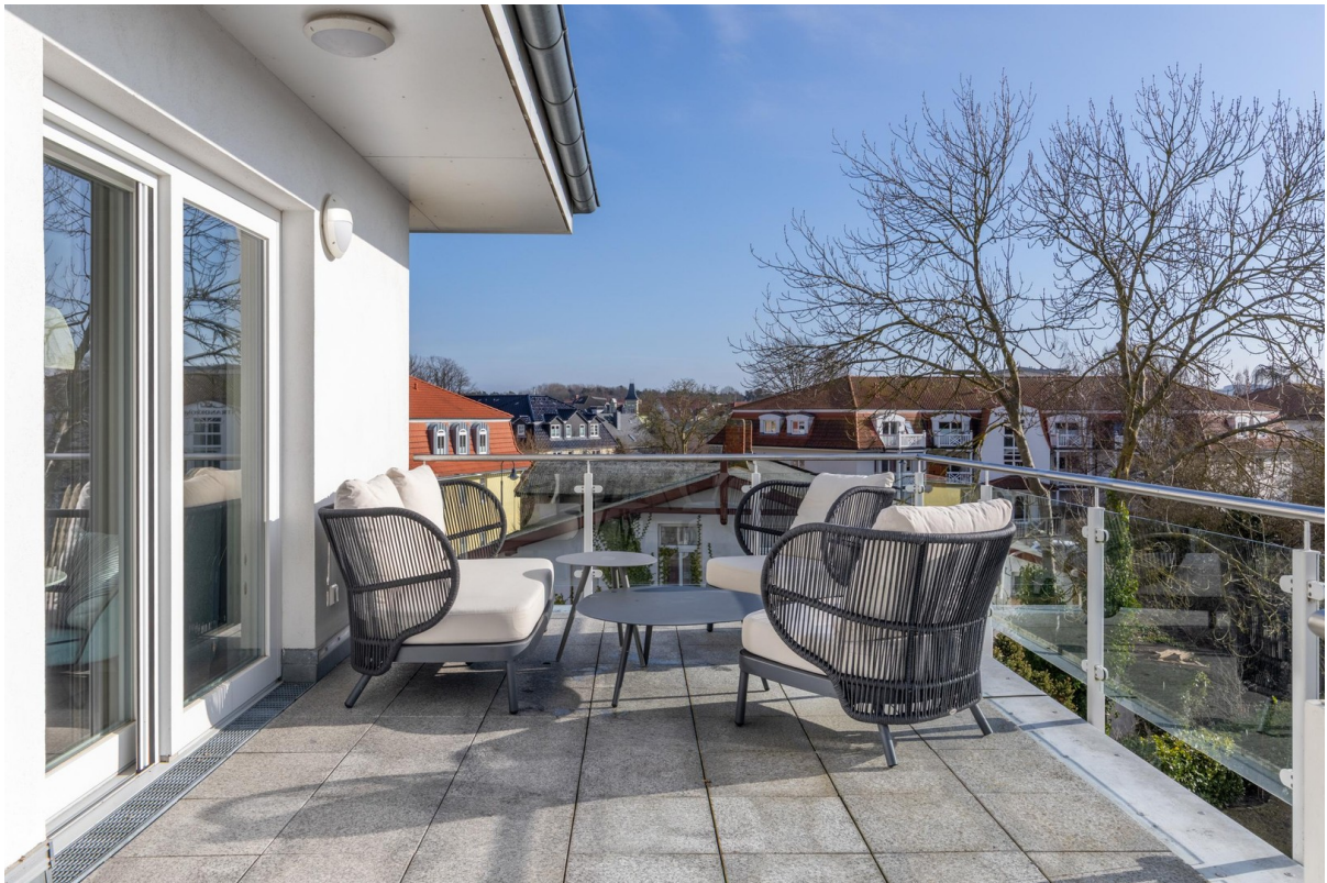
12b großer Süd-Balkon