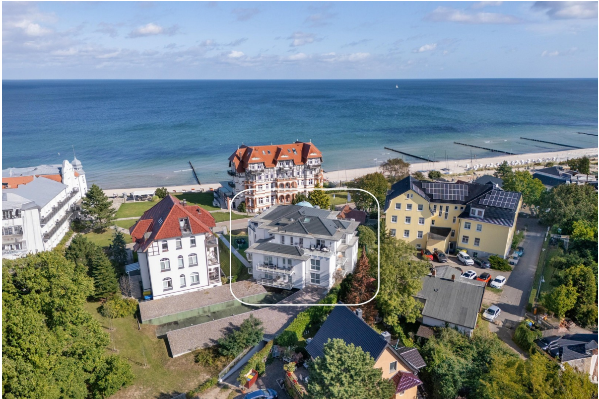
Villa Siegfried aus Süd