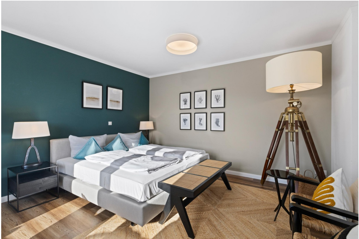
12b Schlafen und Wohnen