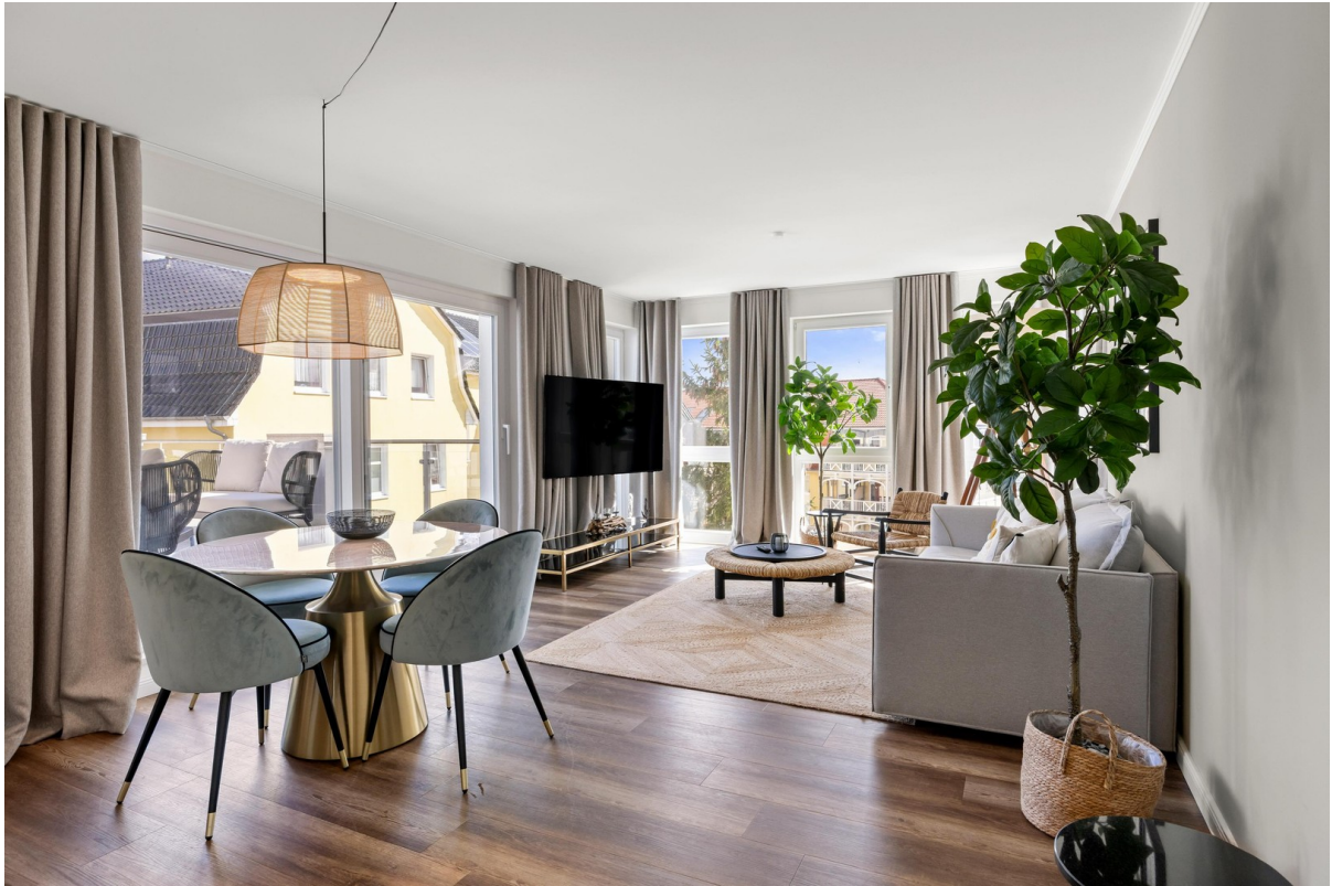
12a Wohnen und Essen