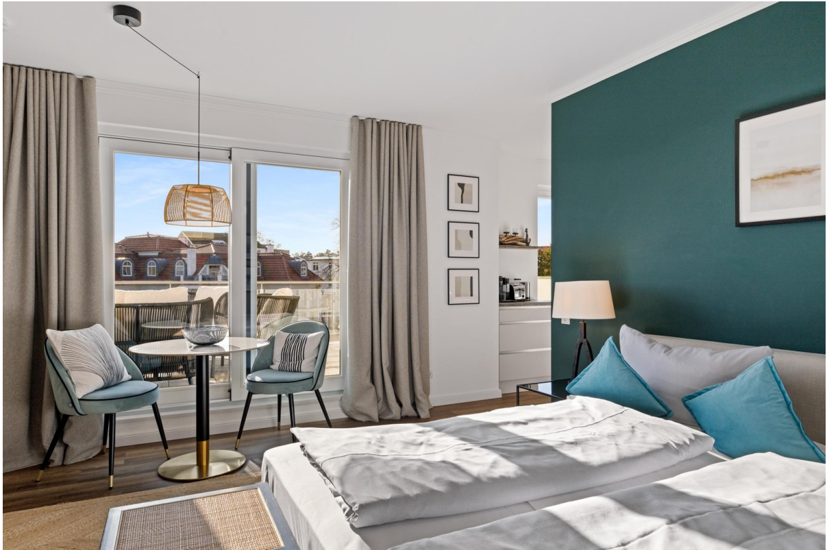
12b Essen und Schlafen