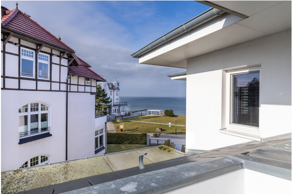
12b Balkon mit Ostseeblick