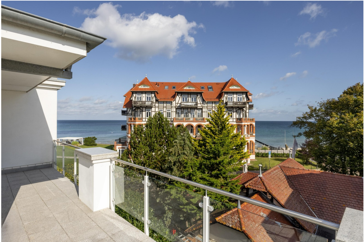
12a Terrasse mit Ostseeblick