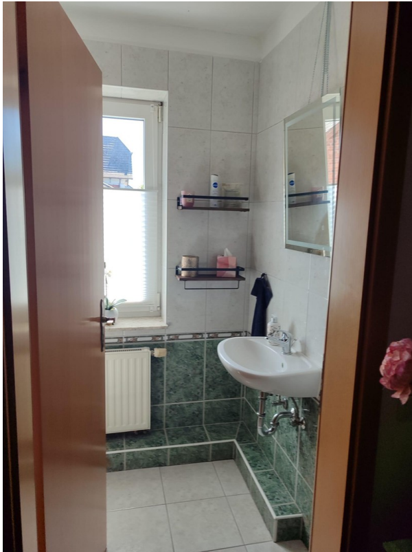
Gäste WC OG