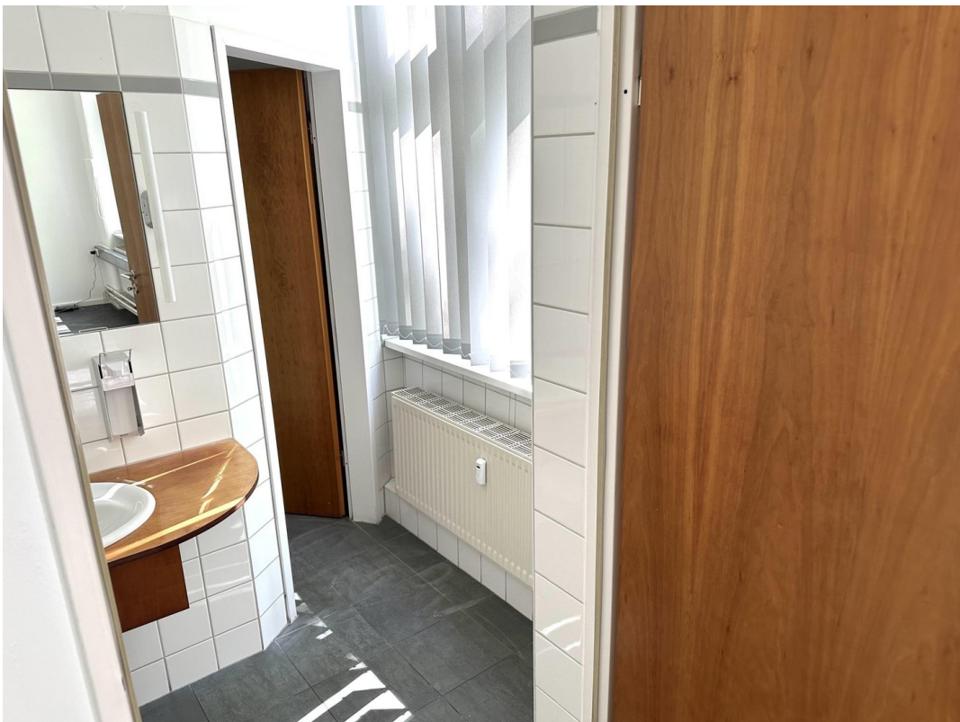
Blick in die Toilette