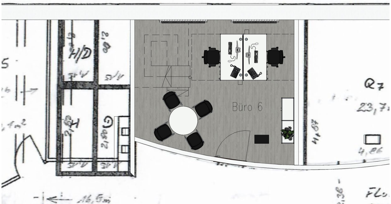
Skizze des Büros