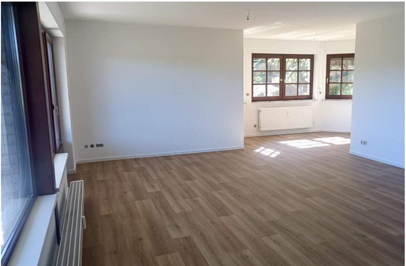
Wohn-/Esszimmer & offene Küche