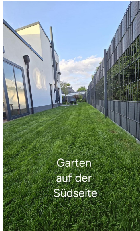
Garten auf der Südseite