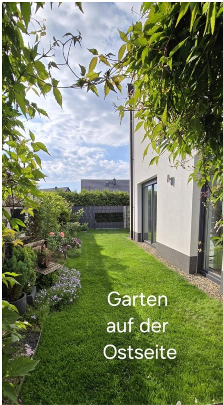
Garten auf der Ostseite