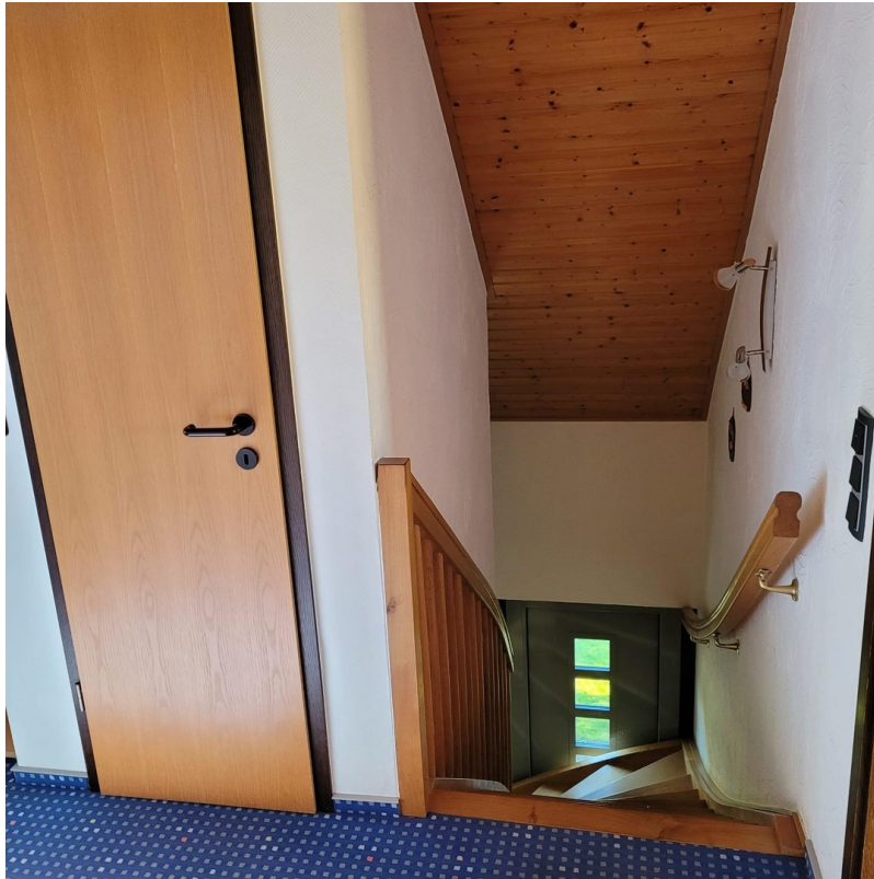
Treppenaufgang 1. OG