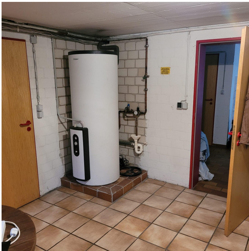
300 l Brauchwasserspeicher