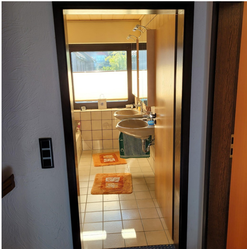
Blick ins Bad