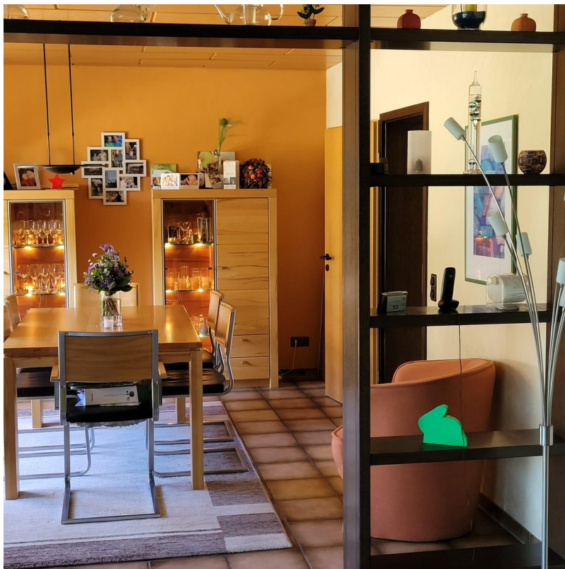
Essbereich - Tür zur Küche