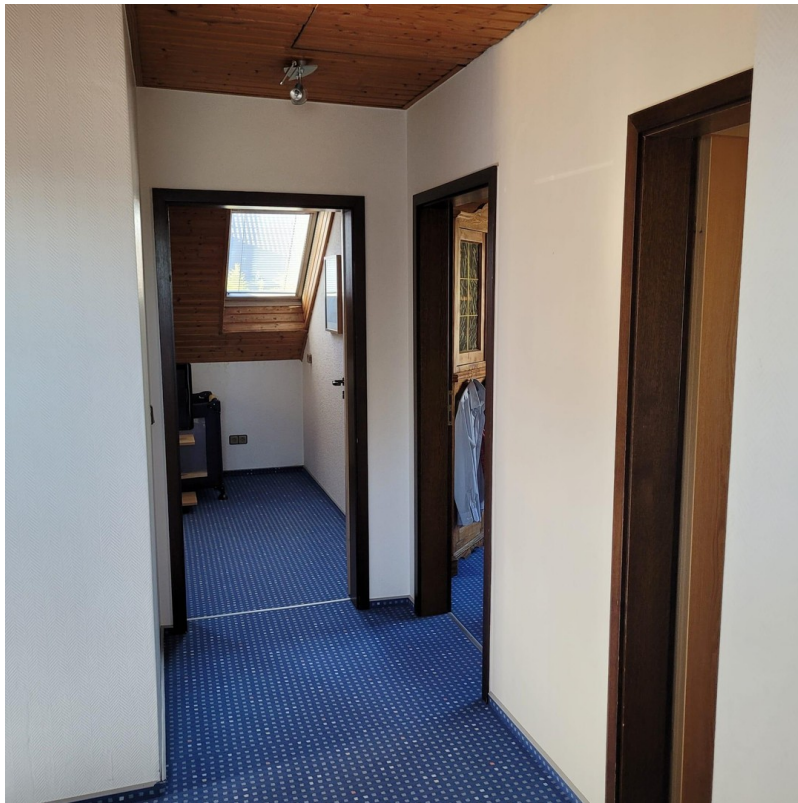
Flur 1. OG