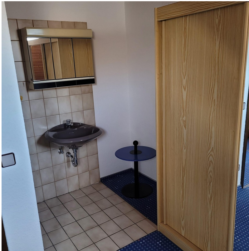
Schlafzimmer 4 mit Waschbecken