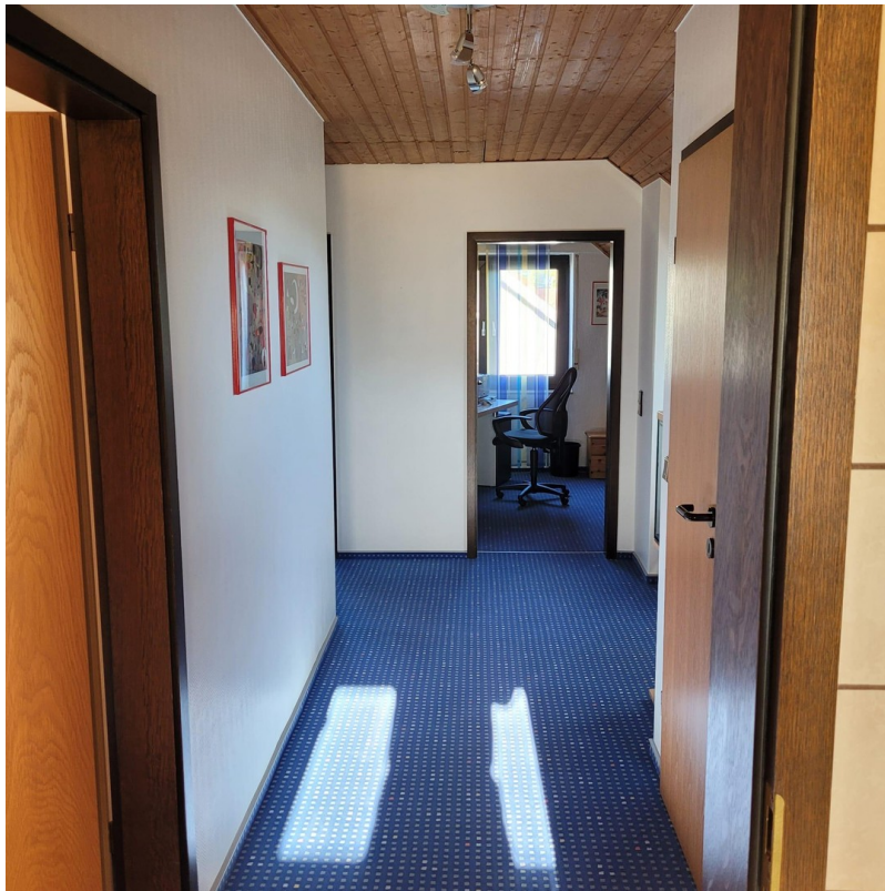
Flur 1. OG