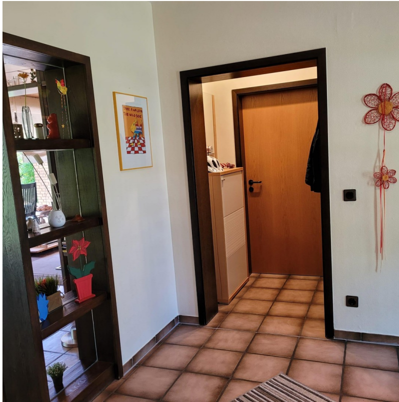
Garderobe - Tür zur Küche