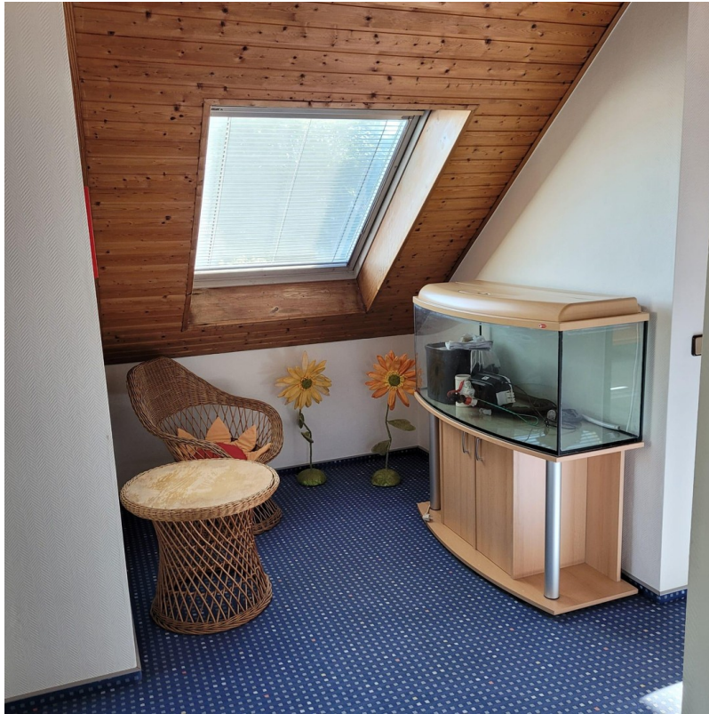
Sitzecke Flur 1. OG