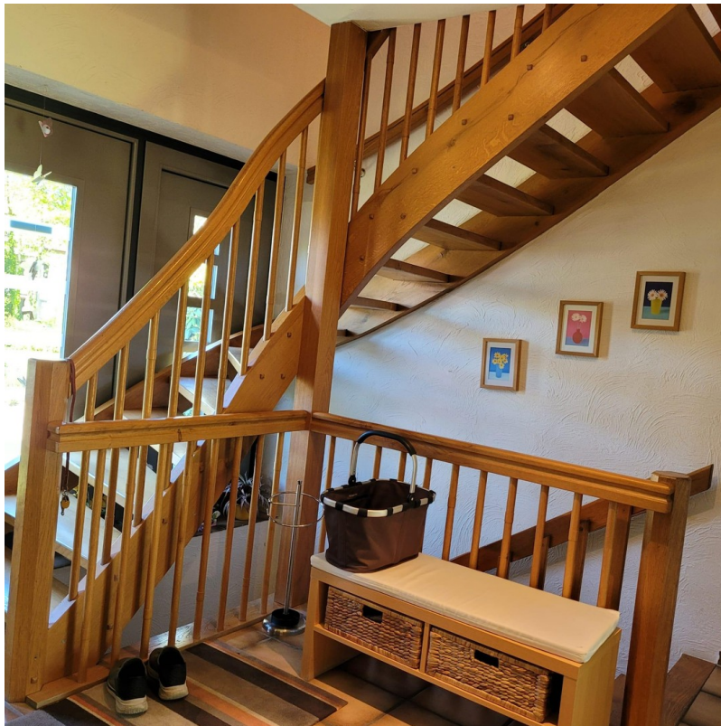
Treppe zum 1. OG und Keller