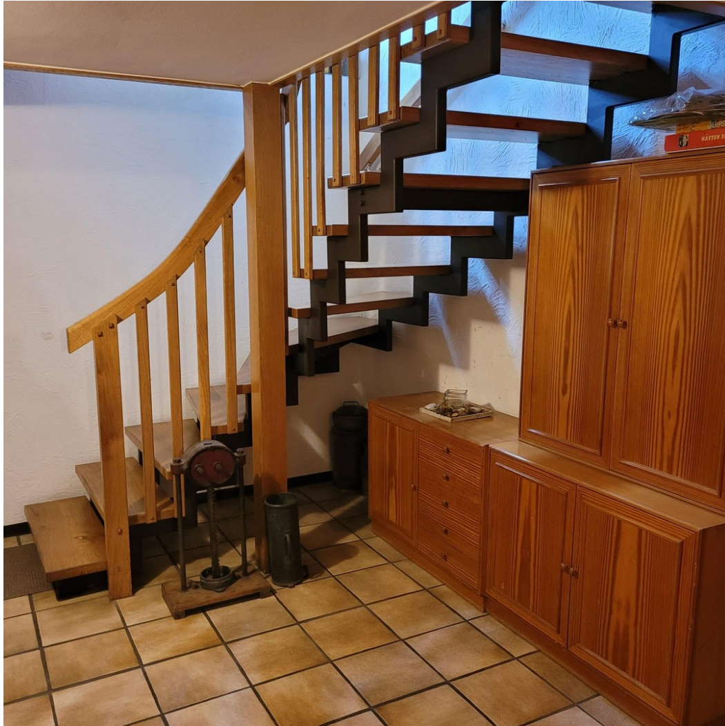
Flur im Keller