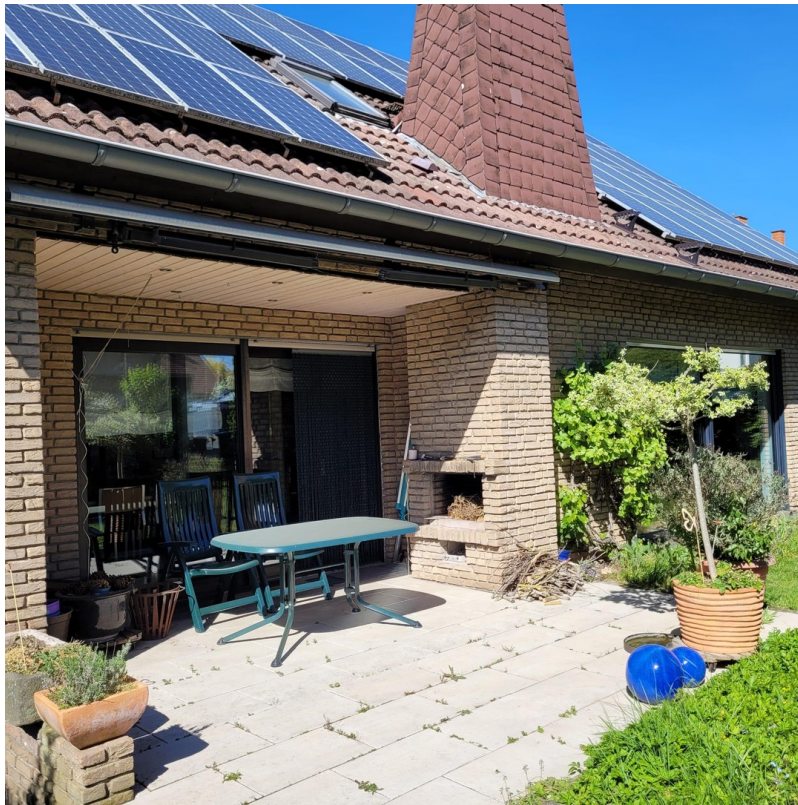
Terrasse mit Kamin