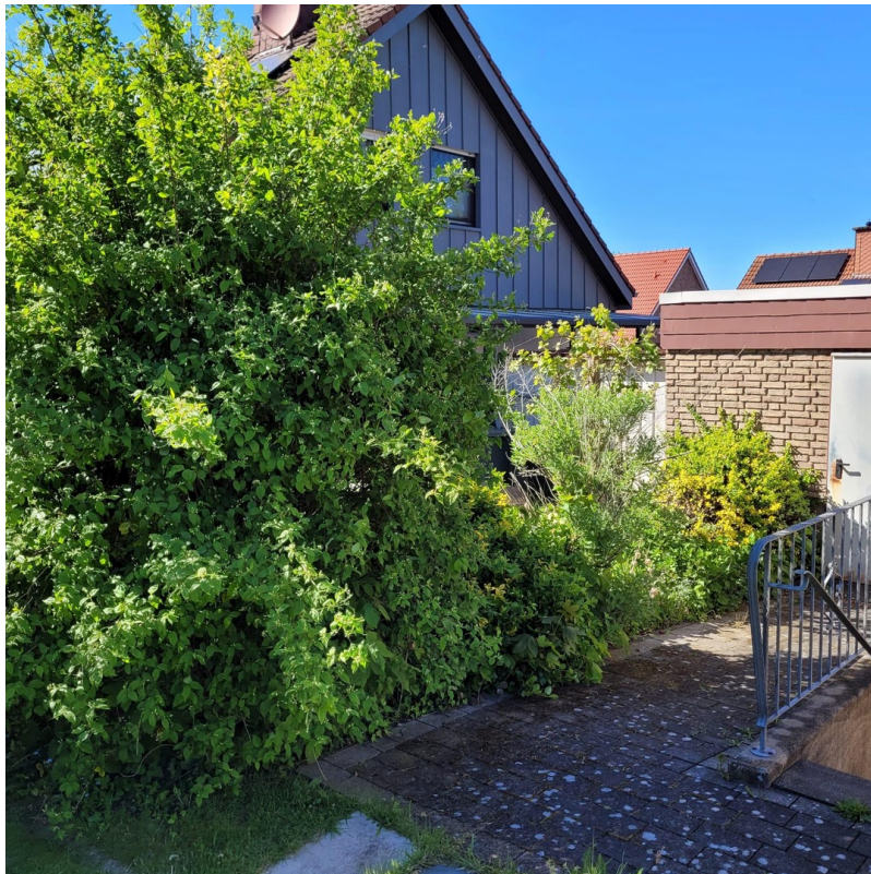
Weg zur Garage und Kellerabgan