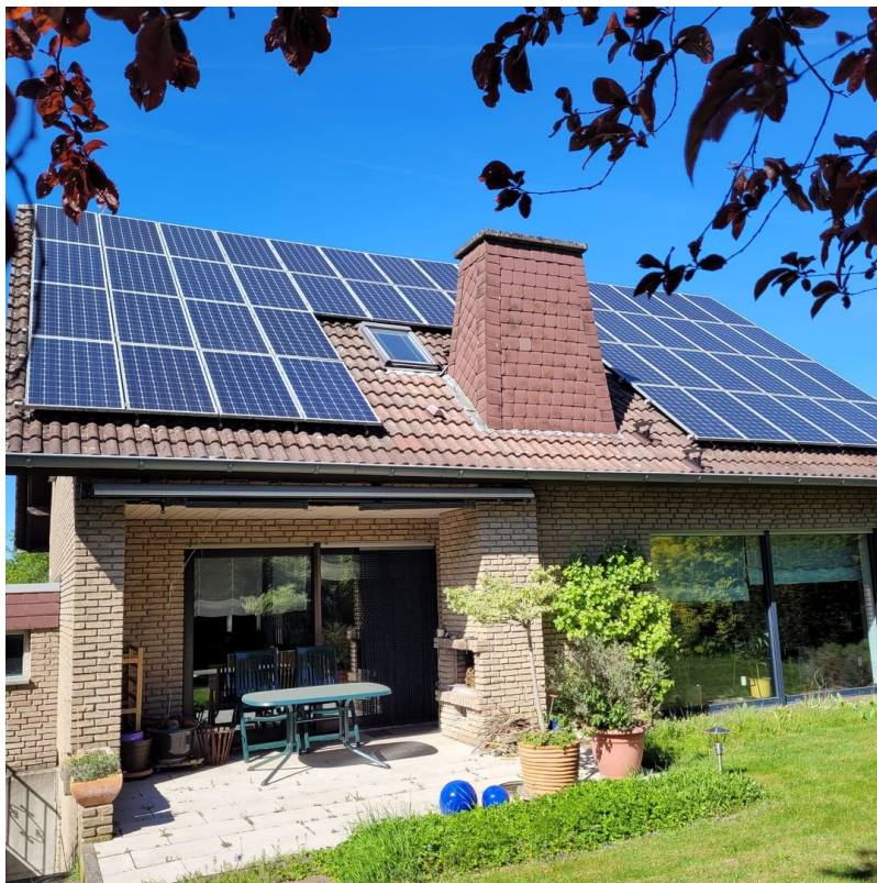
Terrasse mit Kamin