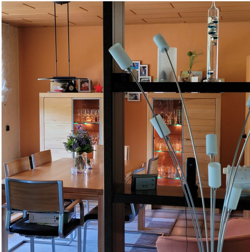
Essbereich mit Raumteiler