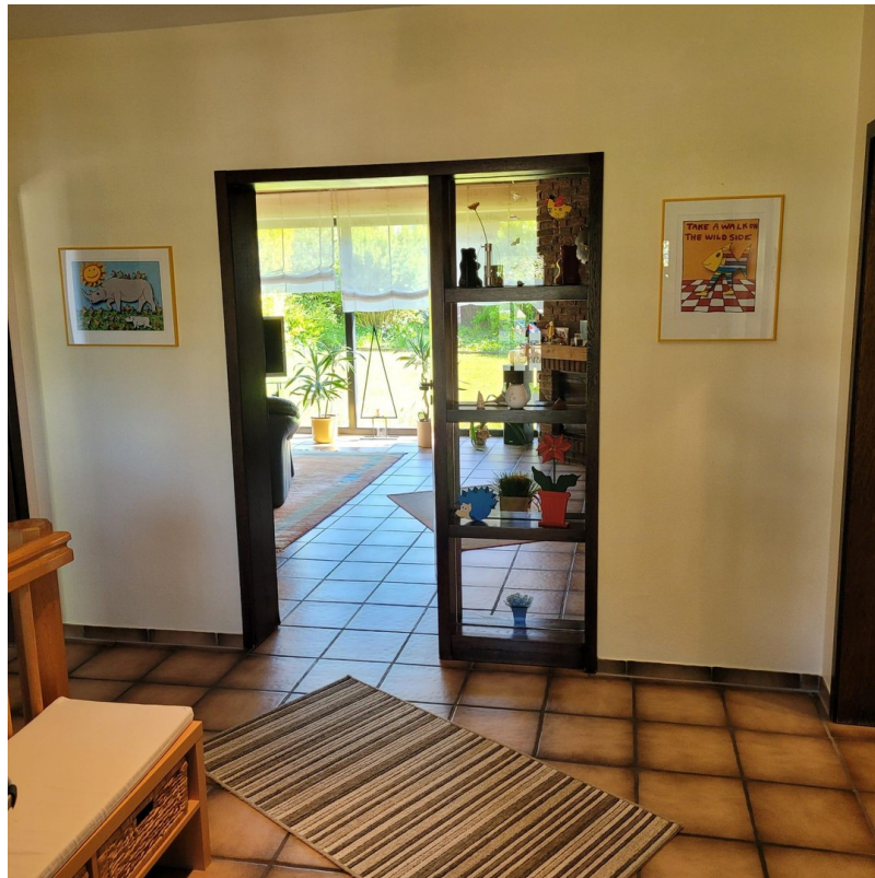
Flur Blick ins Wohnzimmer