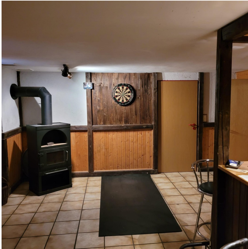
Partykeller mit Kamin