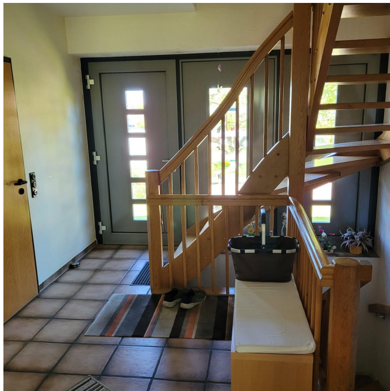
Flur - links Gäste-WC