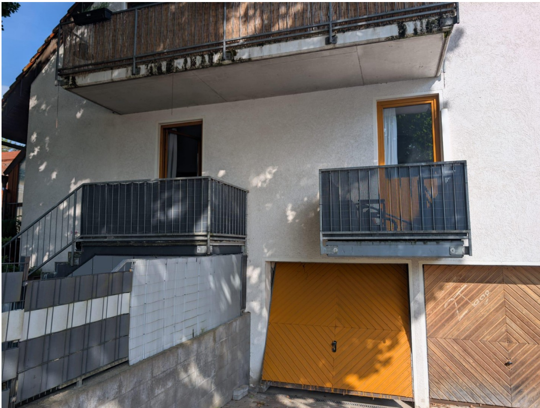
Terrasse, Balkon, Garagenzufahr