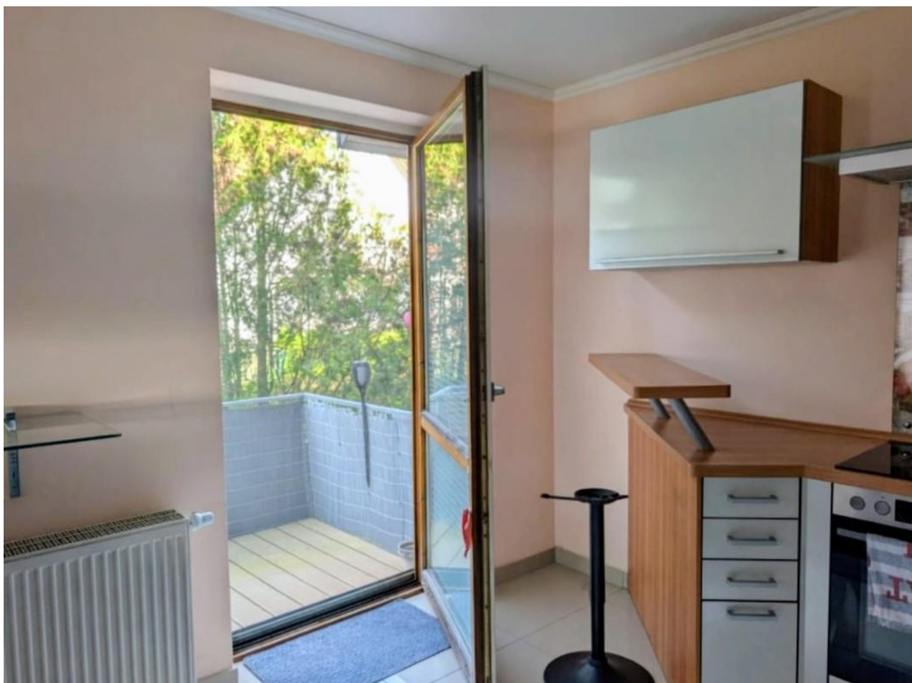
Küchenzugang zum Südbalkon