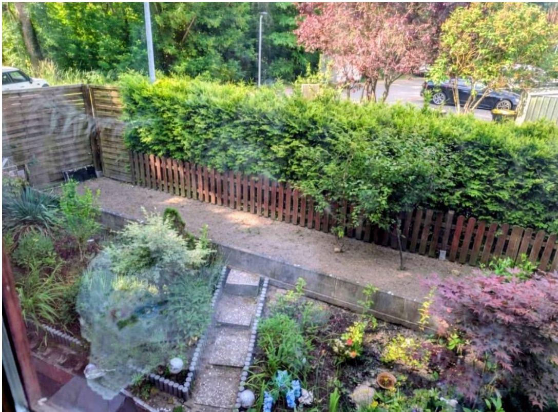
Blick auf den Mietergarten