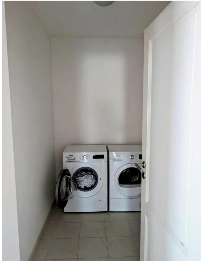
Geräte und - Abstellraum