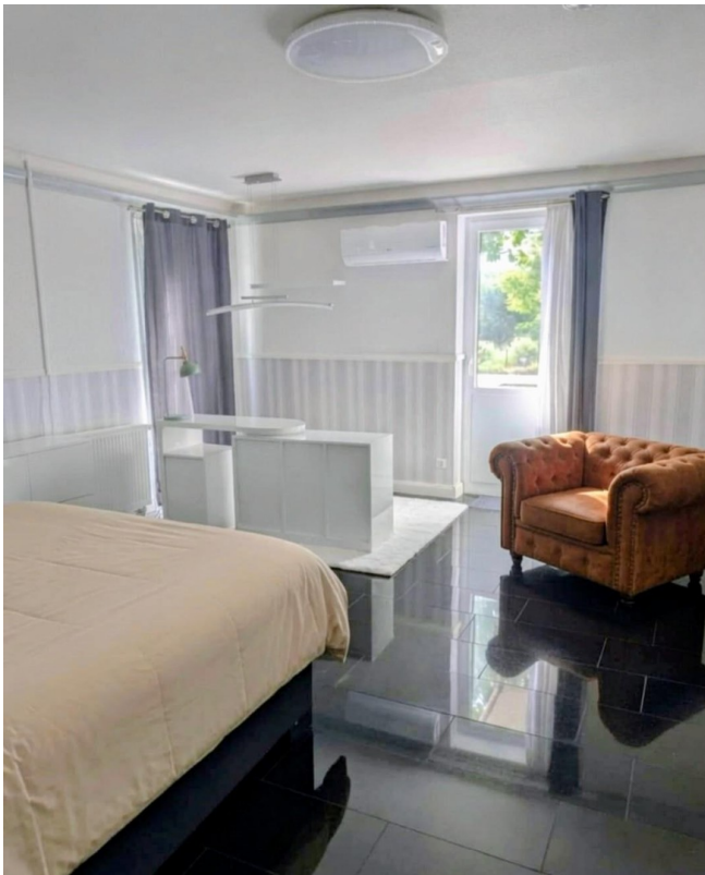
Schlafzimmer m. Balkonblick