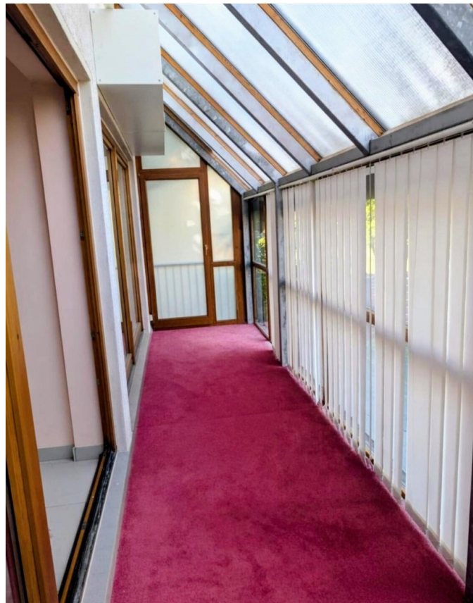
Großer Wintergarten nach Süden