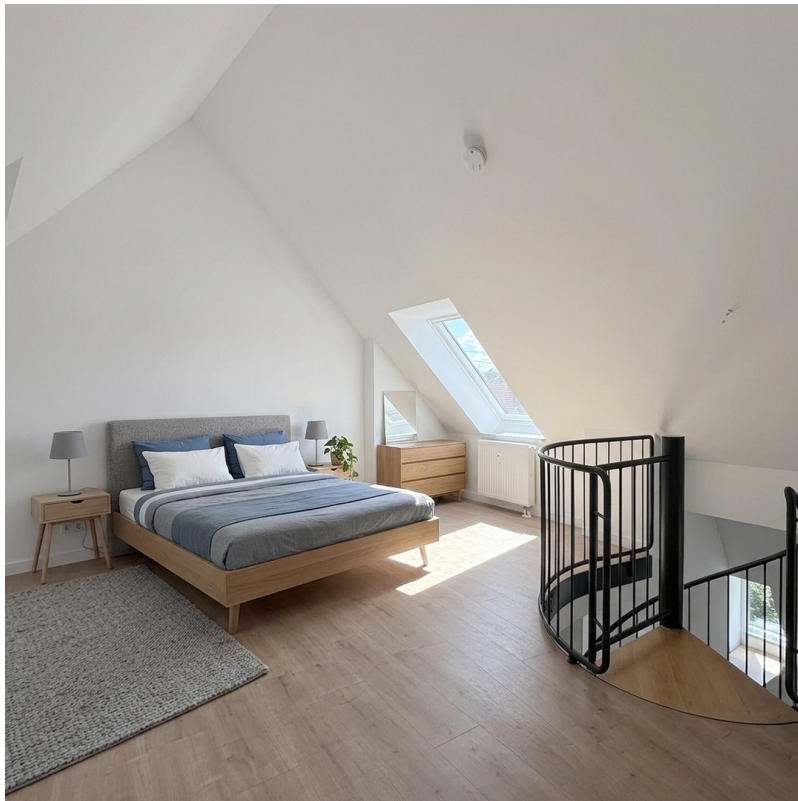
Einrichtungsbsp. 2, Galerie