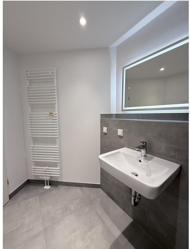
Bad mit Handtuchheizkörper