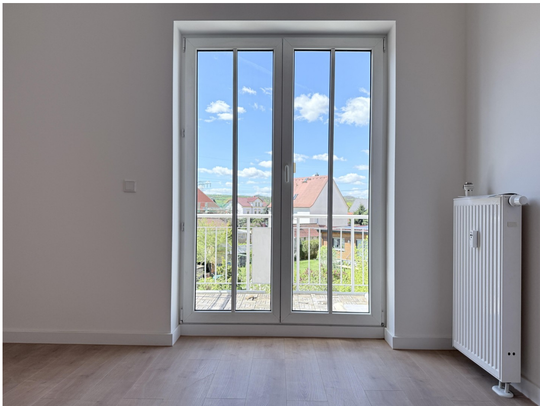
Zugang zum Balkon