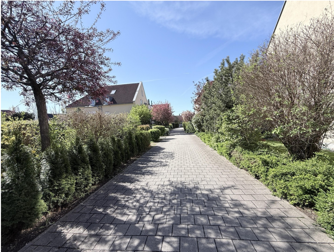
Blick in die gepflegte Anlage