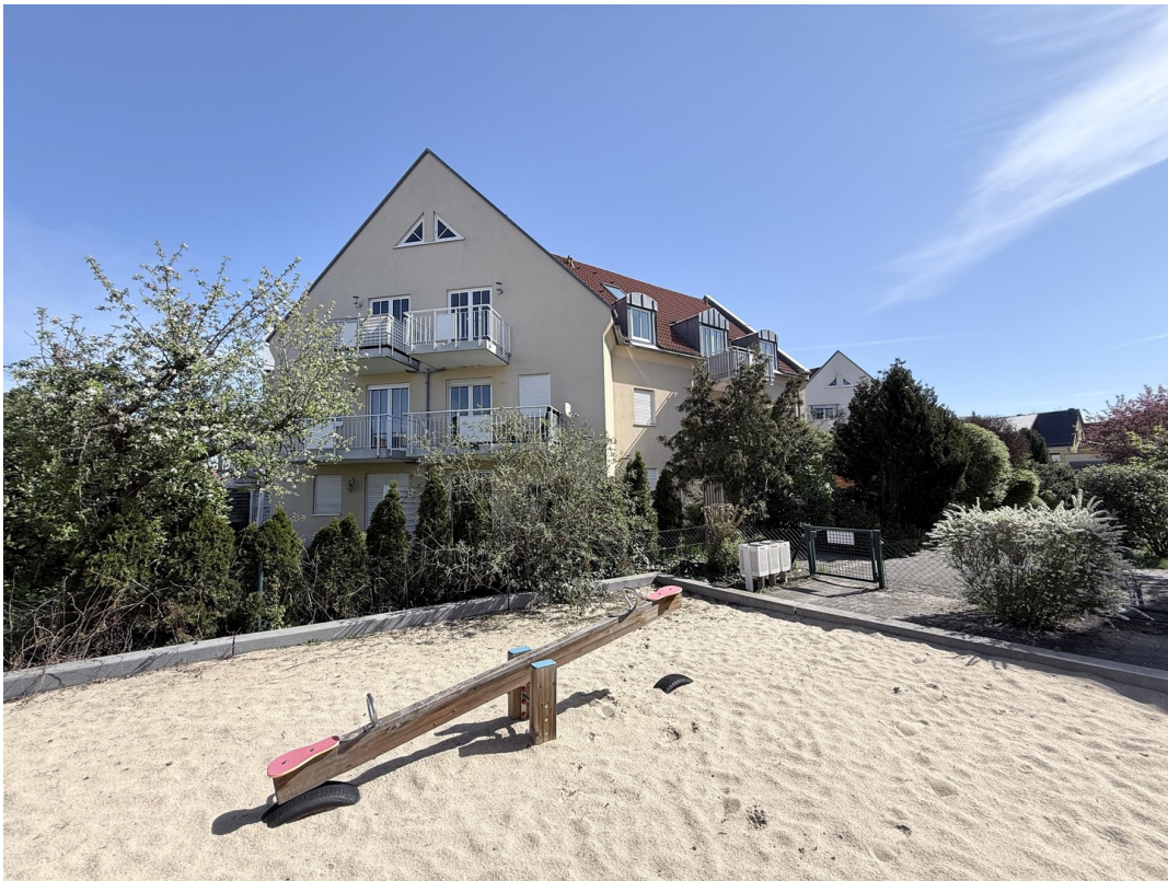
Sandkasten in der Anlage