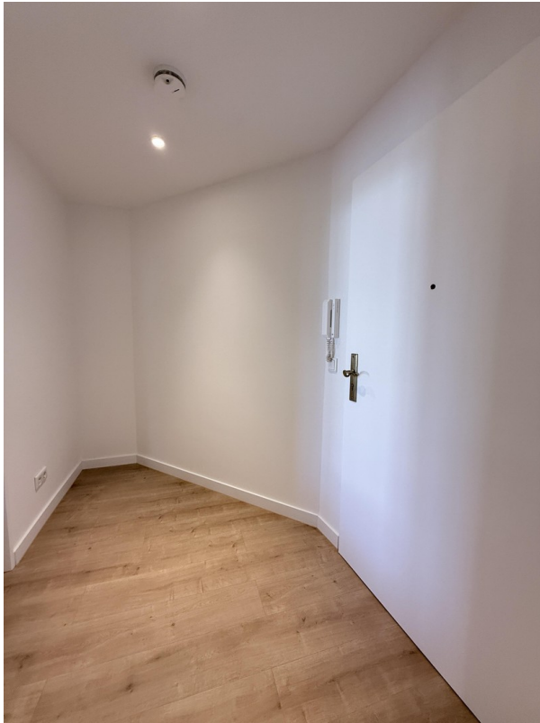
Flur mit Deckenspots