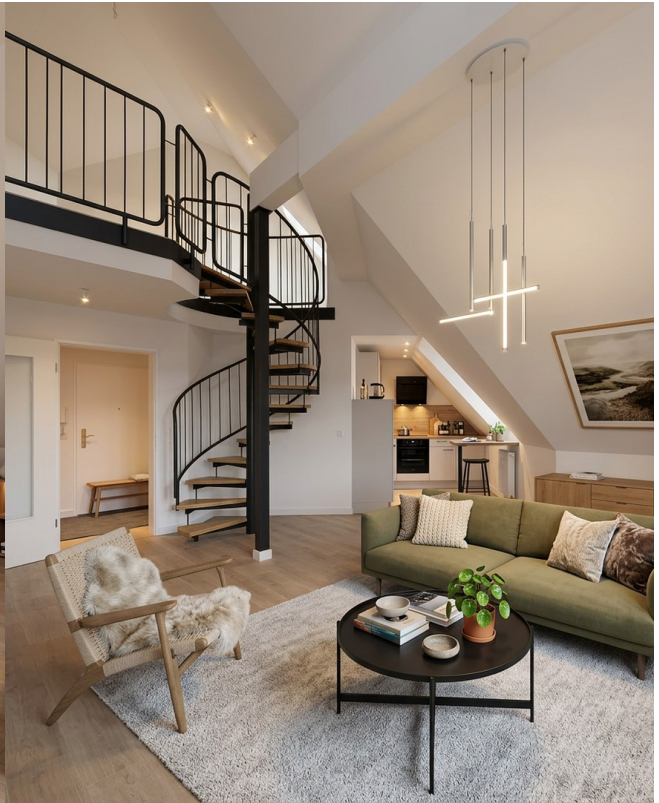
Einrichtungsbeispiel 3, Wohnen