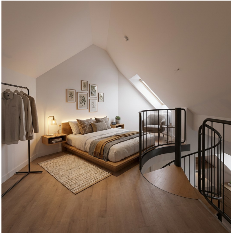
Einrichtungsbsp. 1, Galerie