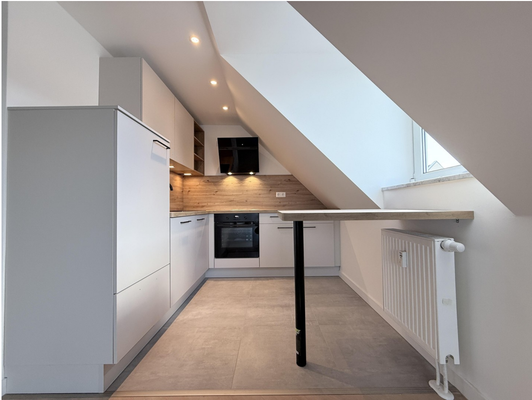
Blick in die Einbauküche