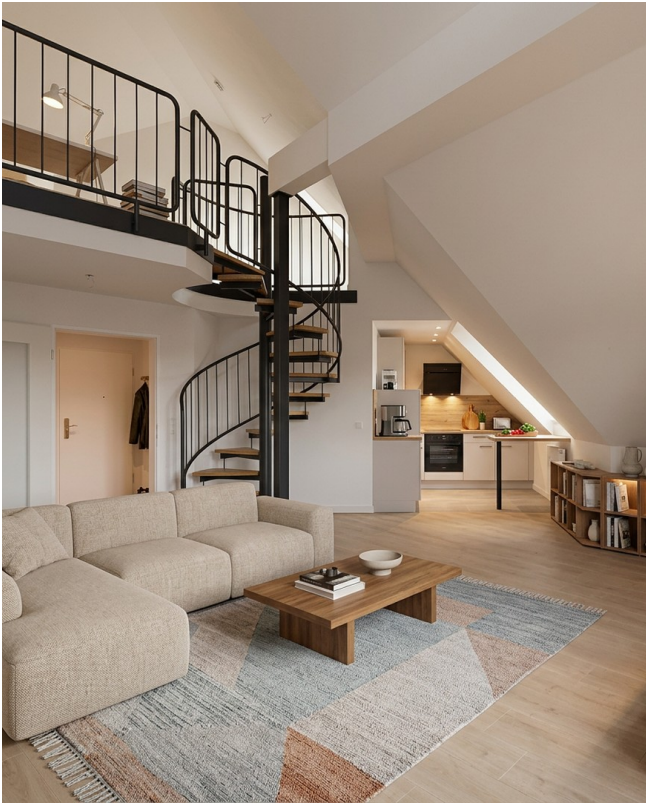
Einrichtungsbeispiel 2, Wohnen