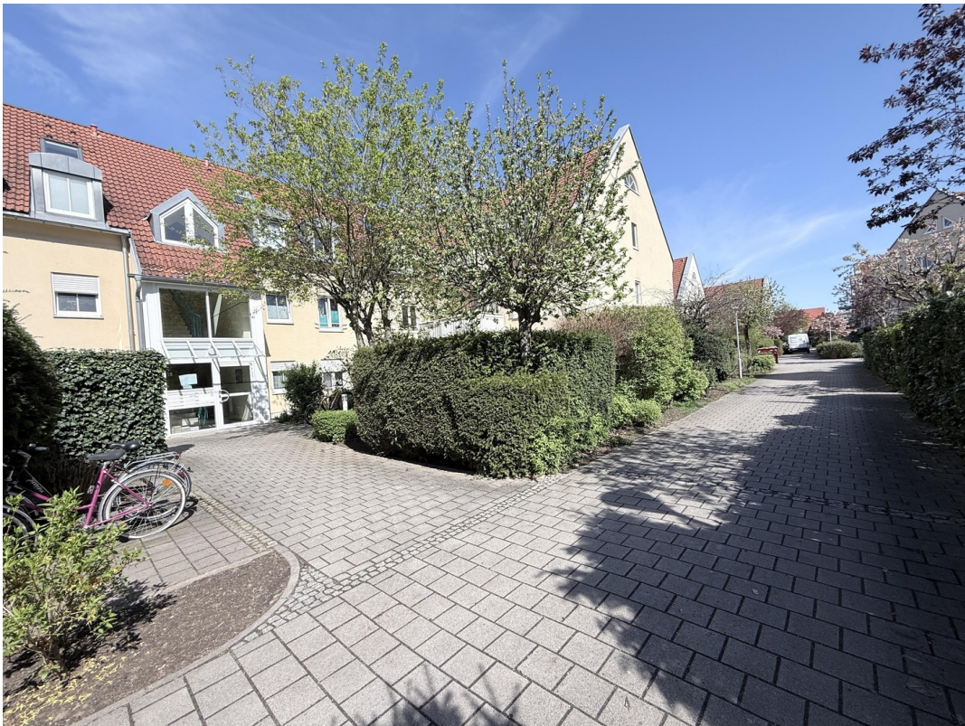
Zugang zum Haus