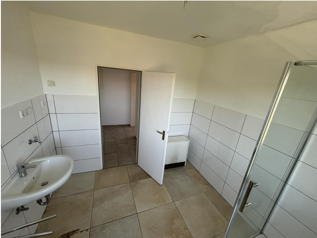
Whg. 2 - Badezimmer