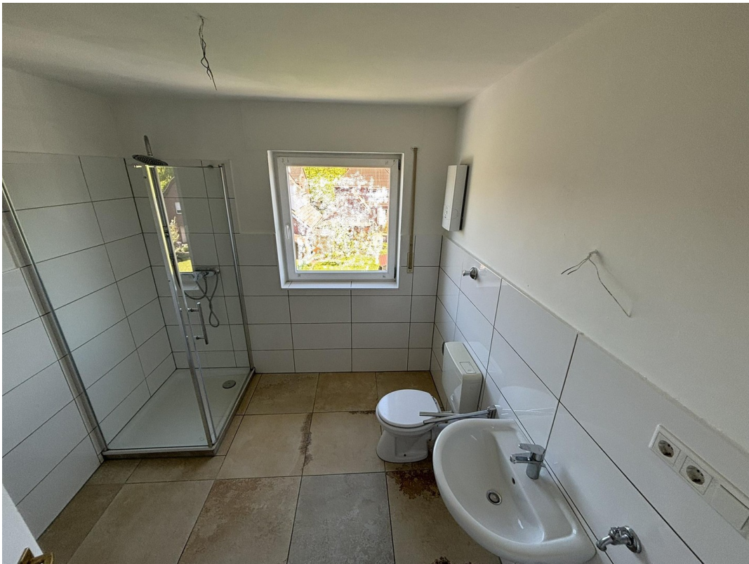
Whg. 2 - Badezimmer