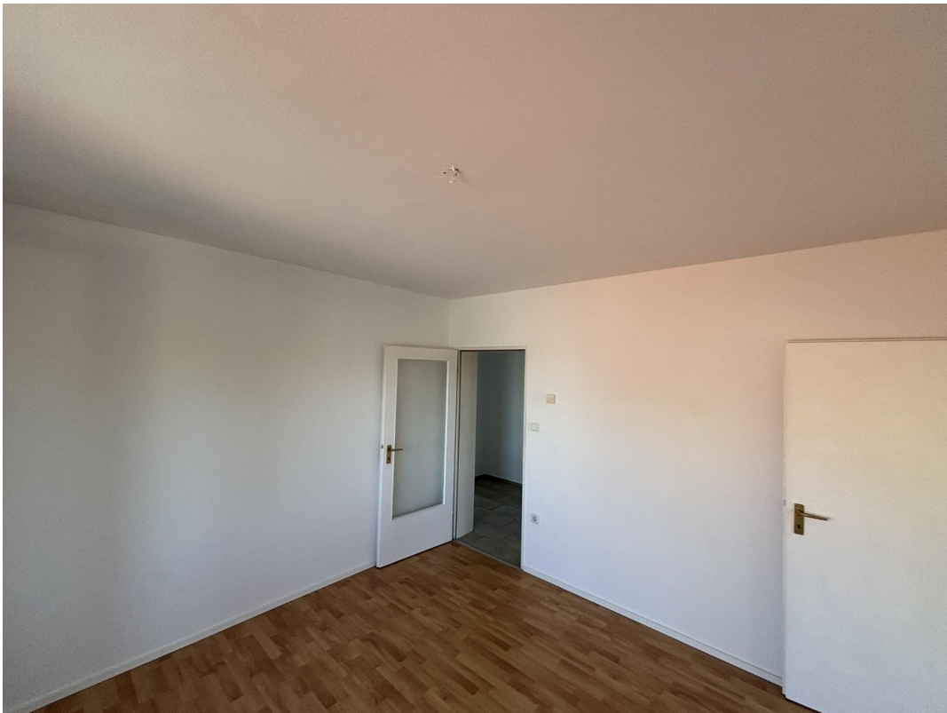
Whg. 2 - Wohnzimmer