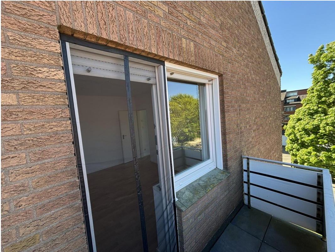
Whg. 2 - Balkon