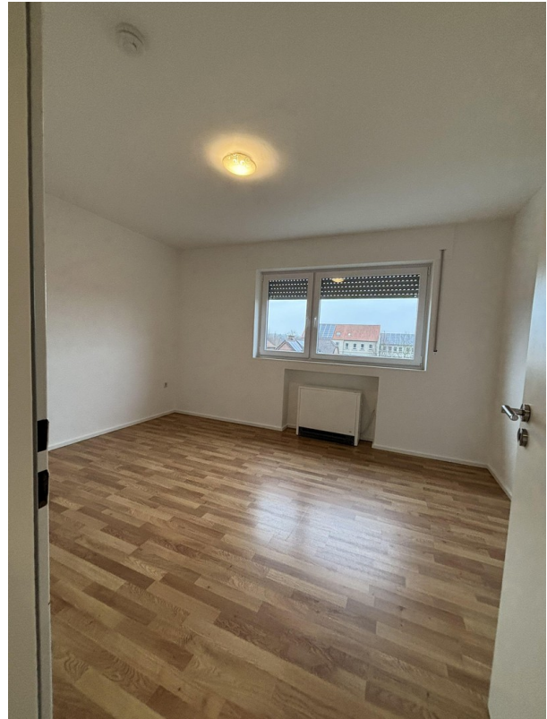
Whg. 1 - Schlafzimmer