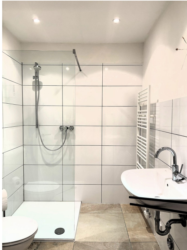
Whg. 1 - Badezimmer