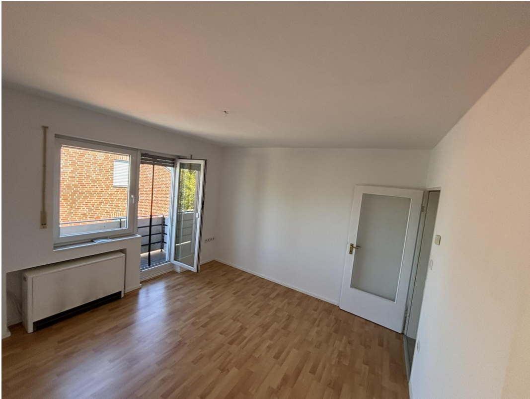
Whg. 2 - Wohnzimmer