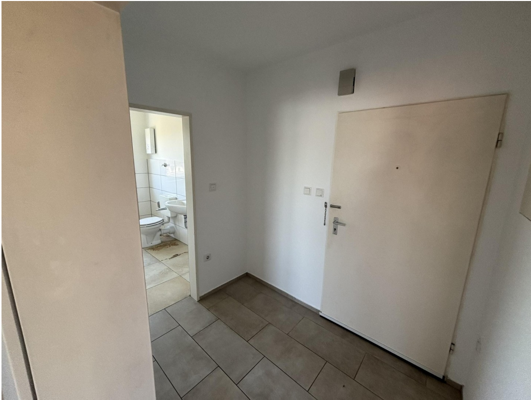
Whg. 2 - Flur