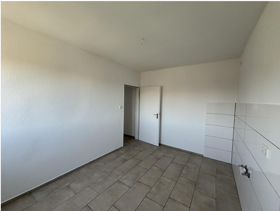
Whg. 2 - Küche