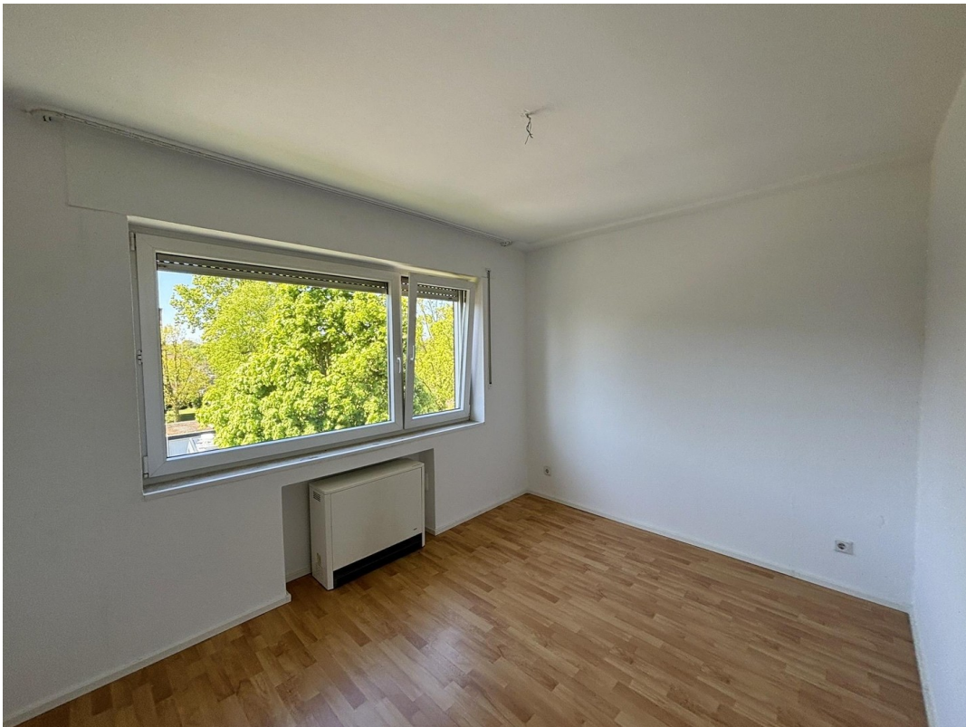
Whg. 2 - Schlafzimmer