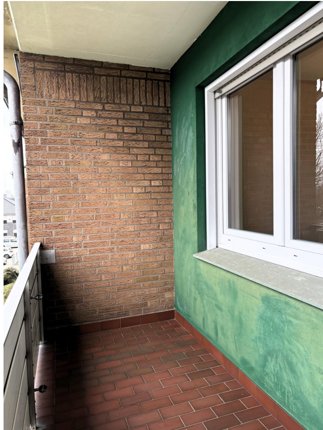
Whg. 1 - Balkon