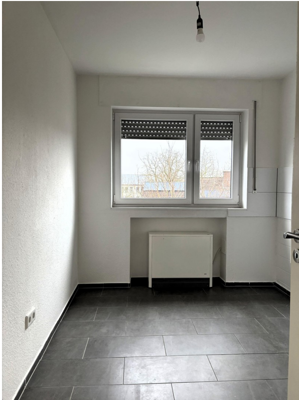
Whg. 1 - Küche