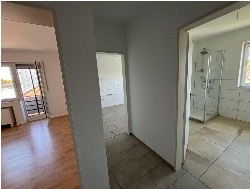
Whg. 2 - Flur