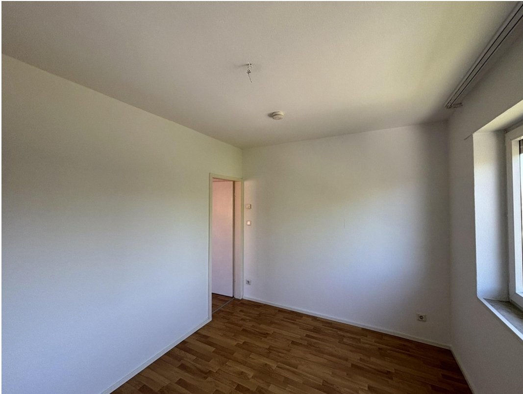
Whg. 2 - Schlafzimmer