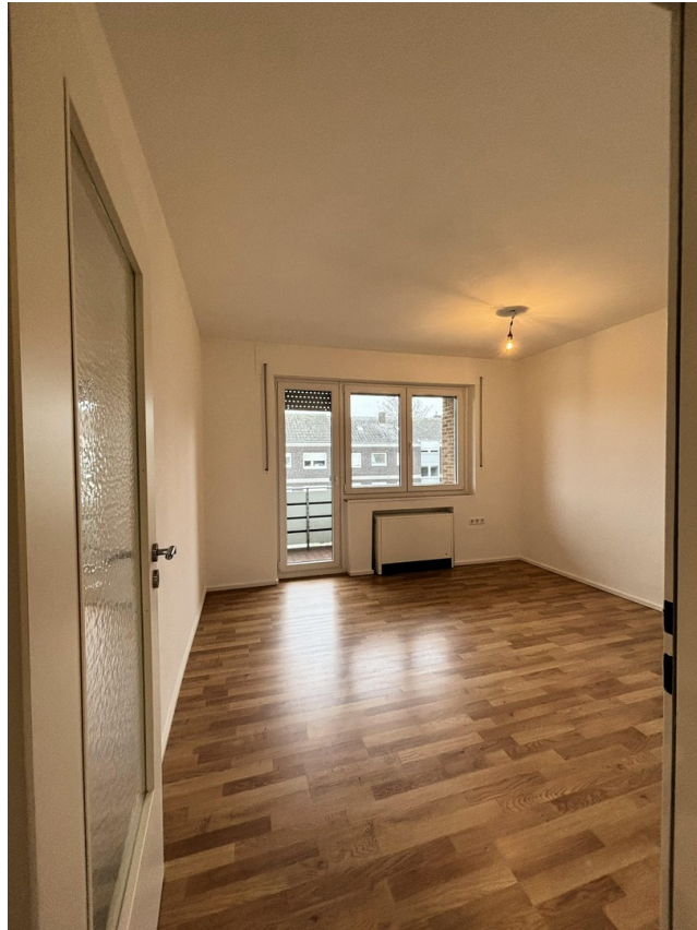
Whg. 1 - Wohnzimmer