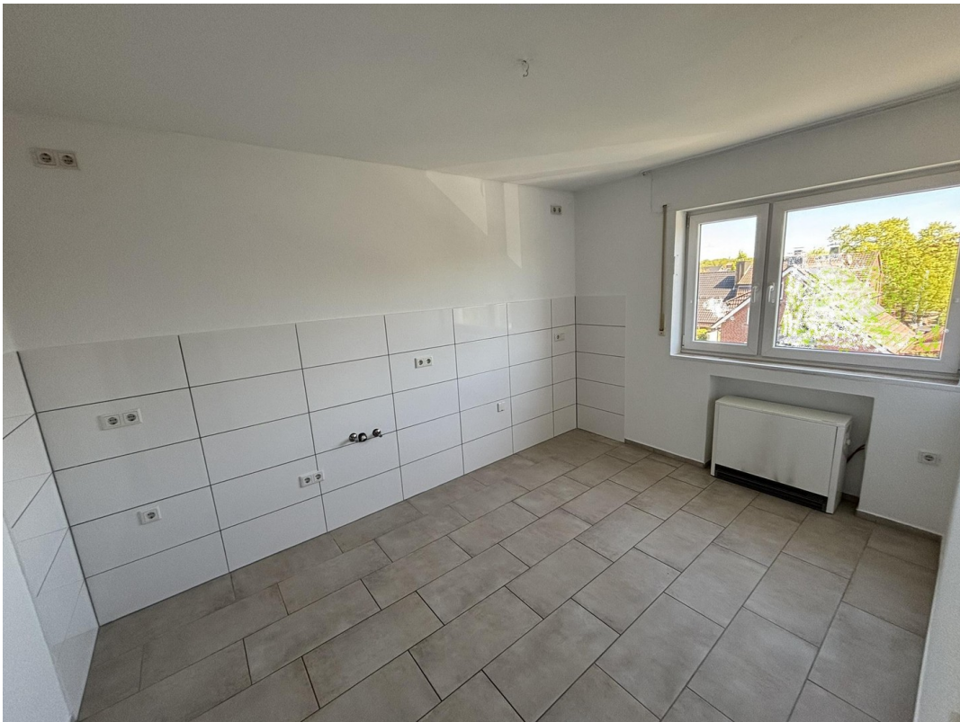
Whg. 2 - Küche