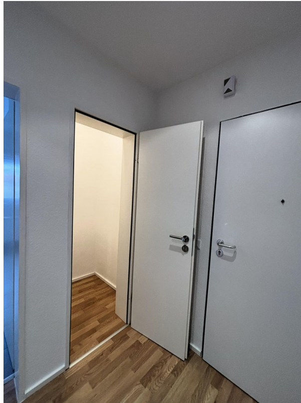
Whg. 1 - Abstellraum