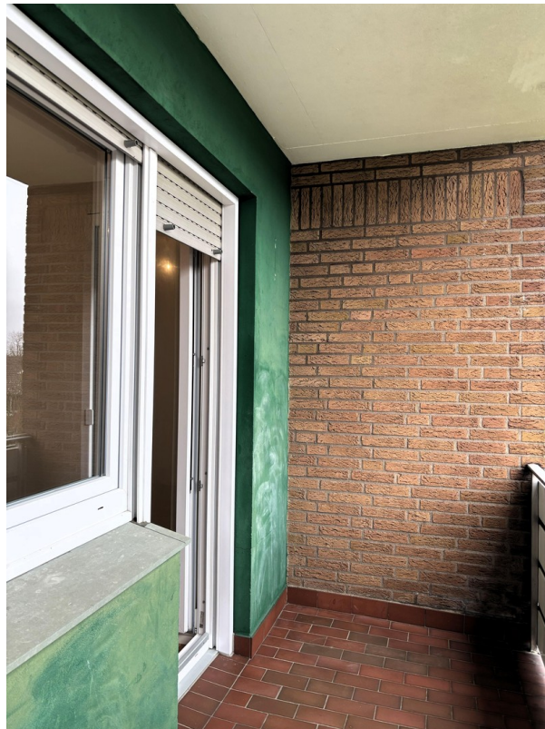
Whg. 1 - Balkon