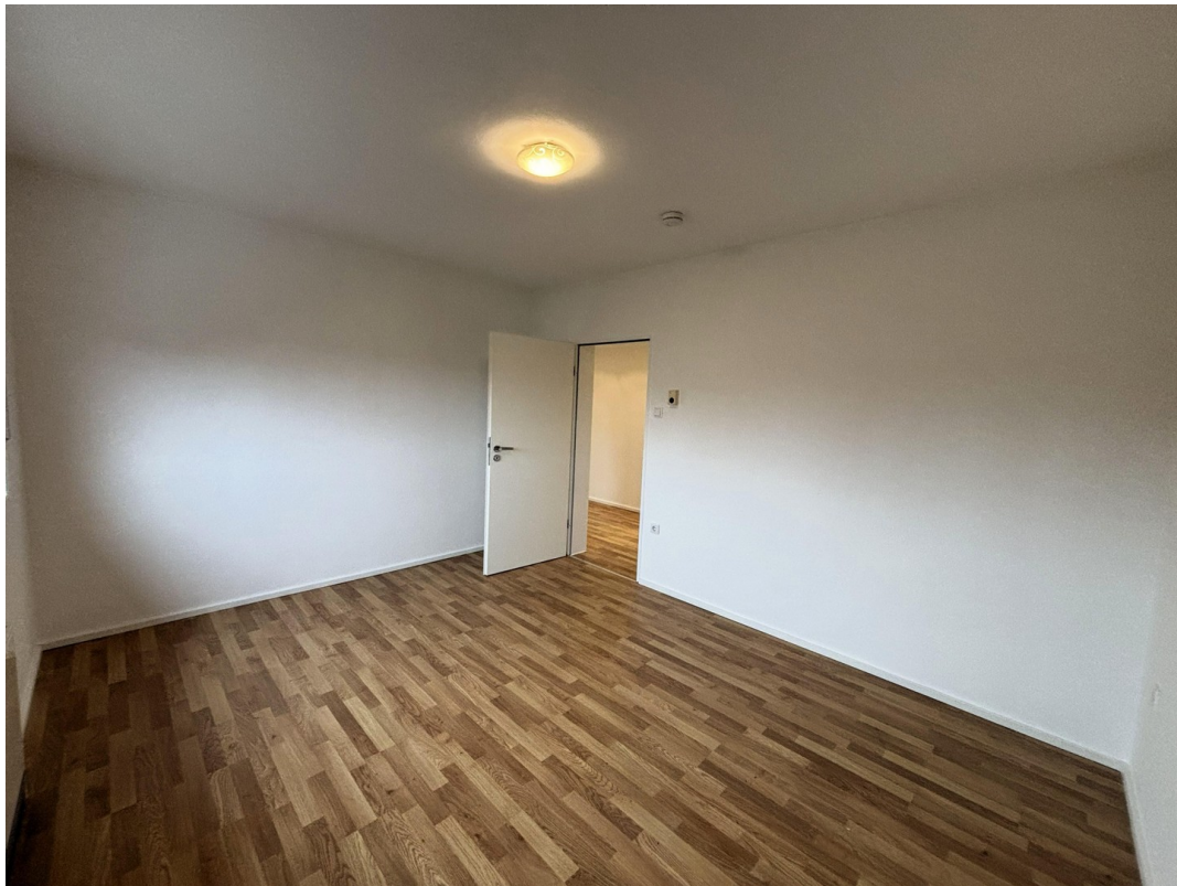
Whg. 1 - Schlafzimmer