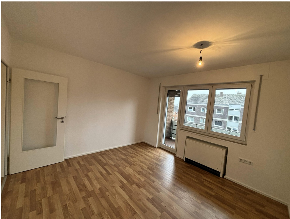
Whg. 1 - Wohnzimmer