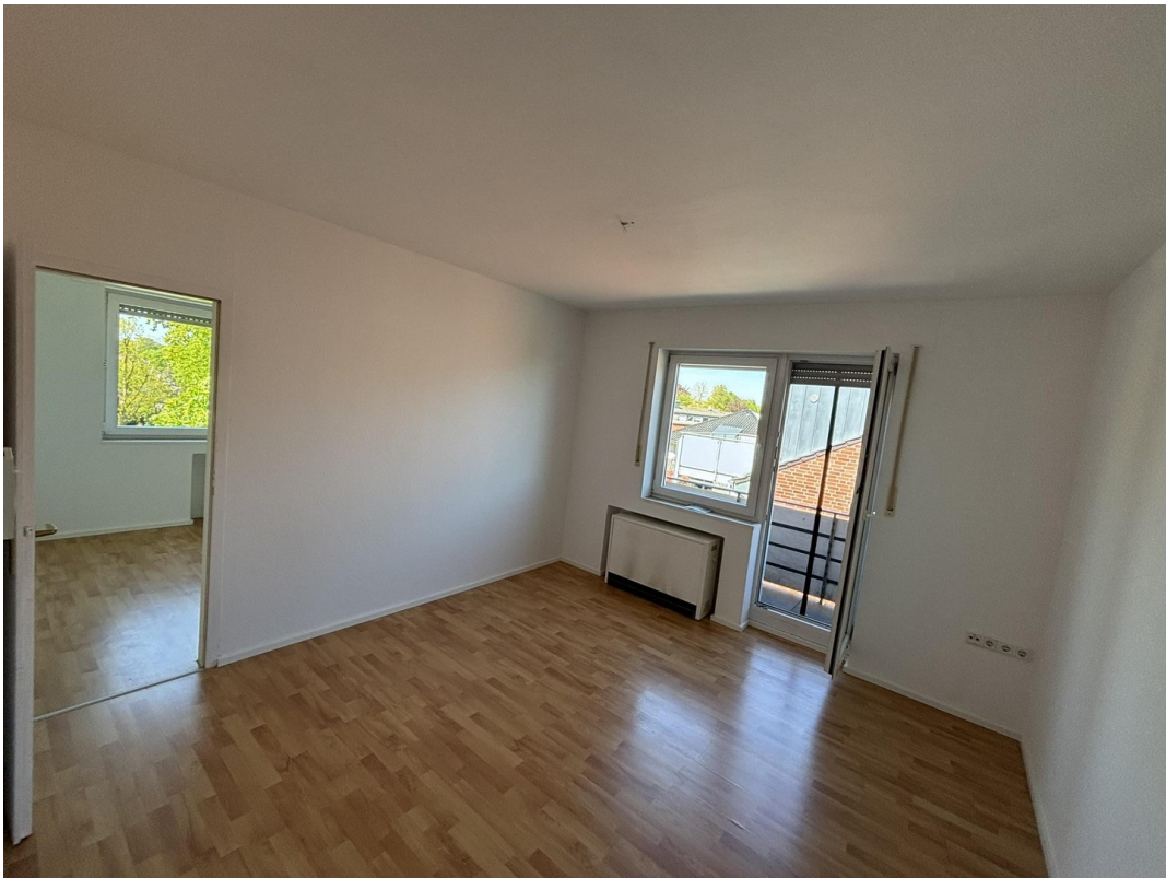
Whg. 2 - Wohnzimmer