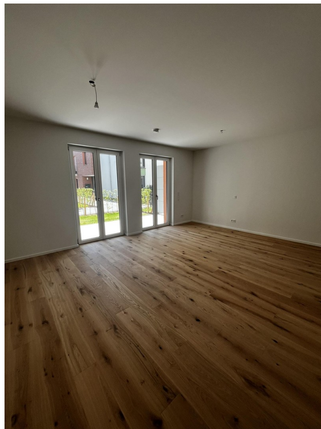
Wohnzimmer & Küche