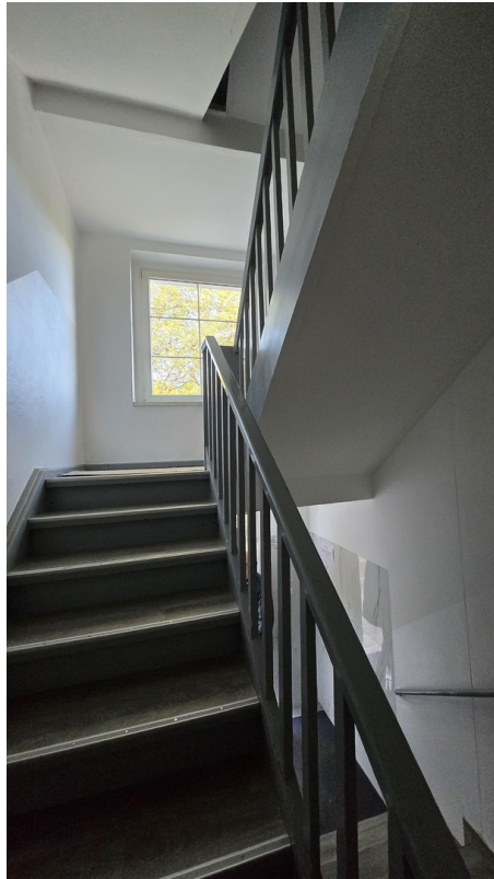
Aufgang zum 1. OG