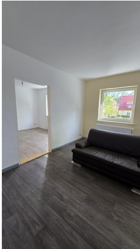
Wohnzi. mit Blick in Schlafzi.