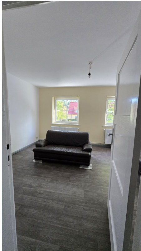
Wohnzi., li. Durchgang Schlafz