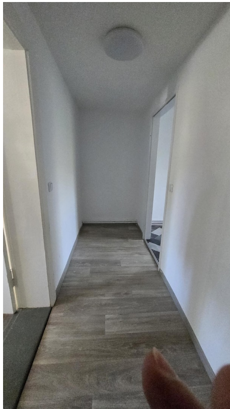
Flur, Tür re. Küche, li. Wohnz