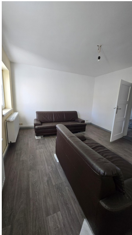
Wohnzi. mit Tür zum Flur