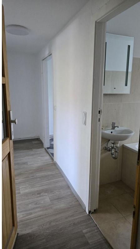
Blick von Wohnungstür in Whg.