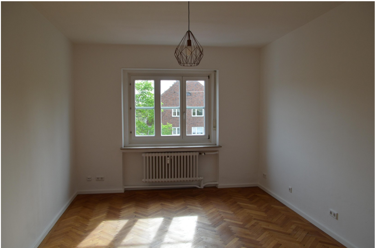
2. Zimmer (ca. 17,83 m2)