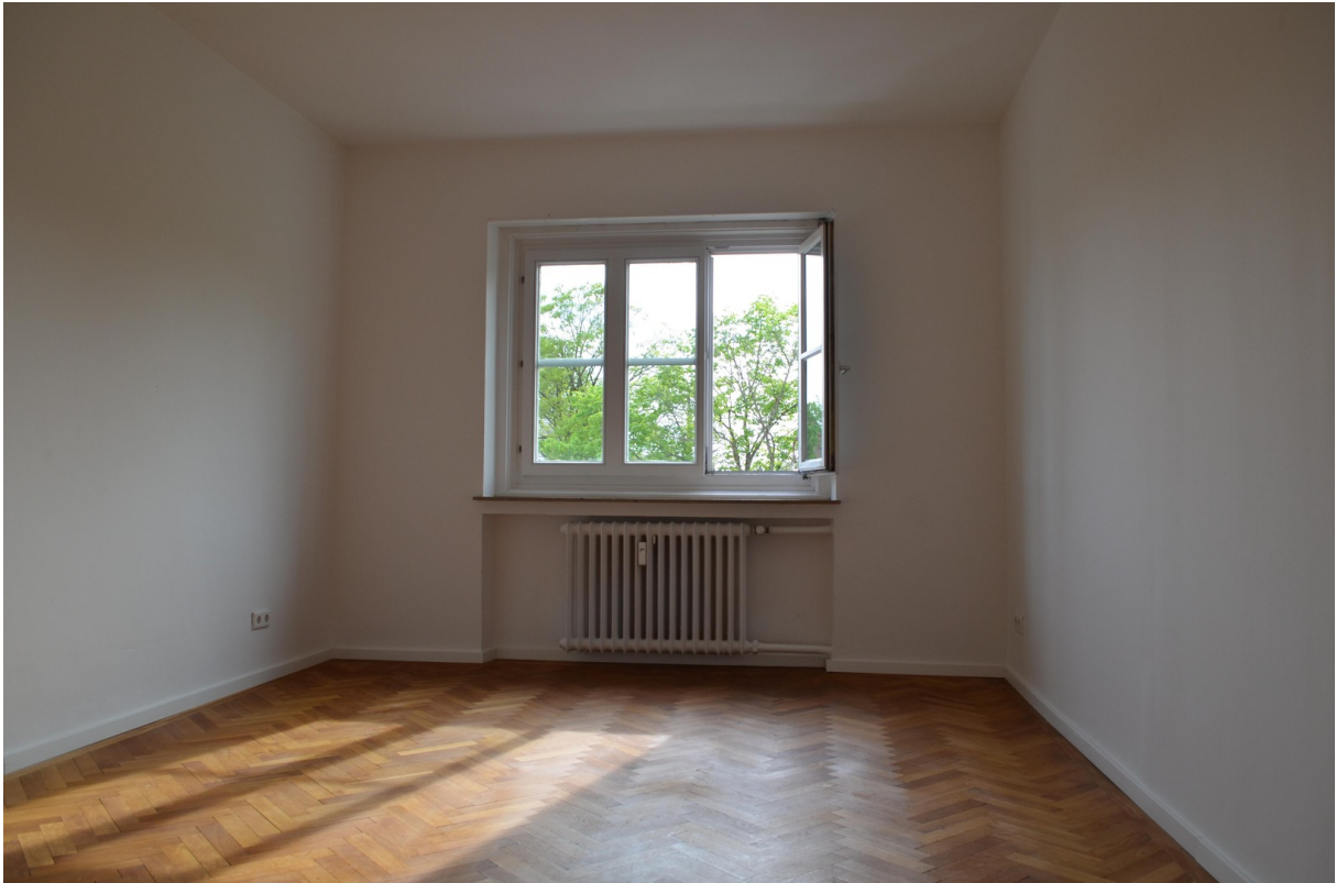
1. Zimmer (ca. 17,76 m2)