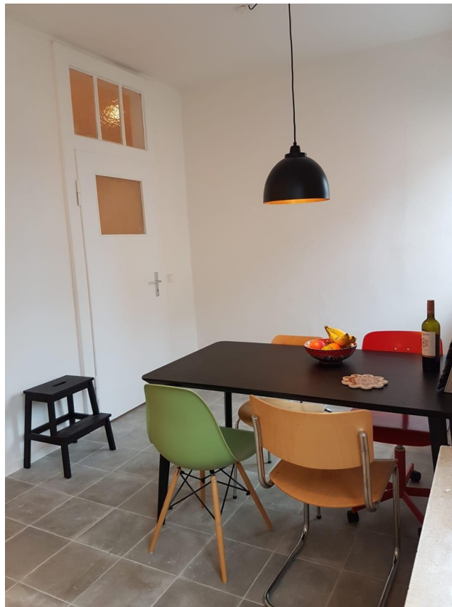
Wohnküche Bild 2 (ca. 17,23 m 2 )