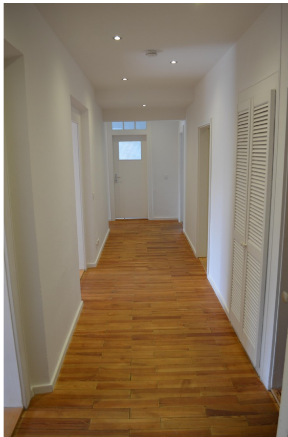
Flur (ca. 15,24 m 2 )