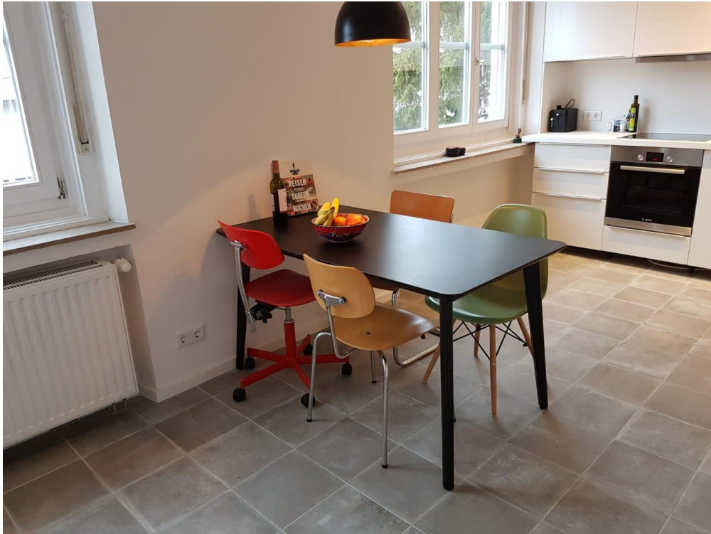
Wohnküche Bild 3 (ca. 17,23 m 2 )