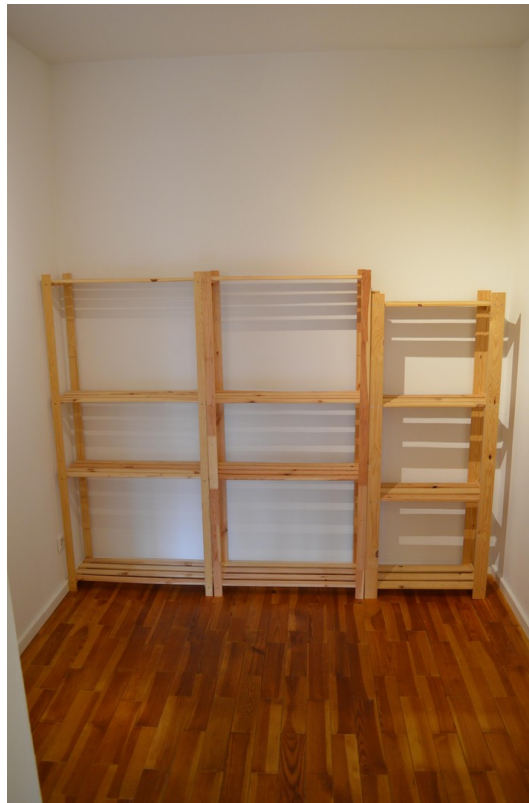
Abstellraum (ca. 6,18 m 2 )