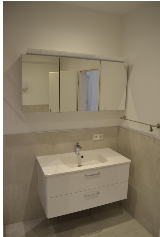
Bad Bild 2 (ca. 8,03 m 2 )