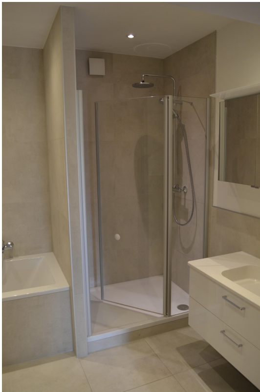
Bad Bild 1 (ca. 8,03 m 2 )