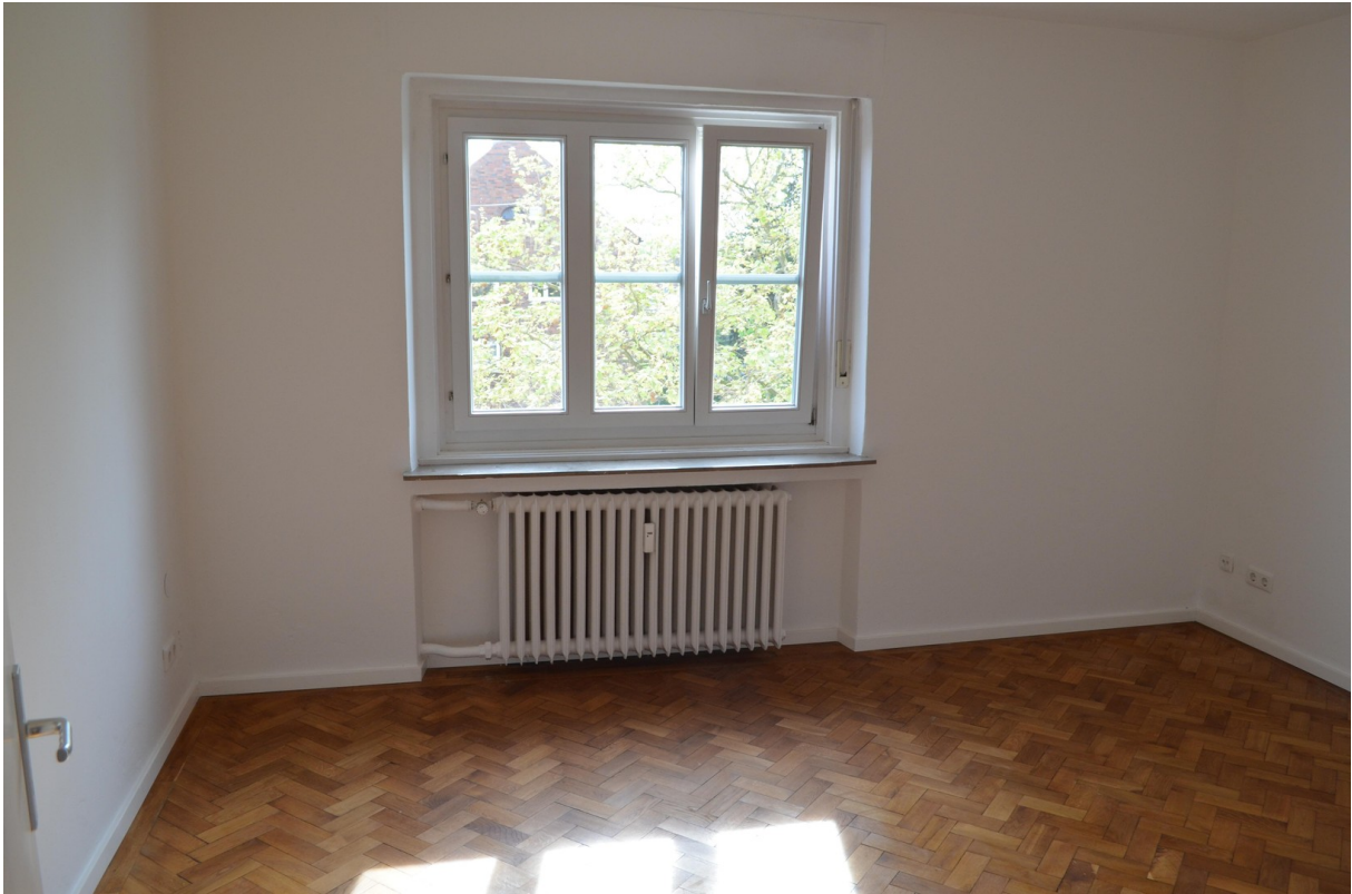
3. Zimmer (ca. 16,81 m 2 )