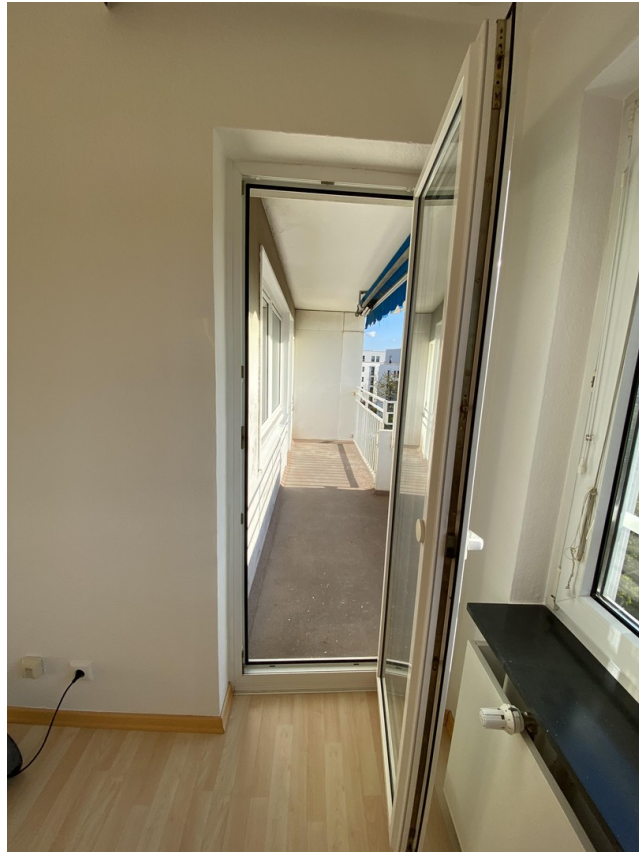
Zutritt von beiden WG Zimmern