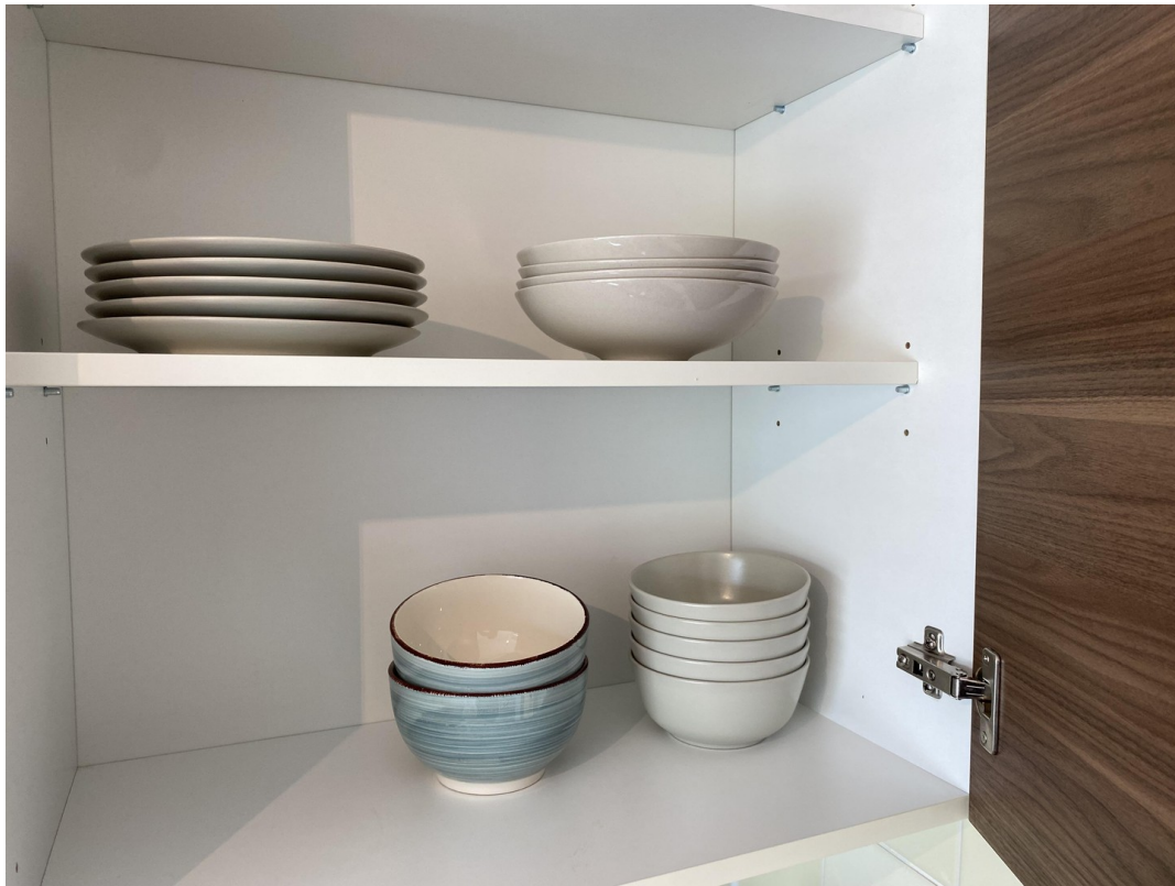
inkl. Besteck, Geschirr, Töpfe