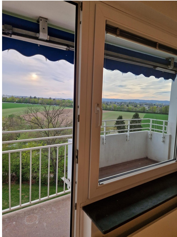
Ausblick WG Zimmer