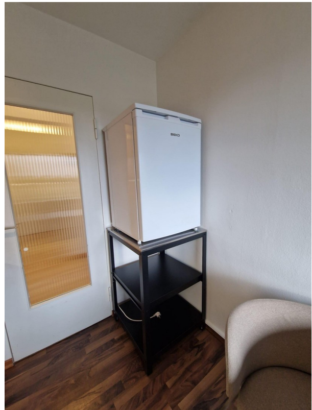
Kühlschrank mit Ablage