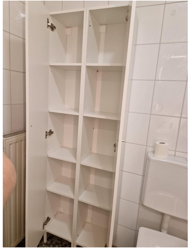
Badezimmerschrank für WG