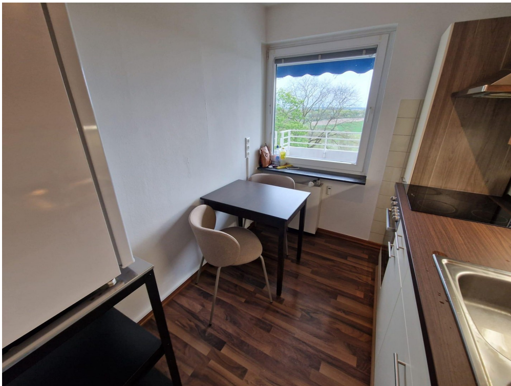
Küche mit Sitzecke