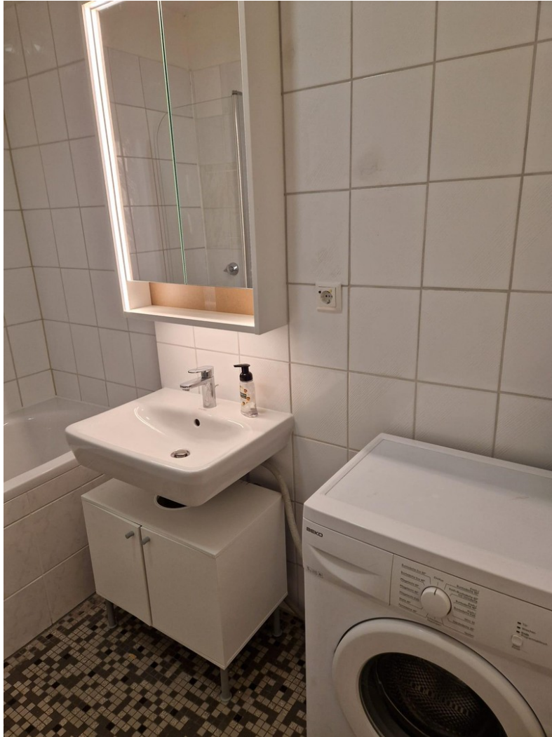
Waschmaschine im Bad