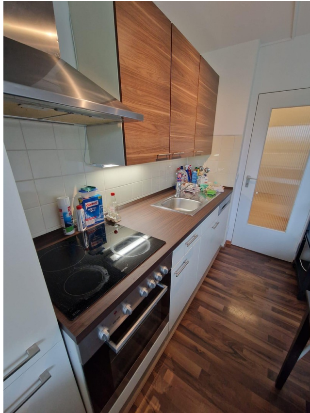
Küche komplett eingerichtet