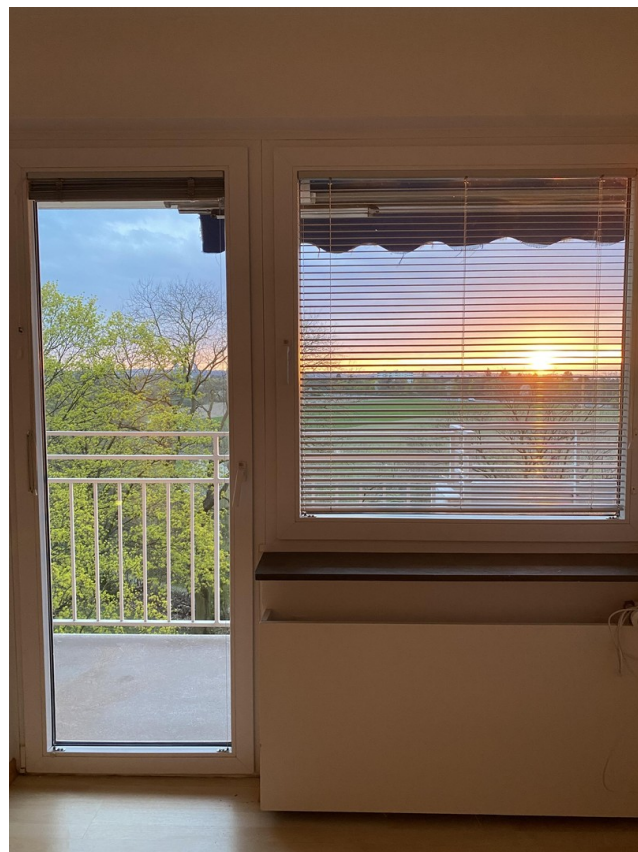
Abendsonne durch WG Fenster