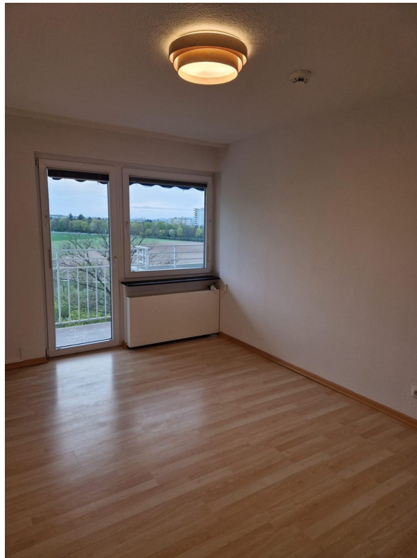
Dein 15qm Zimmer