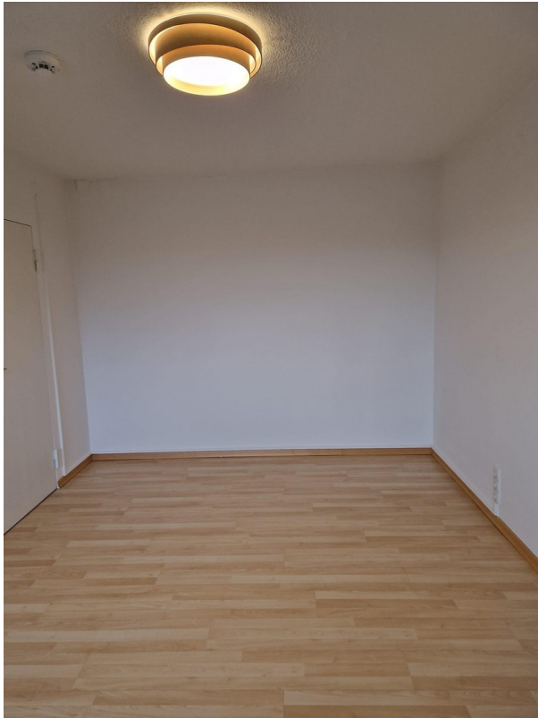
Dein 15qm Zimmer