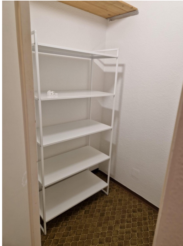
Abstellraum von 4qm