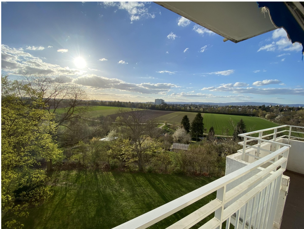
Ab späten Mittag Sonne