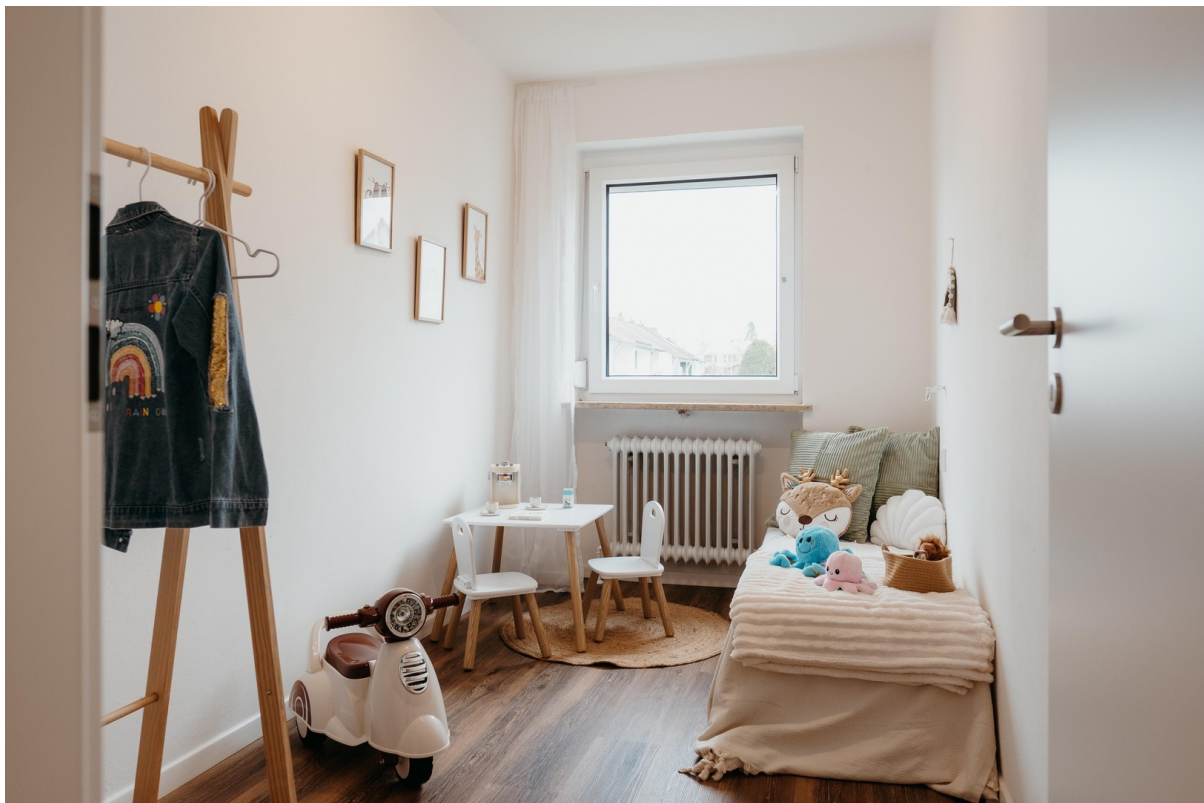
Kinder- oder Arbeitszimmer