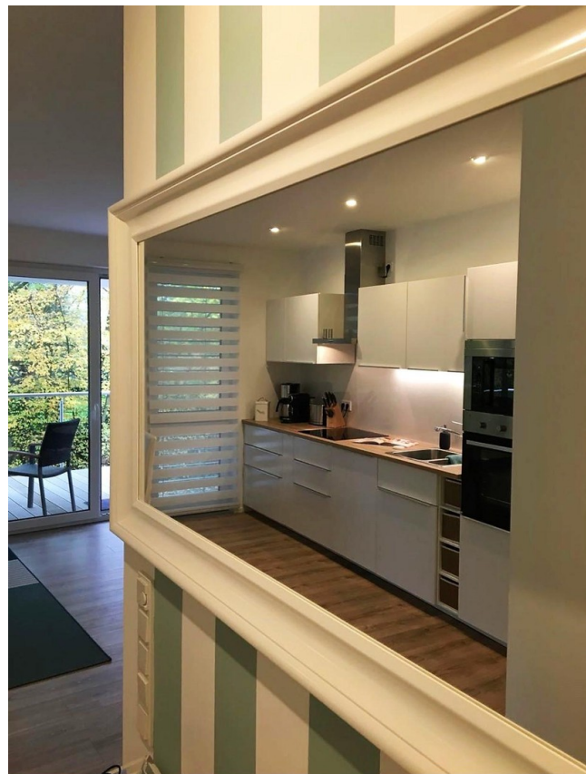
Flur Küchen aus Spiegel