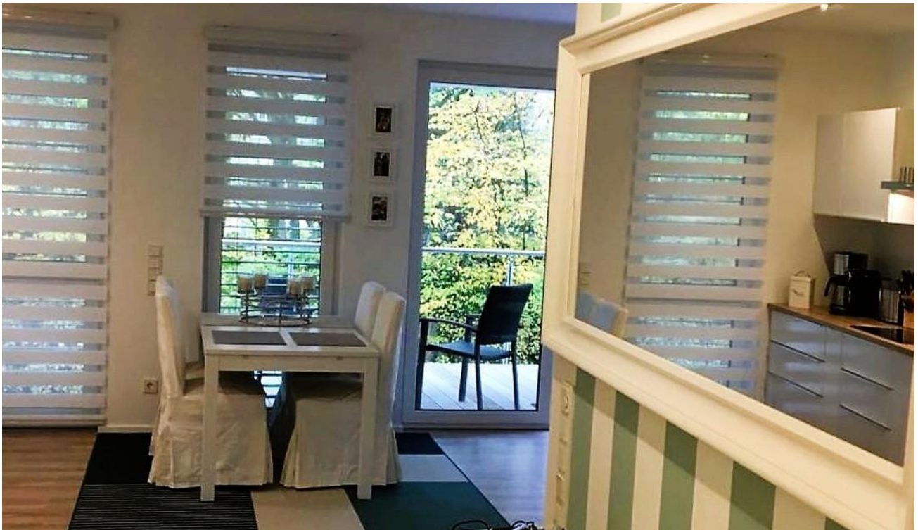
Flue und Küche