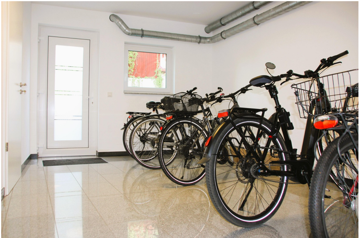
Fahrradkeller mit separaten Ei