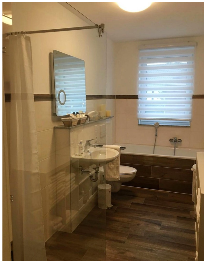
Bad und Dusche