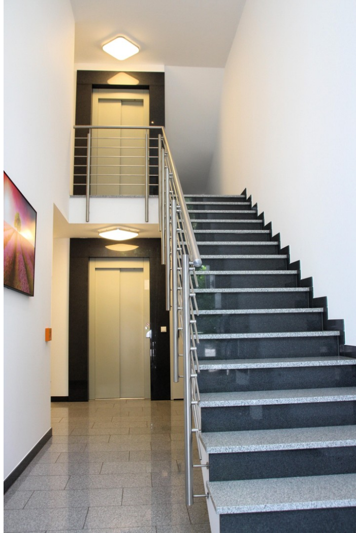
Treppenhaus mit Aufzug