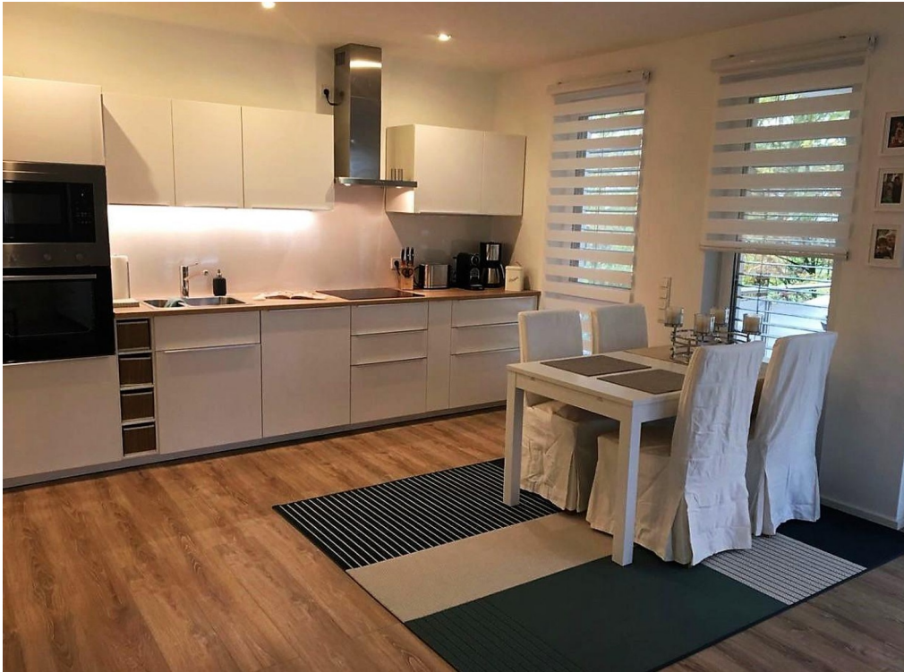
Küche und Essen