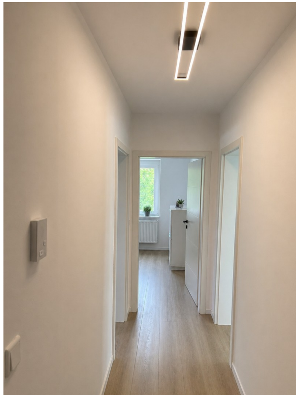
Flur / Eingangsbereich