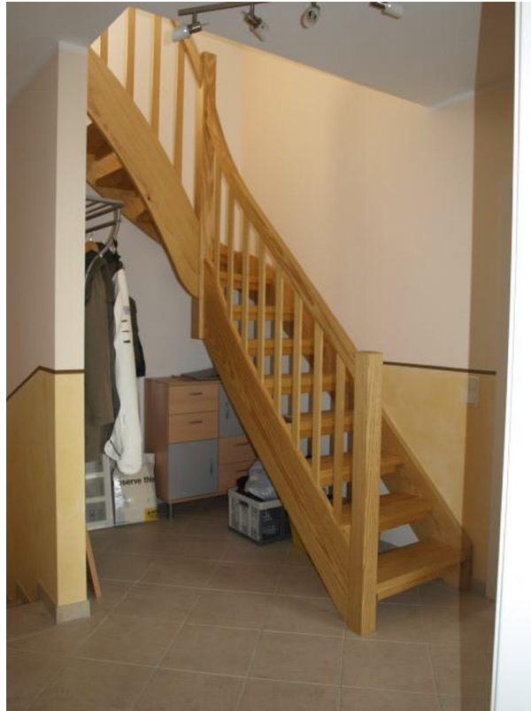
Treppe ins DG