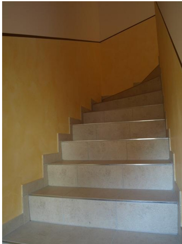
Treppe ins OG