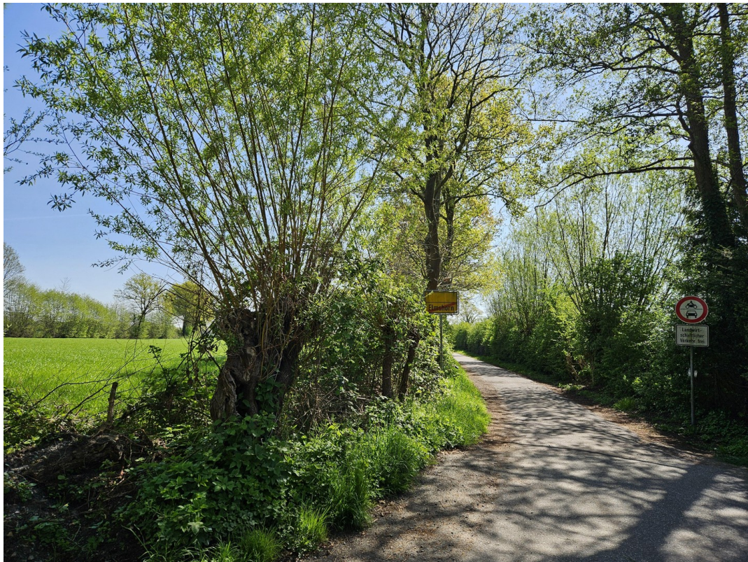
Natur direkt vor der Tür