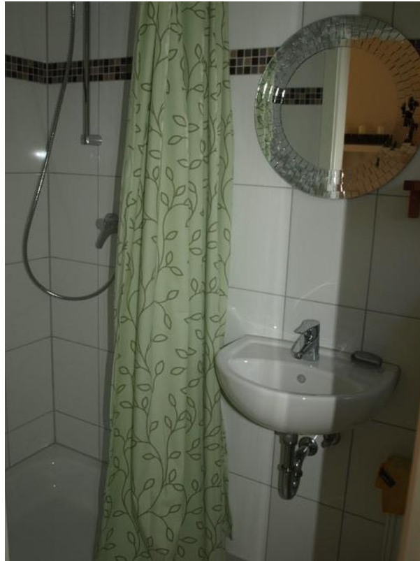
Gäste WC mit Dusche EG