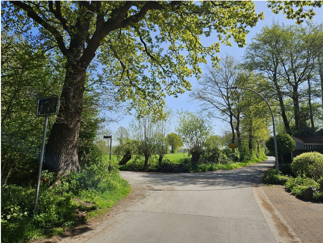
Liether Moor fussläufig