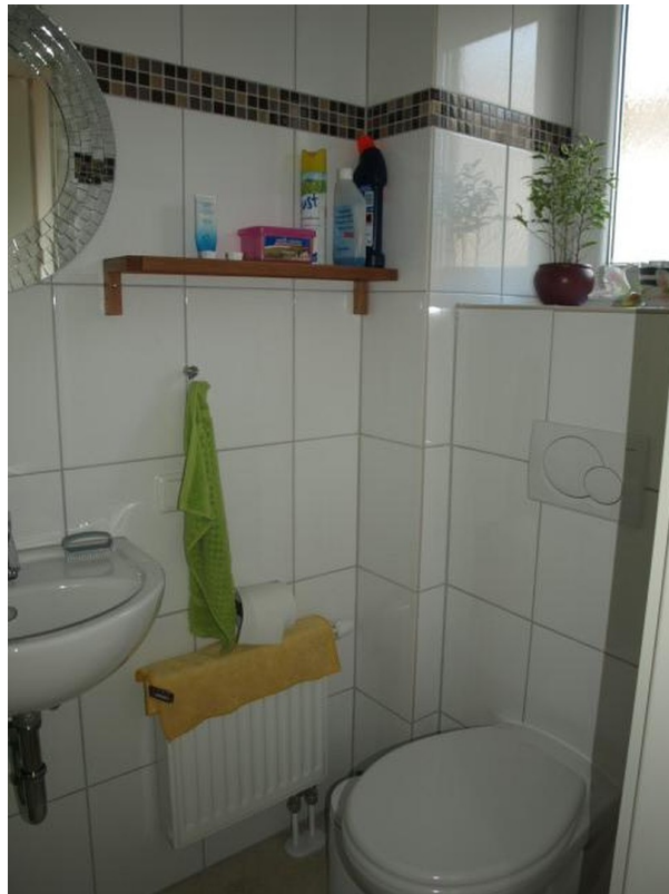
Gäste WC mit Dusche EG