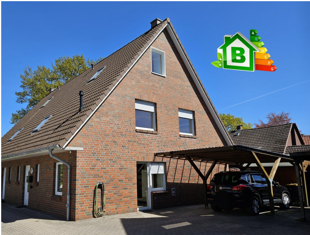
freie DHH mit Carport