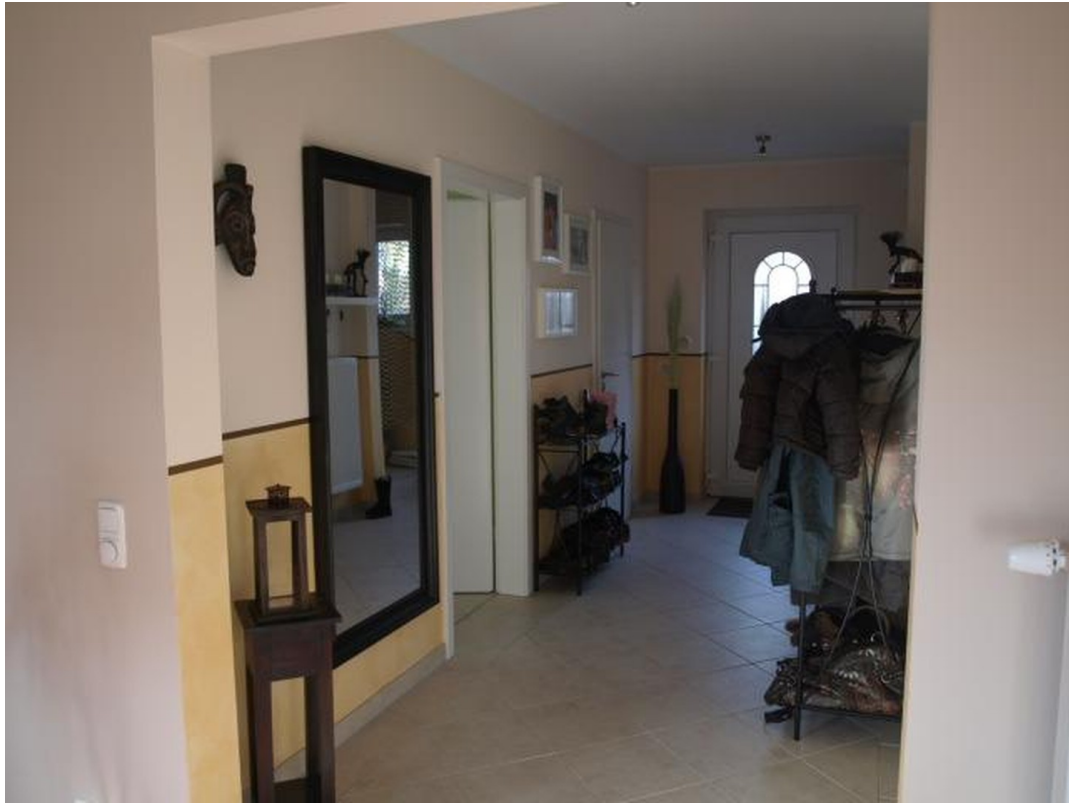
Eingangsbereich /Flur EG