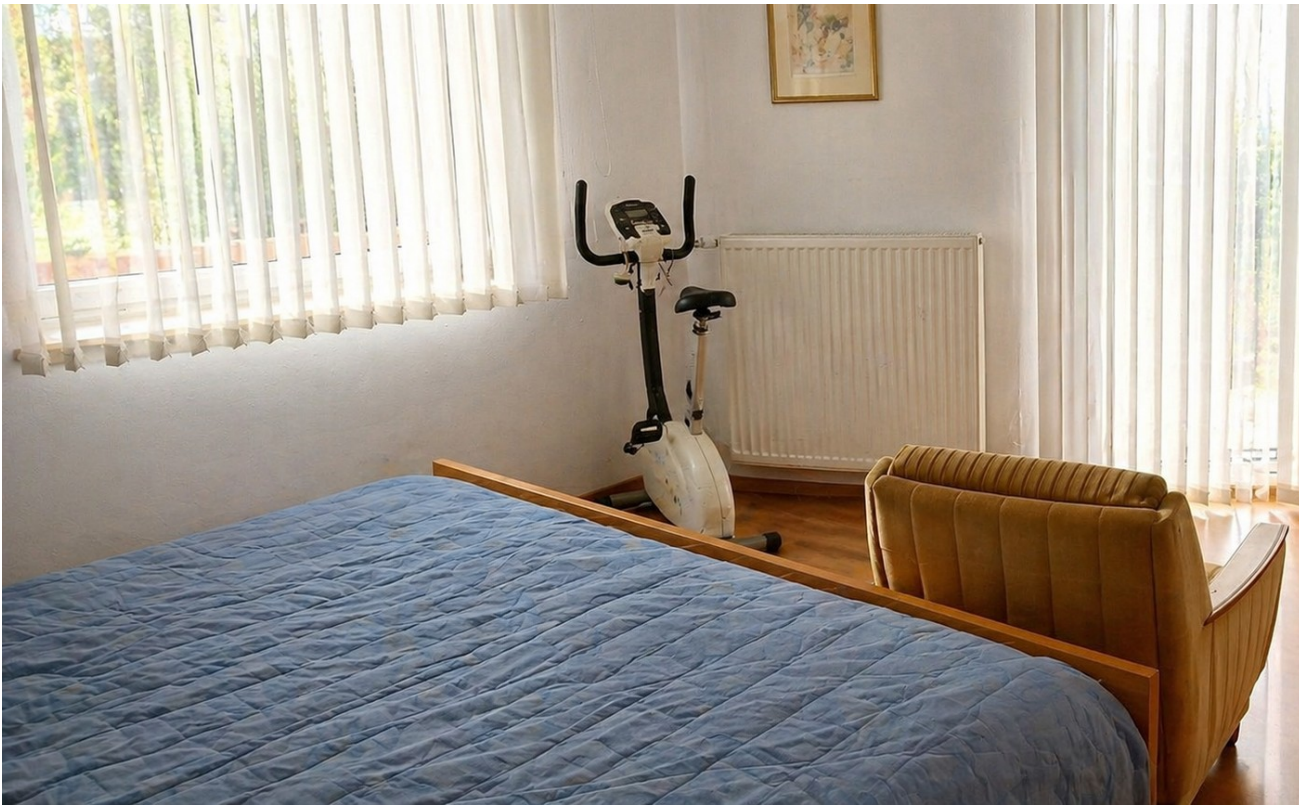
Schlafzimmer mit Balkonzugang