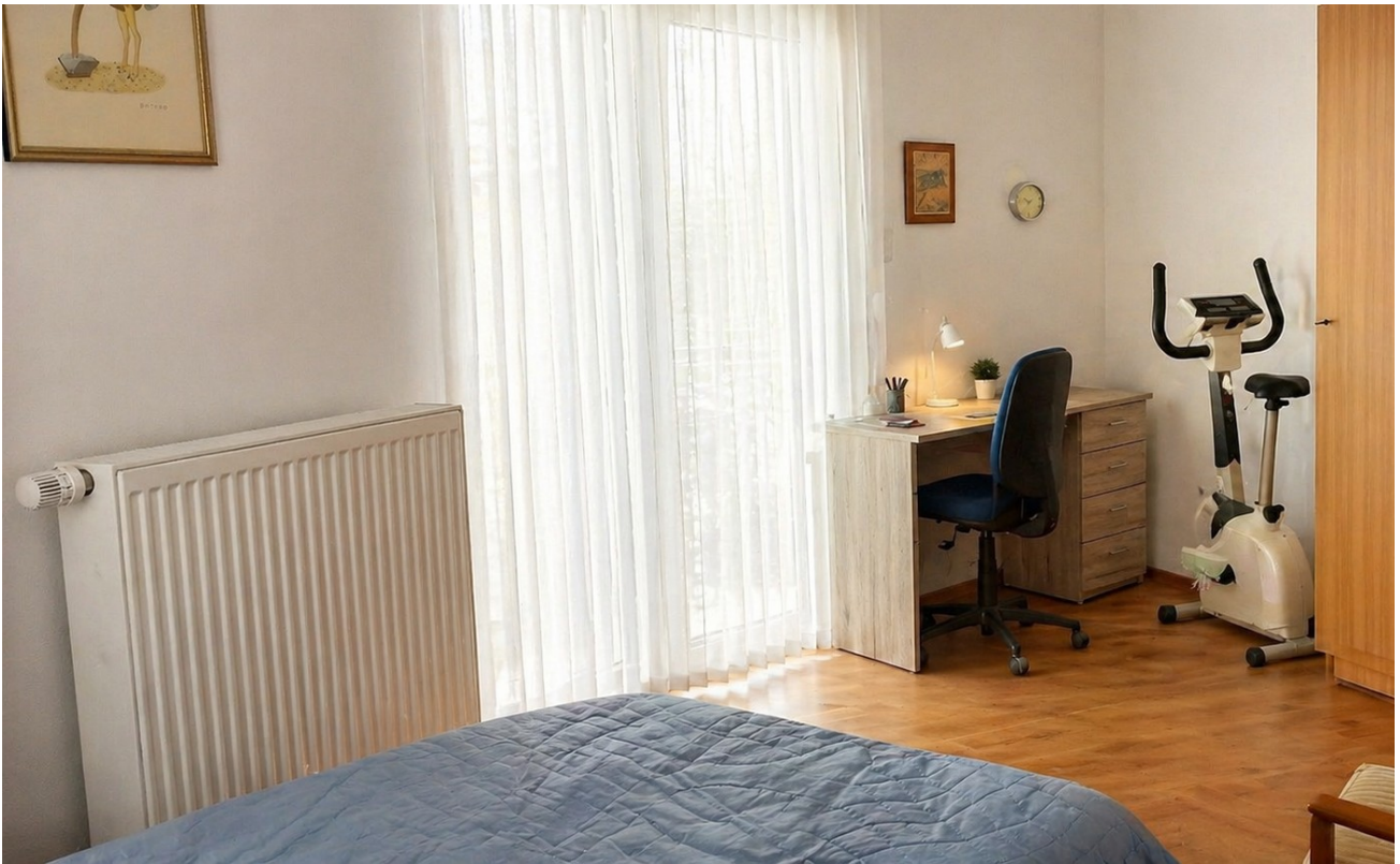
Schlafzimmer mit Arbeitsecke