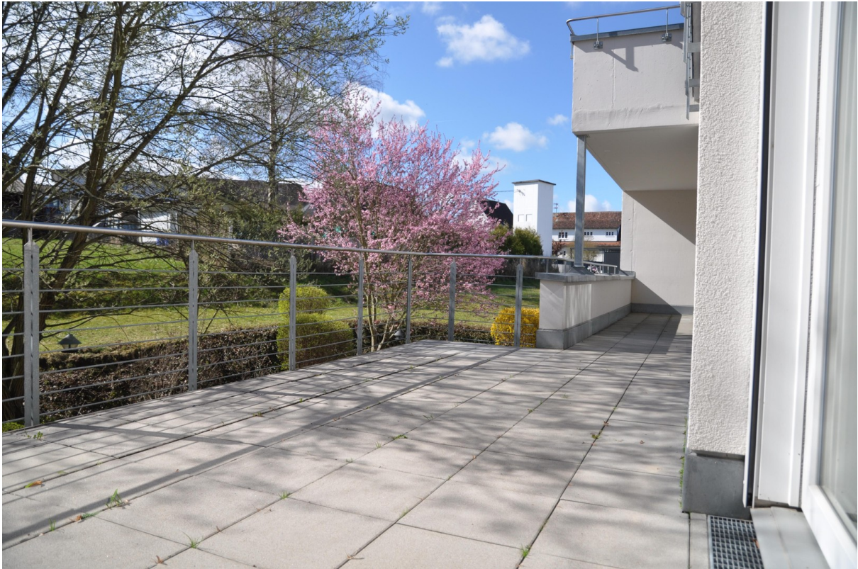
Sommer Feeling - Terrasse