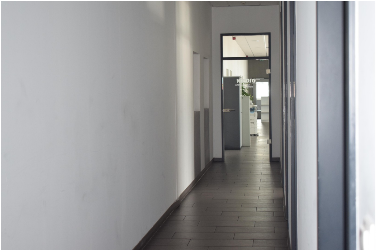
Bürotrakt mit Sozialräumen