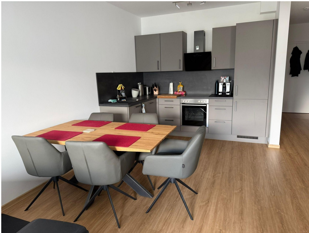
Küche u. Essplatz