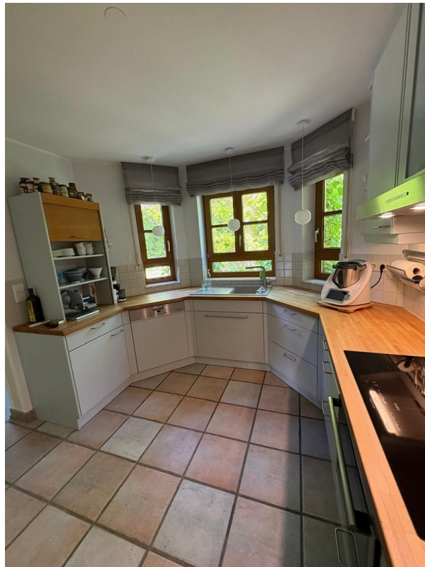
Küche, Wohnung 1