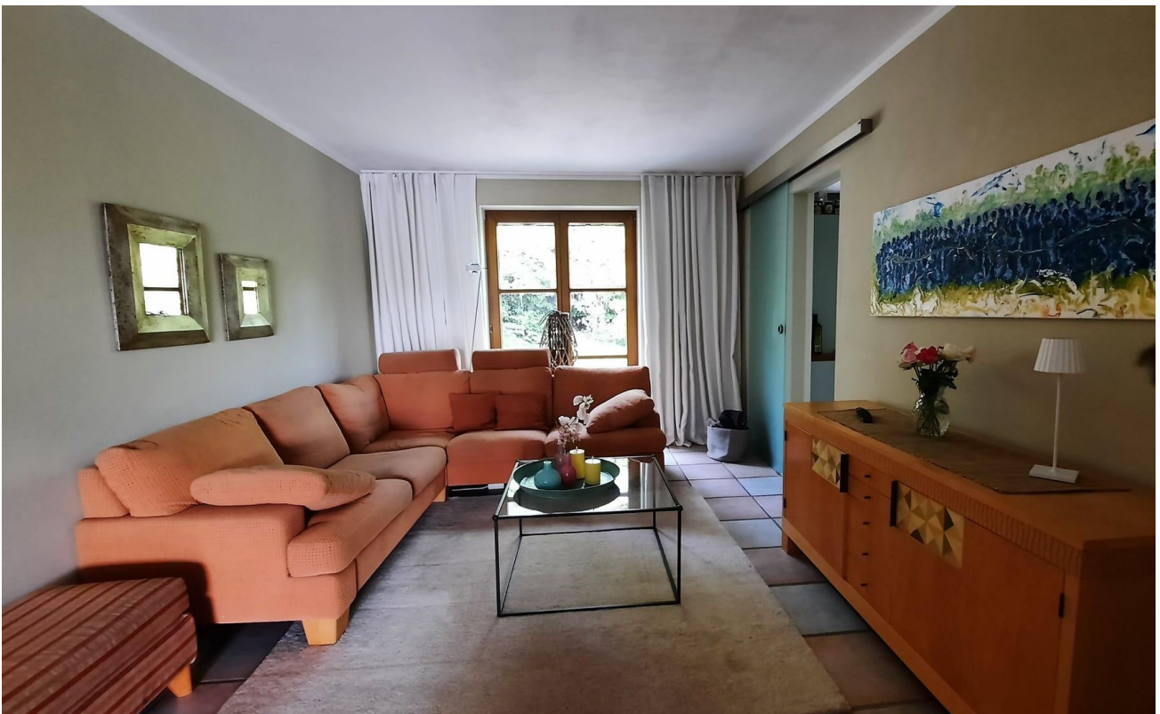
Wohnzimmer, Wohnung 1