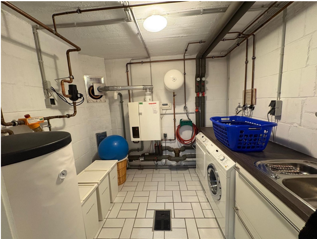
Keller, Heizung, Waschraum