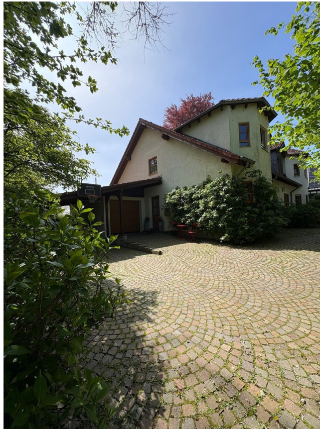
Seitenansicht, Eingang, Garage