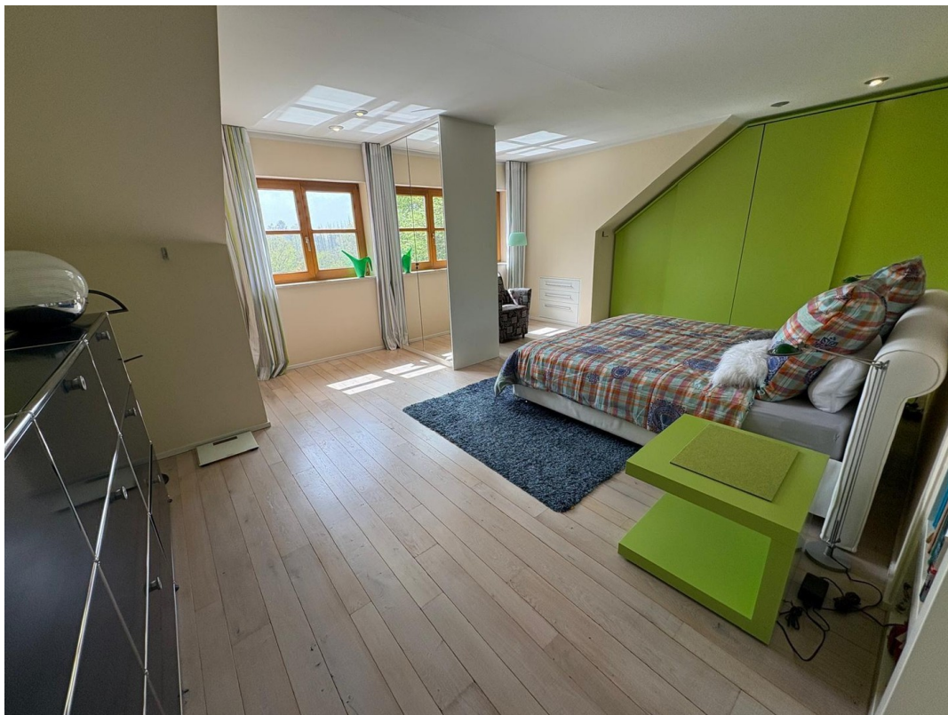
Schlafzimmer 1, Dachgeschoss