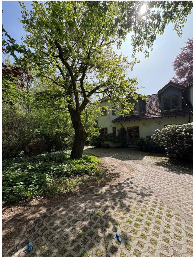
Vorderansicht mit Zufahrt