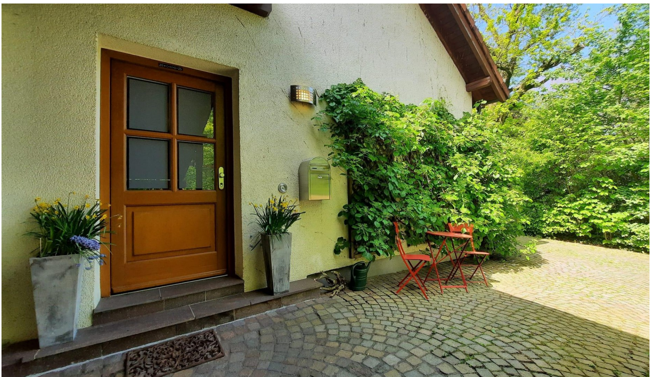
Eingang, Wohnung oben