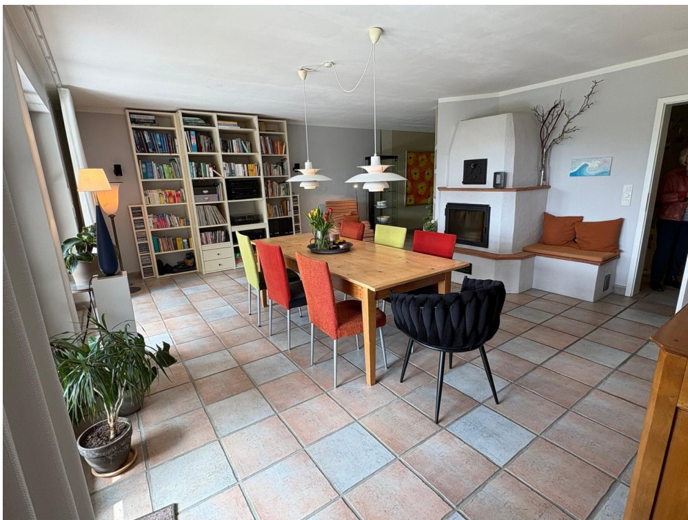
Esszimmer, Wohnung 1