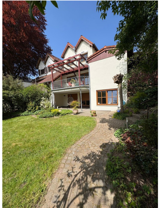
Rückansicht Haus, gartenseitig