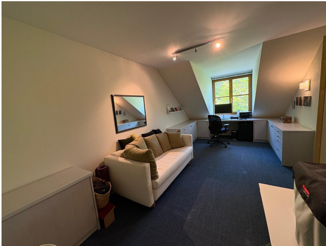
Schlafzimmer 2, Dachgeschoss