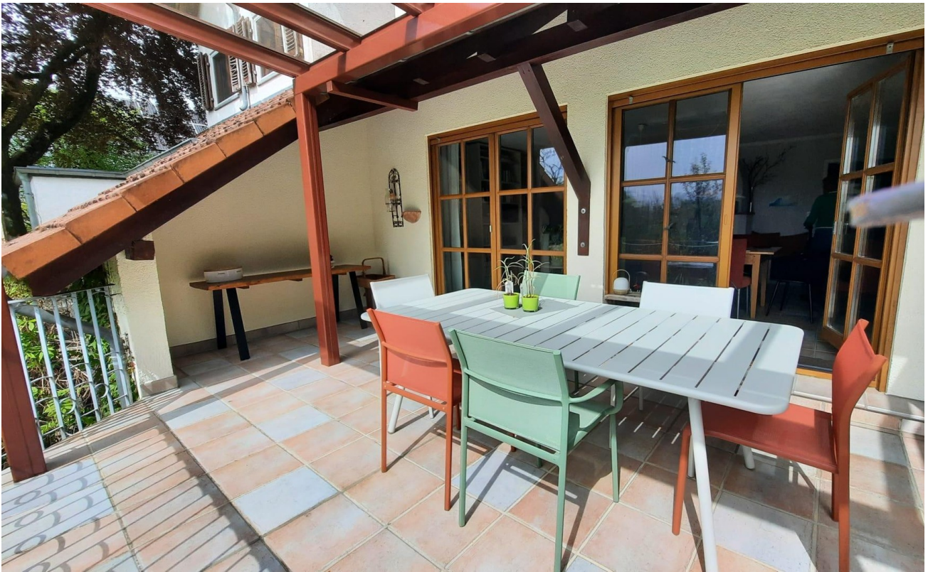
Terrasse, Wohnung 1