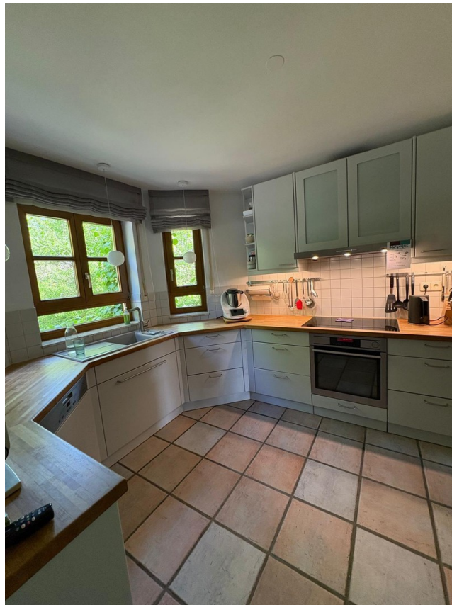
Küche, Wohnung 1