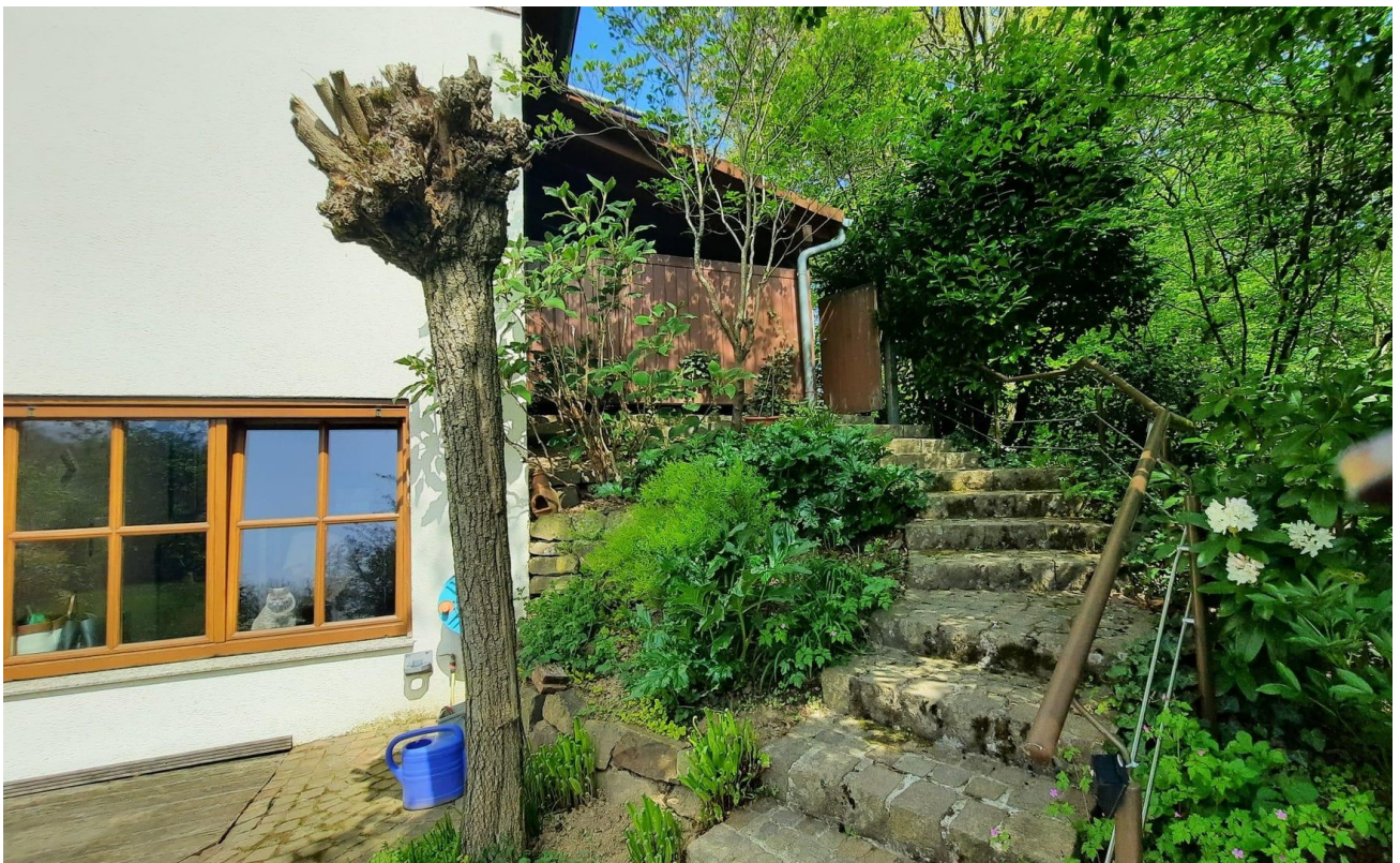
Treppe zum Garten, rückseitig