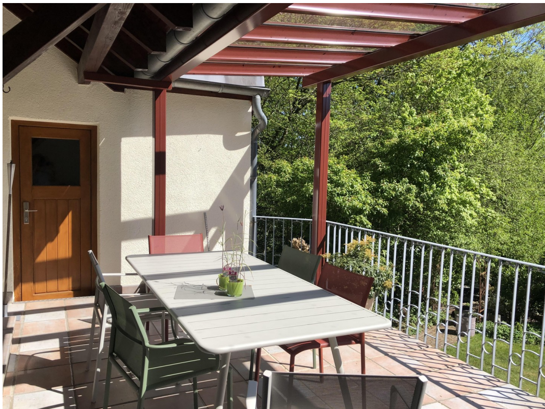
Terrasse, Wohnung 1