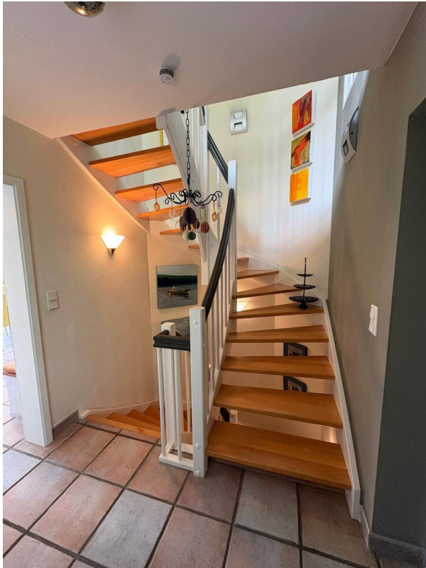
Treppe zum Dachgeschoss