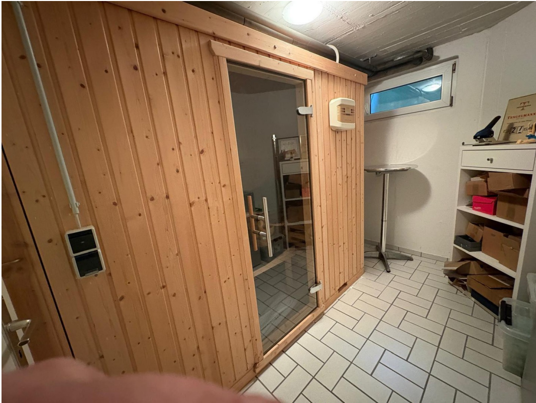
Keller, Sauna, Aufbewahrung