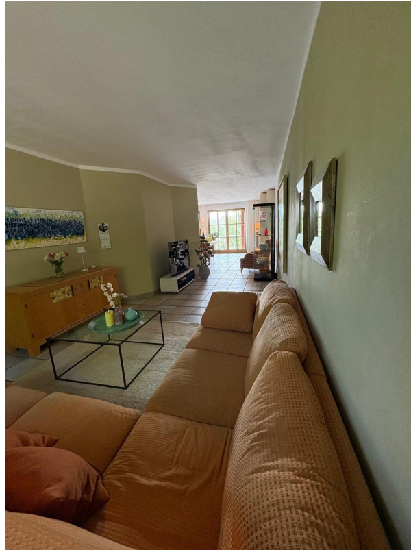
Wohnzimmer, Wohnung 1