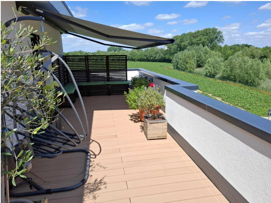
Östl. Teil der Dachterrasse