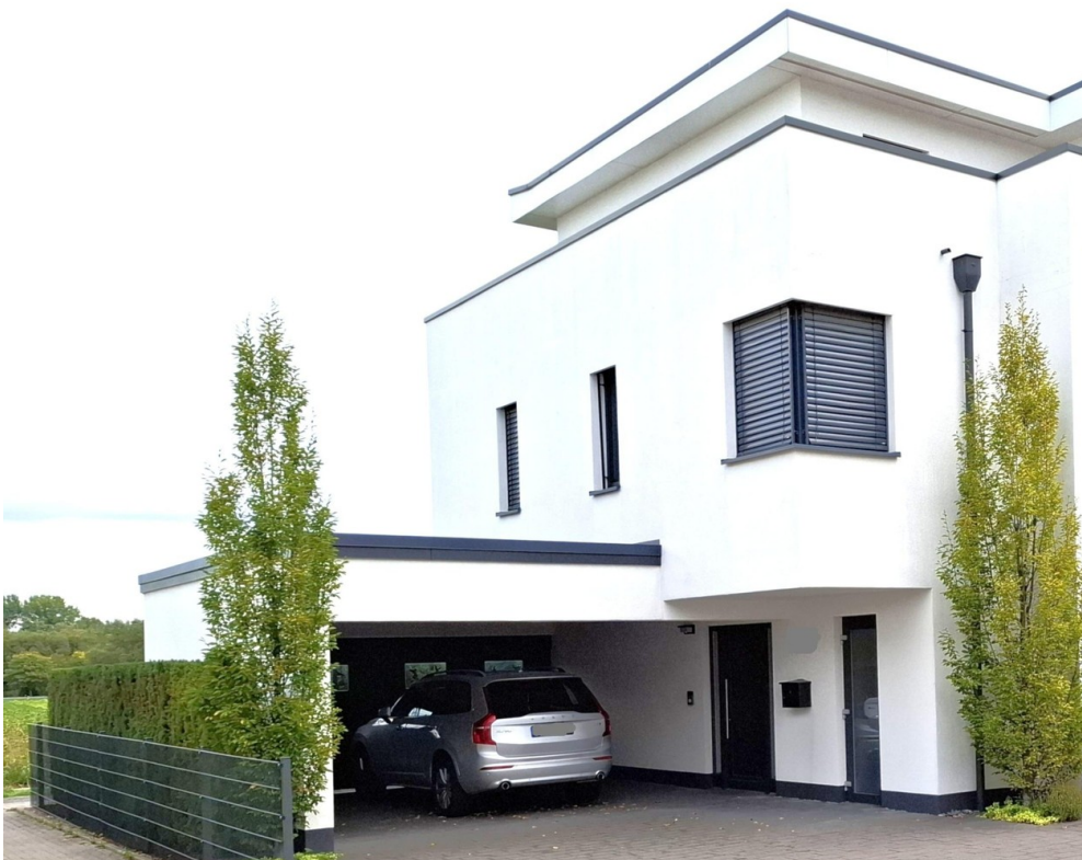
HHausansicht mit Doppelcarport