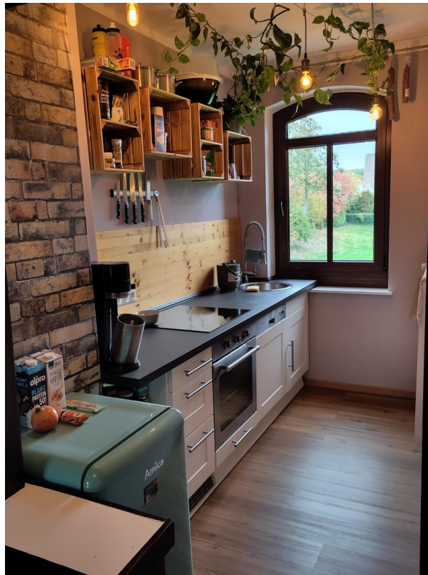
kleine Küche 1 OG