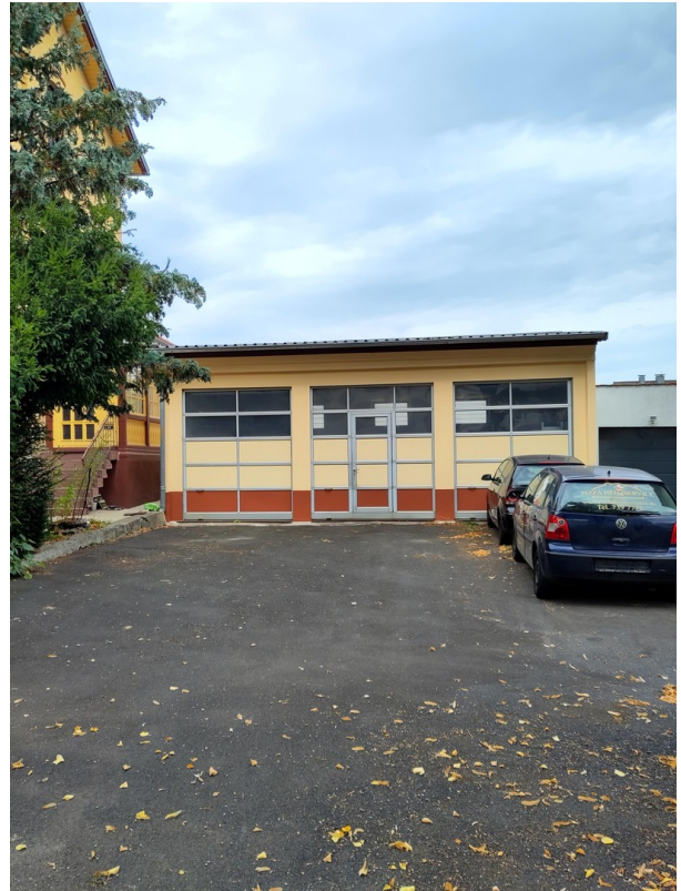
Halle für privat o. Gewerbe