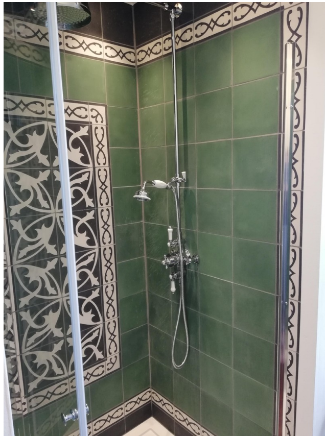
besondere Dusche EG