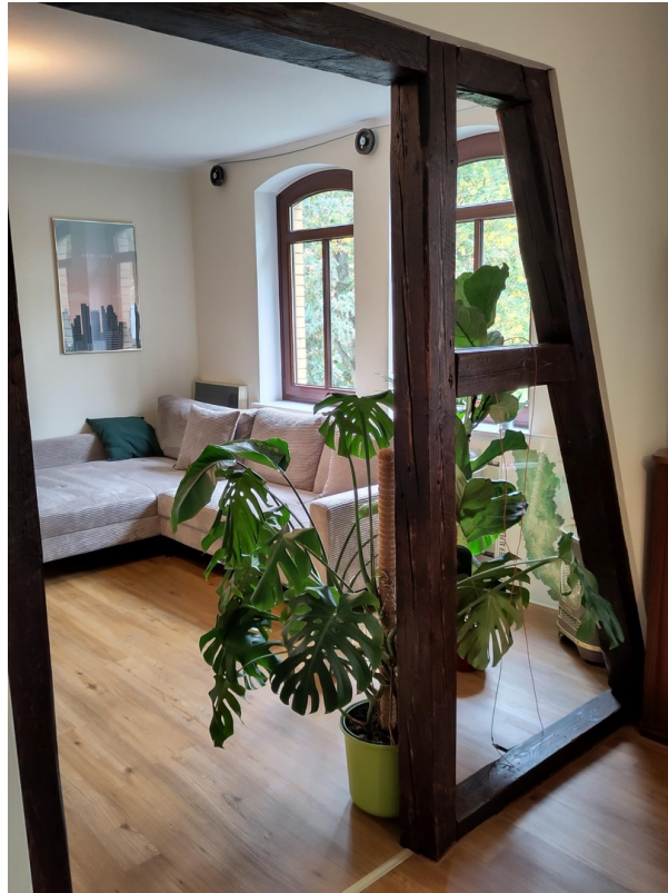
offene Zimmer 1 OG