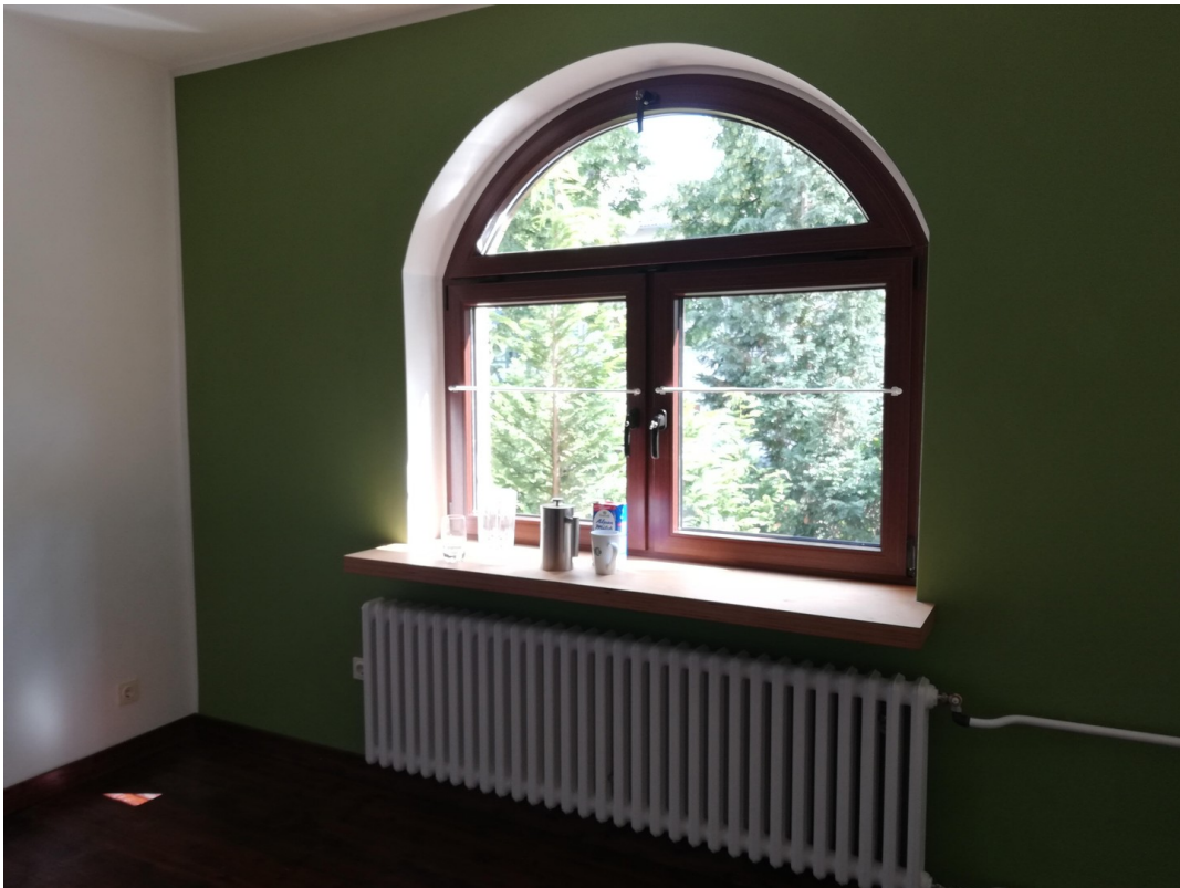
Rundbögen wieder hergestellt