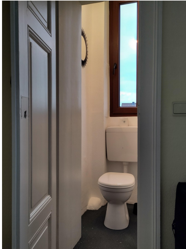
Toiletten im Treppenhaus