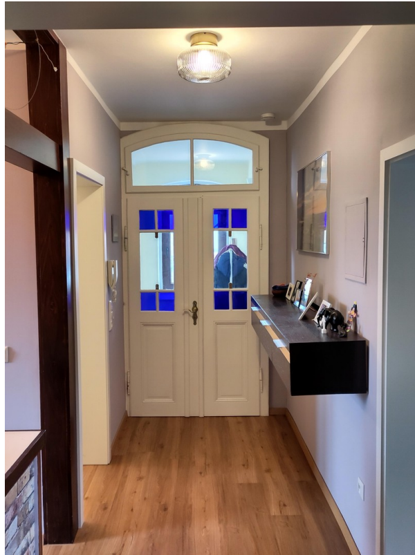
Flur 1 OG