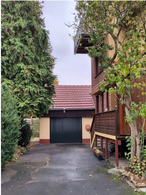
links vom Haus