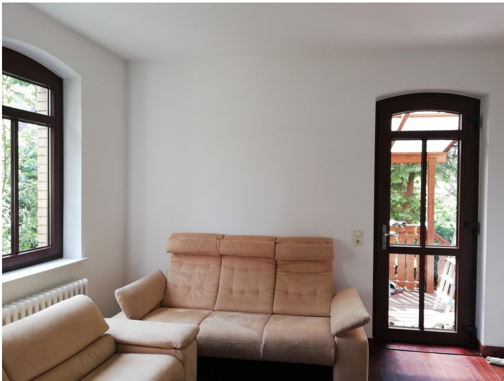
EG mit seperatem Eingang