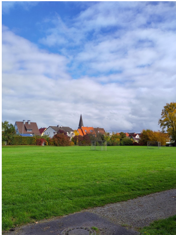
direkt hinterm Haus