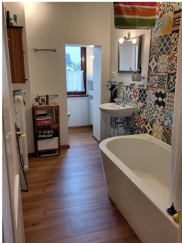
Bad 1 OG