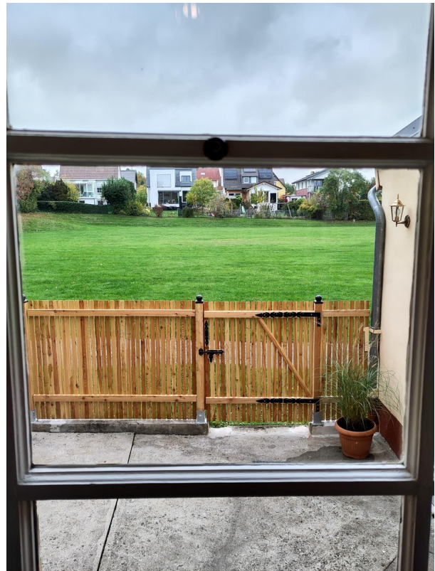
Blick aus dem Vorbau