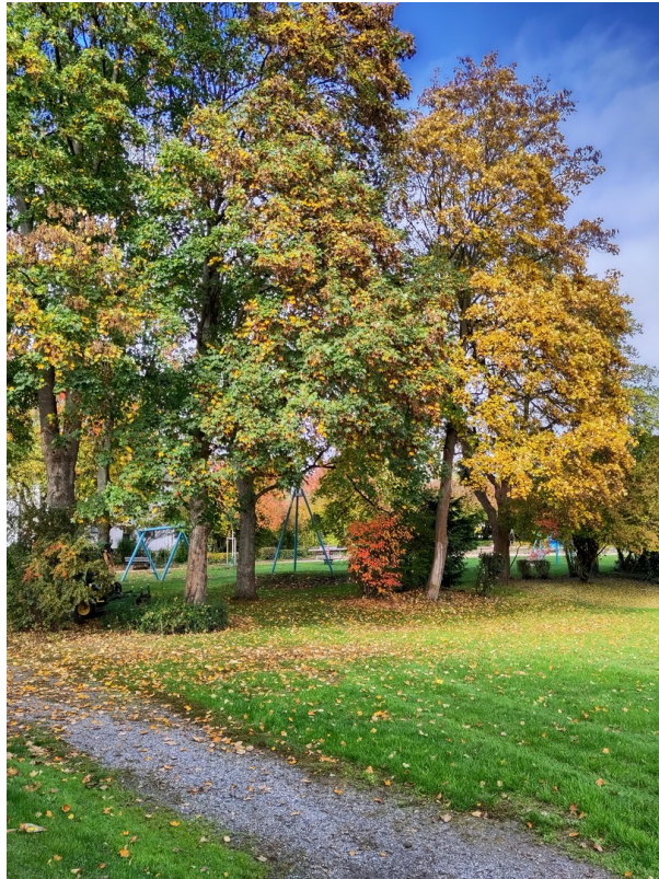
direkt hinterm Haus