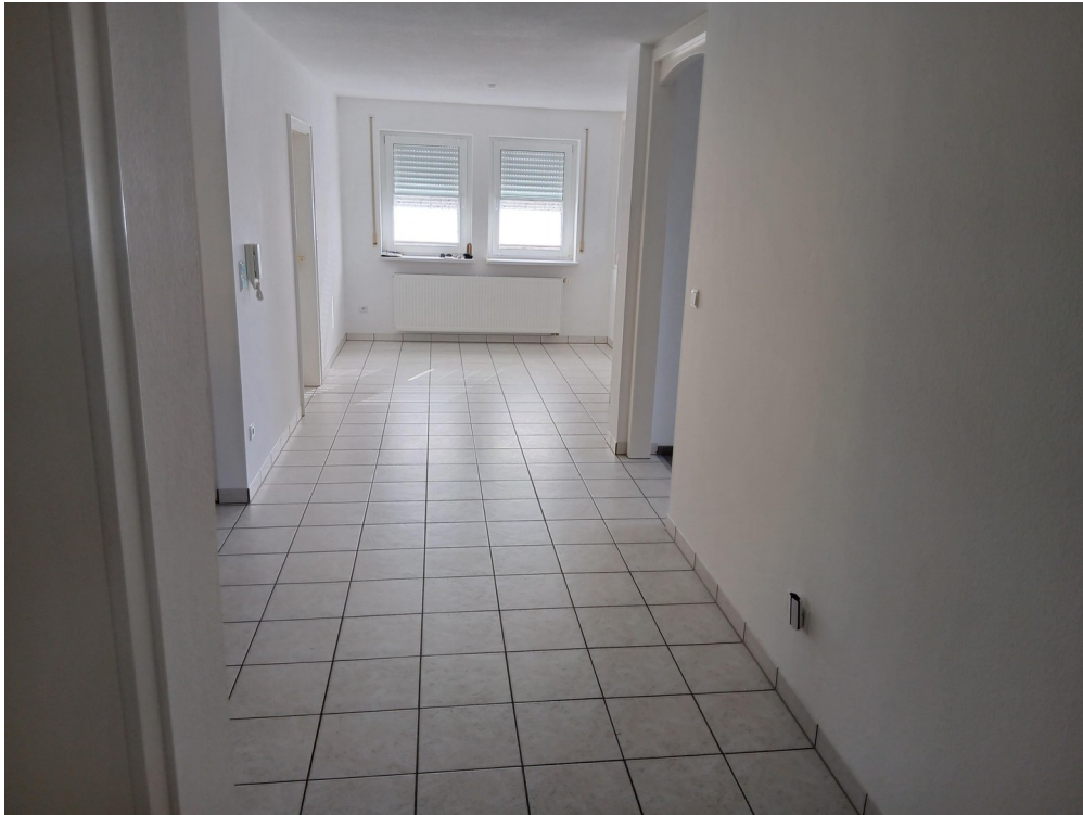
EG-Flur m. Eßecke