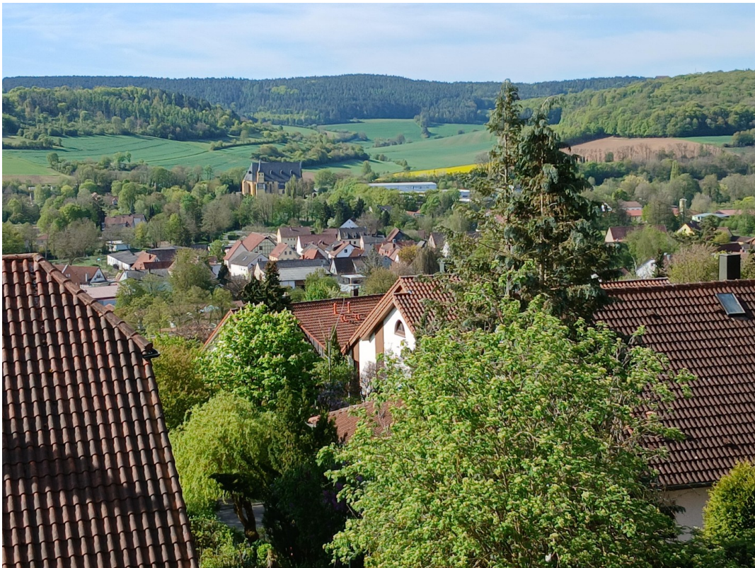
Aussicht nach Südwest