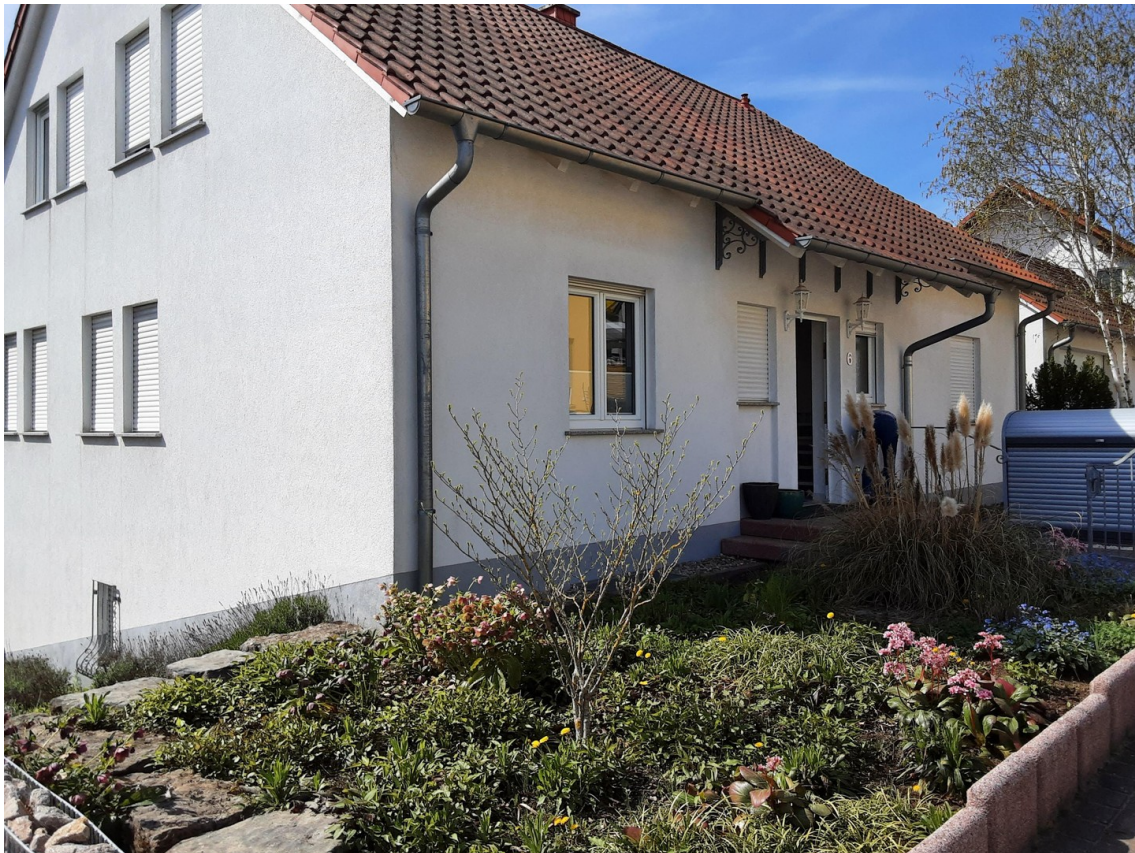
Ansicht v. Nord-West