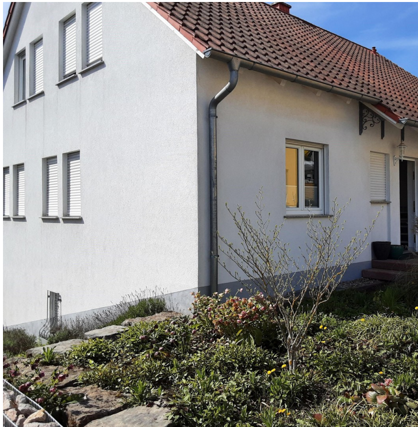
Ansicht v. Nord-Ost